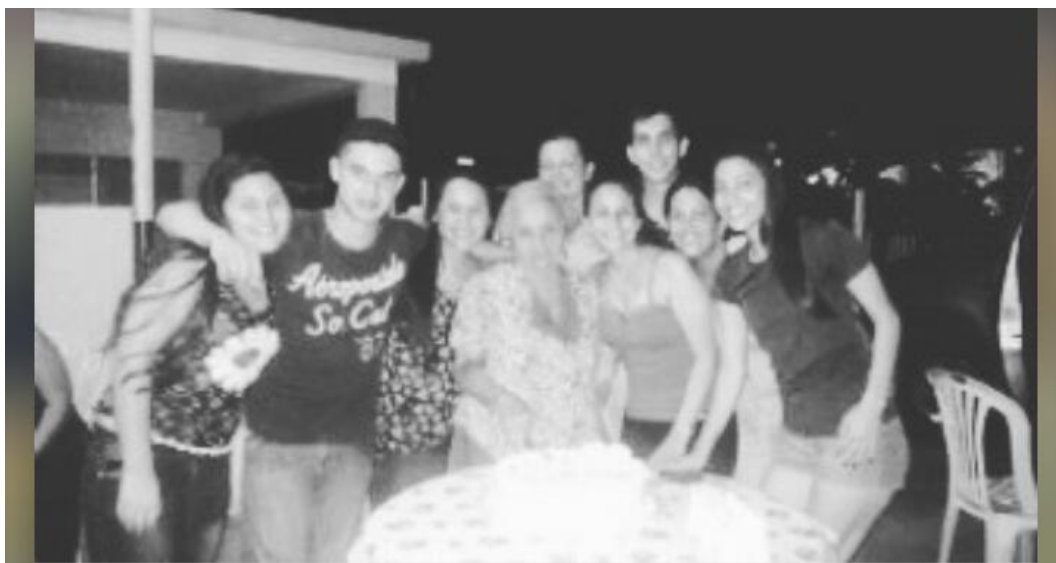
Foto 1. Encuentro familiar Boscán Vílchez

(Foto suministrada por la familia Boscán Vílchez, 14 de octubre de 2019).