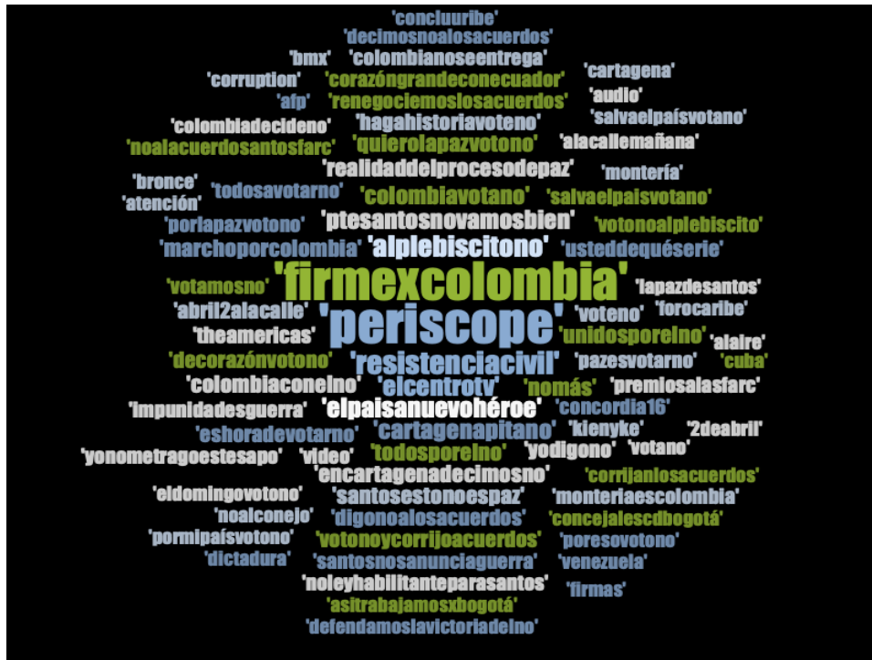
Gráfico 1: Hashtags más usados por Álvaro Uribe Vélez en Twitter 2016. Nube de palabras realizada con el programa Nvivo 11

Los hashtags compartidos por Álvaro Uribe en su perfil de Twitter pueden verse en el siguiente gráfico: