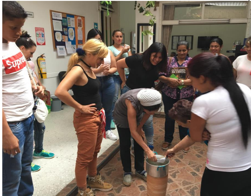
Foto 4. Carta a uno mismo. Lo que valoro de mi vida. Me reconozco, me valoro y me amo.

De igual forma, fue emocionante escuchar y conocer las historias de los y las participantes, lo que ellos valoraban de sus vidas, lo que los inspira y consideran importante de la misma, los sueños, metas, en donde algunas personas se lamentaban un poco, pues reconocían que nunca pensaban en ellos mismos, pero al tiempo, hacíamos una reflexión colectiva, de lo importante de dedicarse tiempo a uno mismo, en hacer lo que más los hace felices, pues nunca es tarde para comenzar a trabajar en uno mismo.