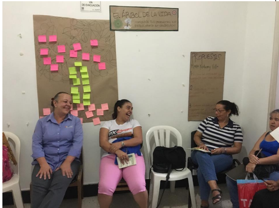
Foto 3. Árbol de la vida, disfrutando y creciendo con mi árbol.

fueron muy apropiados, además es un espacio en donde salen de la rutina y se puede compartir con los demás padres de familia.