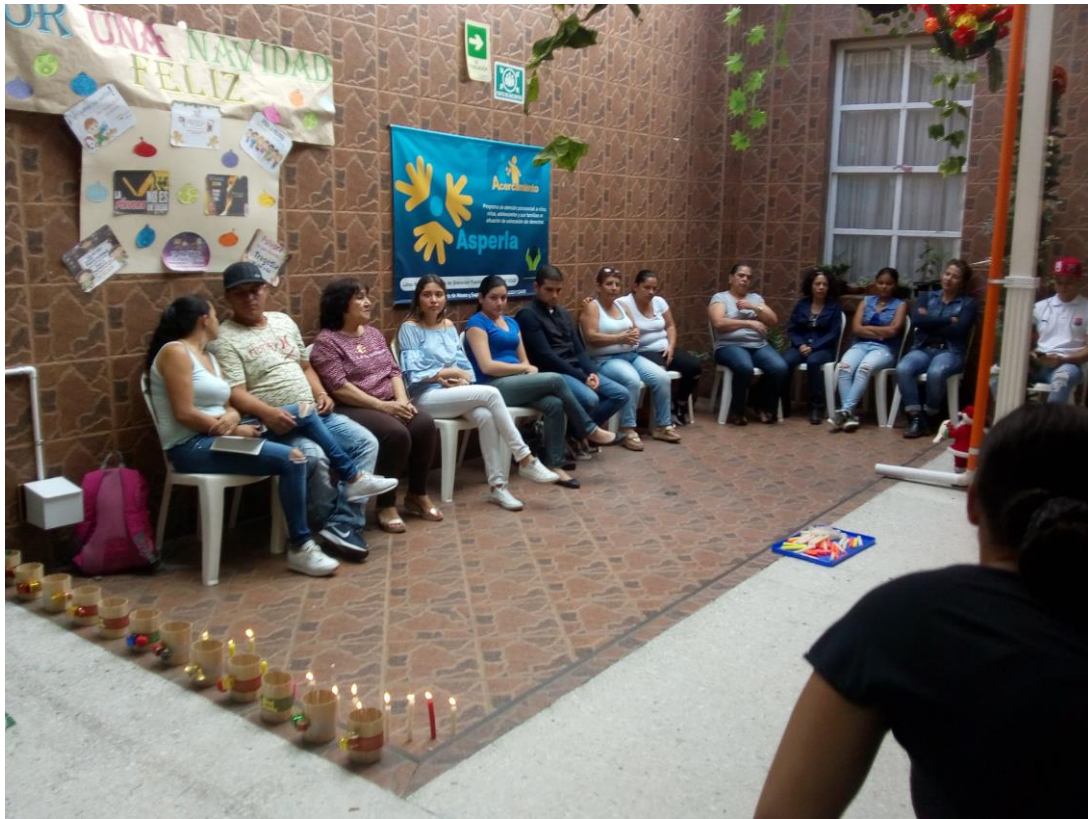
(Registro fotográfico programa Acercamiento, 18 de Diciembre de 2018)