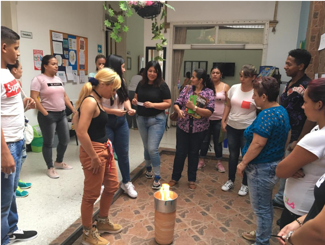
(Registro fotográfico programa Acercamiento, Abril de 2019)