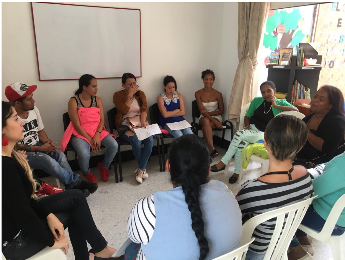
(Registro fotográfico programa Acercamiento, 12 de Septiembre de 2018)