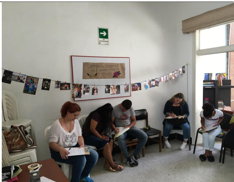
Foto 2. Contando historias para respirar, imaginar y relajarse.