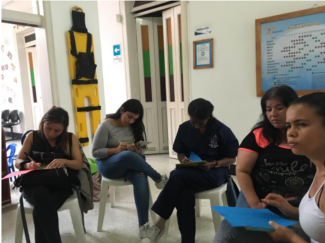
(Registro fotográfico programa Acercamiento, Enero de 2019)