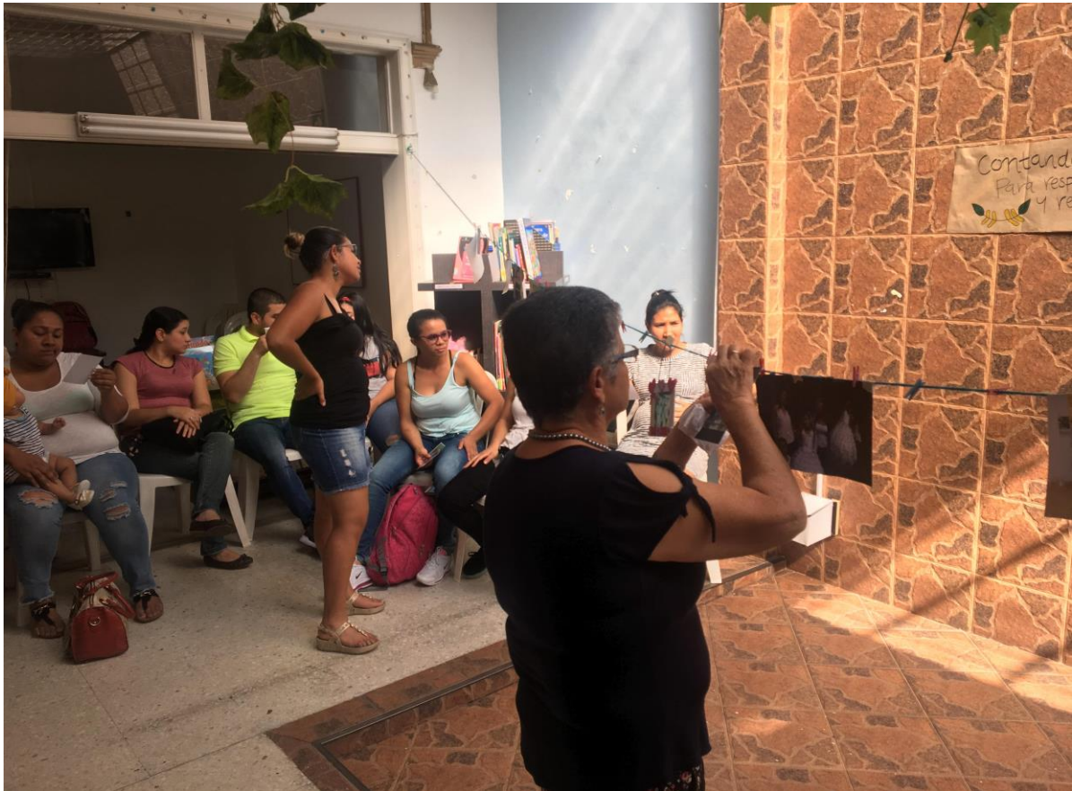
(Registro fotográfico programa Acercamiento, Febrero de 2019)