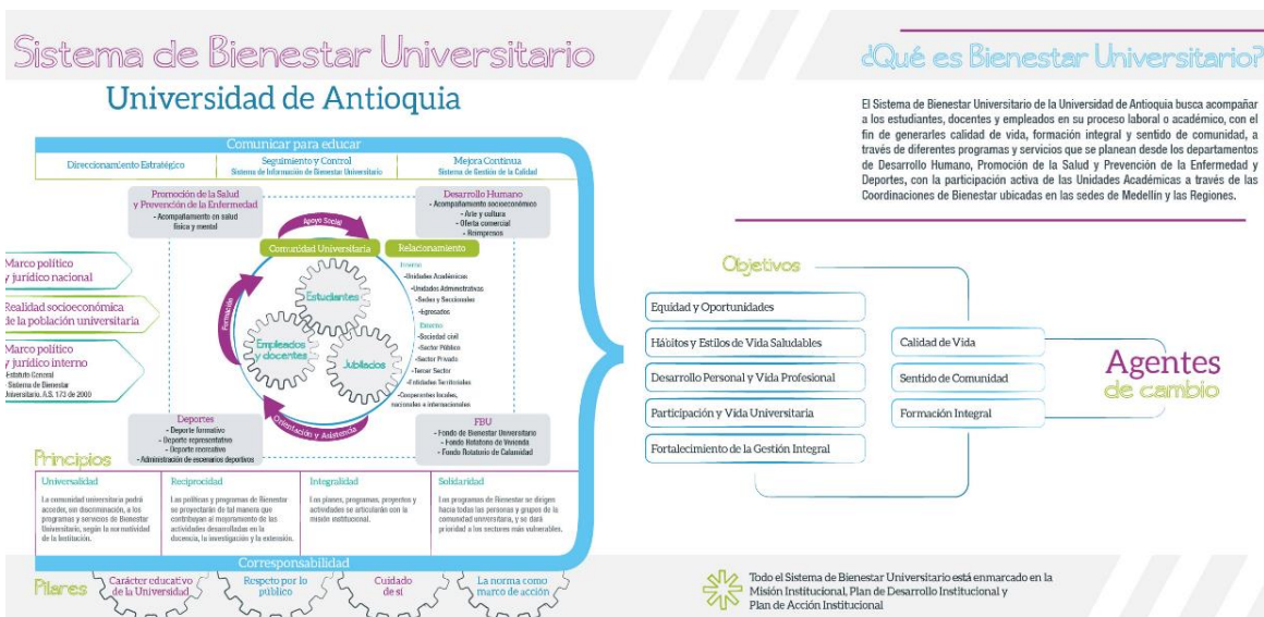
Imagen 1 Sistema de Bienestar Universitario