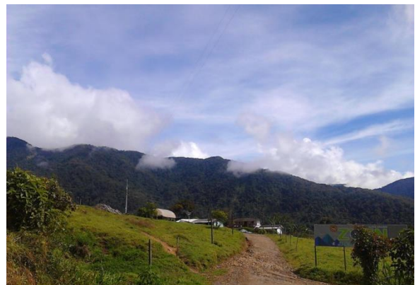
Ilustración 3 Fotografía vereda Llanogrande, municipio de Dabeiba 2017

Esta zona queda ubicada a unos 20 kilómetros de Dabeiba, para llegar a esta vereda se debe transitar por una carretera que se encuentra en regular estado y que se agrava en época de invierno. De manera