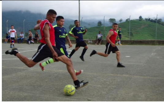
Ilustración 17