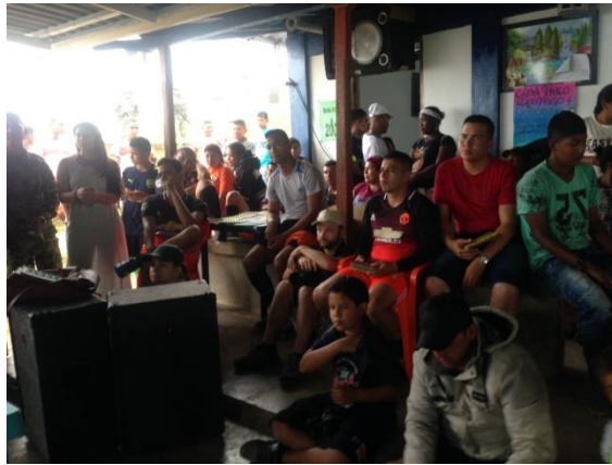
Ilustración 18