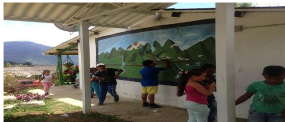
Ilustración 12