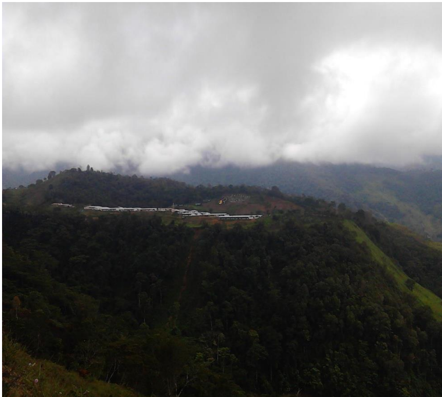
Ilustración 7 Fotografía tomada a el ETCR Jacobo Arango en el 2017

En las zonas veredales en un primer momento se planteó un cordón de seguridad al que únicamente podría acceder el mecanismo tripartito de verificación, conformado por las fuerzas del Estado, las Farc y la ONU allí se impedía realizar manifestaciones políticas, así como el porte o tenencia de armas; las autoridades públicas no armadas podrían ingresar, excepto a los campamentos. El Gobierno con la Agencia para la Reincorporación Nacional (ARN) y la Oficina del Alto Comisionado para la Paz (OACP) en este periodo pusieron en marcha acciones de verificación de condiciones de salud, cedulaación y otras preparatorias para el proceso de reincorporación social y económica. (El Espectador. 2017).