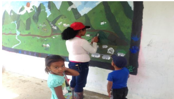
Ilustración 11