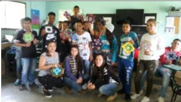
Ilustración A archivo personal Kathering Hernandez