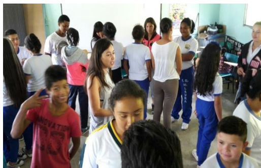
Ilustración 13