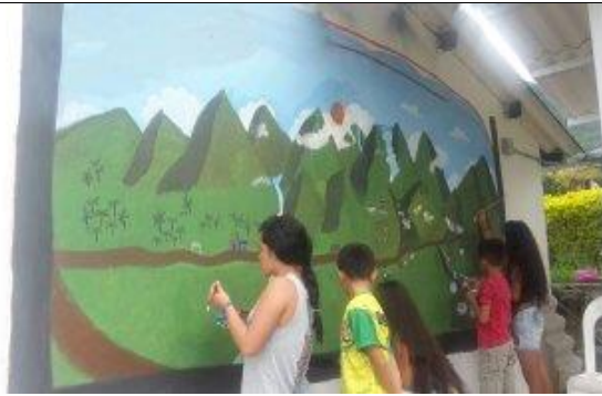
Ilustración 10