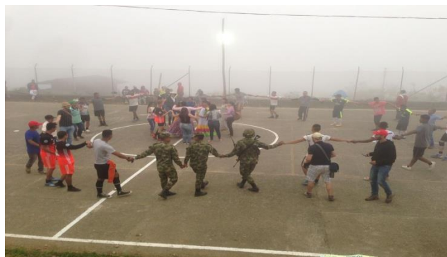
Ilustración 16

En torno a la reconciliación se logró que en esta jornada las personas entre adultos, jóvenes, adultos mayores, mujeres, niños, niñas e instituciones compartieran diferentes espacios de integración. Al tiempo que se desarrollaban actividades en el ETCR se desarrollaban igualmente en la vereda, se tuvieron opciones de participar en diferentes actividades, se logró participación y trabajo conjunto entre las personas excombatientes y habitantes de la vereda. Personas de veredas vecinas acudieron y se integraron en las actividades, conociendo de cerca el proceso, consiguiendo acercamiento con la población en reincorporación y compartiendo en comunidad.