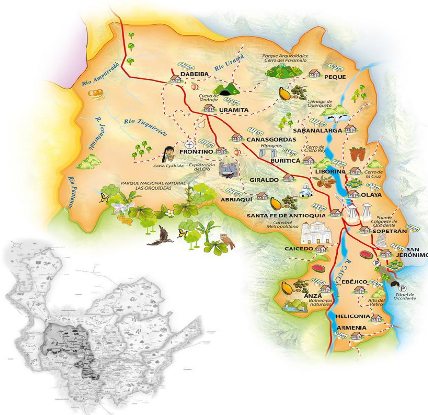
Ilustración 1 Mapa Dabeiba: tomado de página Web Alcaldía Municipal particularidades del municipio de Dabeiba.

Analizando entonces la actualidad de la región se pueden evidenciar algunos escenarios de riesgo que pueden alterar la convivencia y la seguridad; adicionalmente, la participación política de las FARC trae represalias por grupos de paramilitares, quienes además estigmatizan comunidades y líderes sociales. El conflicto armado y sus diferentes manifestaciones en el municipio, ha dejado como consecuencia, afectaciones a la convivencia, baja participación, poca creencia en los procesos estatales, desarticulaciones sociales, miedo e inseguridad en los habitantes, entre otros aspectos. para continuar es pertinente presentar algunas