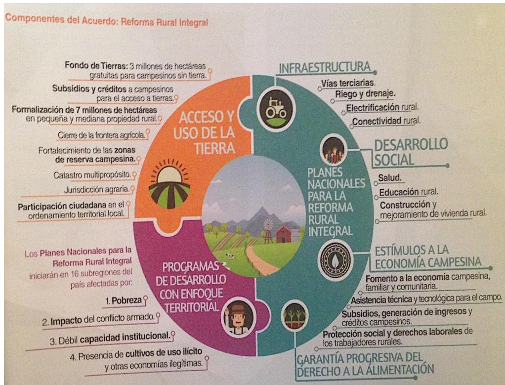
Ilustración 8