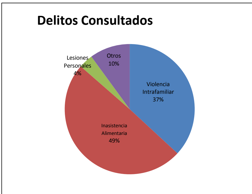
Gráfico 2 Delitos consultados entre los meses febrero a octubre