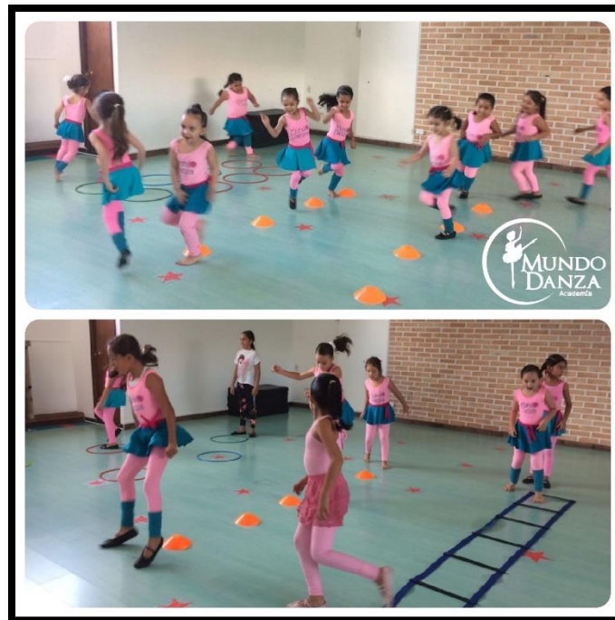
Foto 3. Ejercicios de saltos y equilibrio

El principal objetivo de la Academia Mundo Danza , es acompañar a los niños desde su ingreso, con el proceso de acercamiento a la danza como actividad artística, enfocando este al movimiento rítmico, al seguimiento de secuencias rítmicas, condicionando y preparando el cuerpo previamente a través del desarrollo de habilidades motrices. Foto 3.