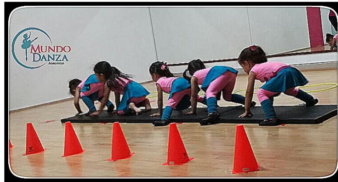
Foto 4. Fortalecimiento de la cadena cinética inferior

Los niños de la Academia Mundo Danza , se forman en danza a la par de su desarrollo motriz, fortalecen todas las cadenas cinéticas, mejoran su fuerza, elasticidad, agilidad, por medio de circuitos empleados durante las clases. Además, la danza necesita de una buena preparación física a cualquier edad, más aún en la niñez, que es la etapa con mayor importancia para un buen desarrollo. Foto 4.