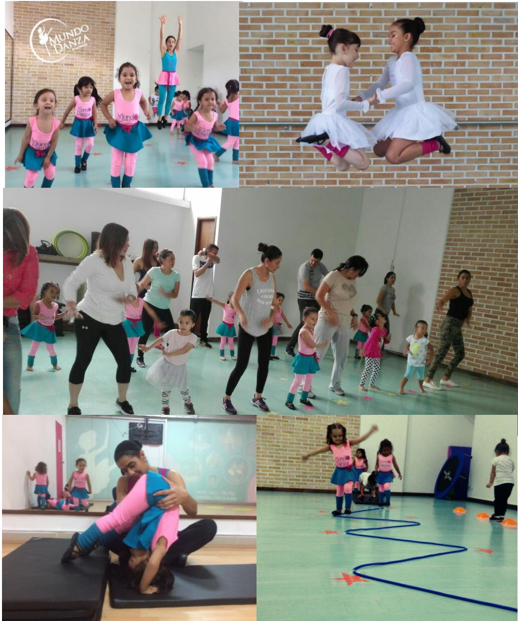
Foto 1. Integración con padres de familia y ejercicios de flexibilidad