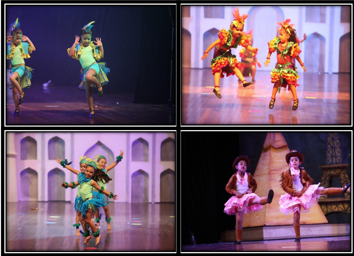
Foto 5, 6, 7 y 8: Montaje general de clausura.

En las anteriores fotografías, nos damos cuenta de los resultados del trabajo con la lúdica para desarrollar la motricidad, la expresión corporal y facial y sobre todo, se denota el disfrute y el goce por la danza, evidenciado en la clausura del montaje general de la Academia Mundo Danza en el municipio de Sabaneta; donde los padres puede ratificar los avances y resultados de creer en el proceso de nuestra academia.