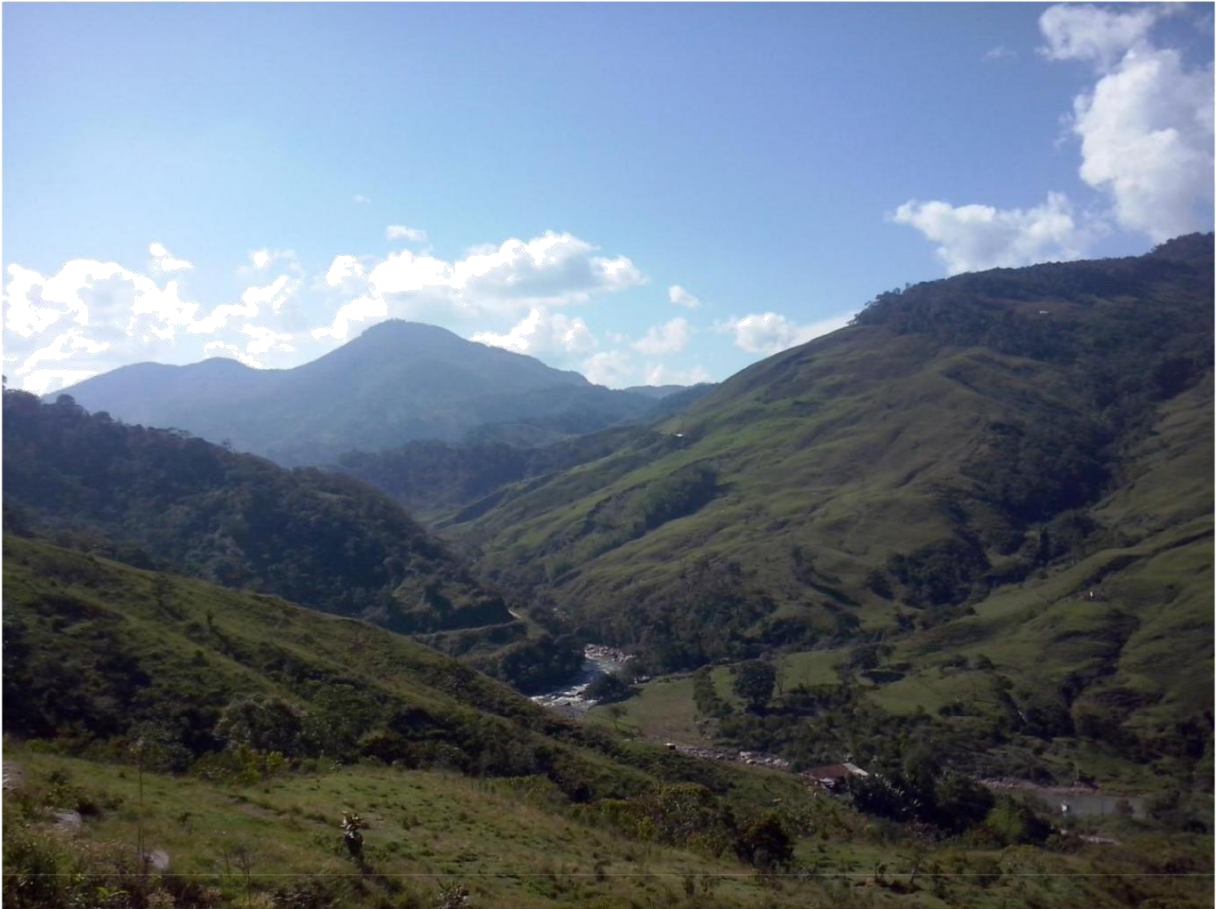
Vereda San Miguel, Alejandría Antioquia