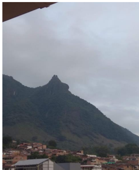
Figura 3. Fotografía del paisaje municipio de Támesis Antioquia

Támesis se caracteriza por poseer un gran número de minifundios, ubicados principalmente en las veredas, como son: La vereda el Corozal, el Rayo, el Encanto, el Mirador, Campo Alegre, San Luis, Olaya, San Antonio, entre otras; donde los trabajadores rurales se dedican trabajar en su propia tierra, como fuente principal de ingresos. Actualmente, se encuentran organizaciones activas en las cuales se presentan la ejecución de proyectos productivos y de comercialización, algunas de estas organizaciones son: Asociación Campesina de Café Especial del Municipio de Támesis (ASCAFES), Asociación de Cacaoteros de Támesis (ASOCACAOTEOS), Asociación de Familias Campesinas por un Campo Mejor (ASOFAMILIA), Asociación de Fiqueros (ASOFIQUE), Asociación de Productores de Café (ASPROCAFES), Circuito Económico Solidario (CESTA), Cooperativa Multiactiva Mujeres Emprendedoras y Lideresas (COOPMELISAS), El Trapiche Comunitario La Mirla, Asociación Agropecuaria de Támesis (ASOTAGRO). entre otras. (40)