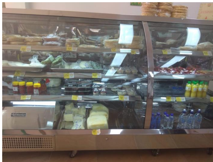
Figura 4. Productos de los campesinos en la Casa de Emprendimiento Rural.

Estas organizaciones del municipio de Támesis se han dedicado a la comercialización en lugares de comodato como la Casa de Emprendimiento Rural, donde recurren a la comercialización de sus productos dado el abandono del Estado y la falta de oportunidades de mercado. Actualmente se encuentran en proceso de búsqueda de mercados justos para la venta de sus productos y lograr el fortalecimiento campesino.