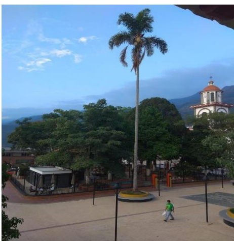
Figura 2. Fotografía del parque municipio de Támesis Antioquia.

La ubicación geográfica y la topografía del municipio le permiten tener una oferta económica potencial de diversos productos; la economía municipal está caracterizada principalmente por la producción agrícola primaria, destacándose el café, el plátano, el banano, la caña de azúcar, el cacao, el maíz, el frijol, la yuca, la naranja, la mandarina, la maracuyá, la lima Tahití, el cardamomo y el aguacate, también se destaca la ganadería y en menor grado la piscicultura; es de anotar que la mayor parte de la población está culturalmente ligada a la actividad agrícola. (40)