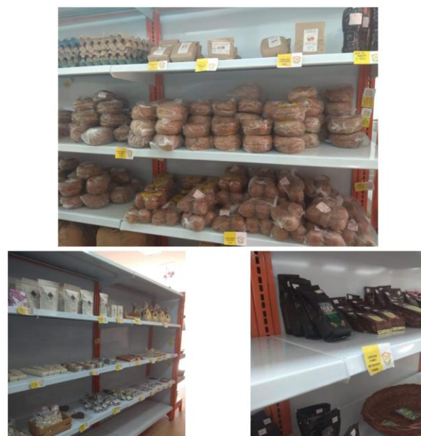
Figura 5. Panela - café producido por campesinos de Támesis. Casa del Emprendimiento Rural

garantice a los campesinos vivir dignamente, desarrollando economía de base, por medio de vinculaciones como la Casa del Emprendimiento Rural, creando estrategias para recuperar el campo tamesino; siendo necesario repoblar la zona rural, como mecanismo de desarrollo integral, buscando la soberanía alimentaria y la población pueda beneficiarse de su propia producción agrícola, desde el gobierno central se debe establecer el diálogo entre lo urbano y lo rural, haciendo nodos de cohesión y hábitat comunitaria.