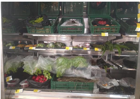
Figura 6. Legumbres y frutas. Casa del emprendimiento Rural.

“(...) entre las familias (...) porque no todos producimos todo, entonces hacemos intercambios, que tiene una familia, que no tengo y hacemos los intercambios, después de que hemos hecho los intercambios personales, (...) se mira que queda aún y se saca al mercado”. (TA7C2)