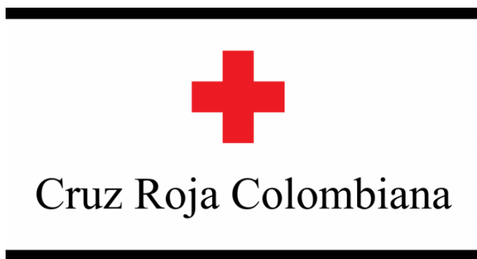
Ilustración 1. Emblema Cruz Roja Colombiana

El Emblema de la Cruz Roja, es el signo visible de la protección que el derecho internacional humanitario (DIH) confiere al personal y a los bienes destinados a la asistencia y protección de las víctimas en los conflictos armados.