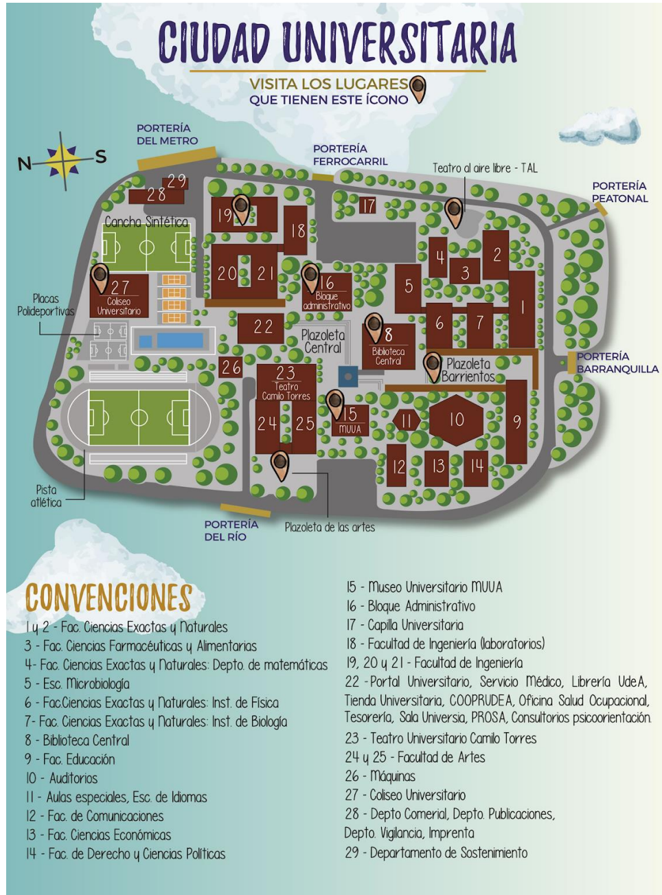
Mapa Ciudad Universitaria.