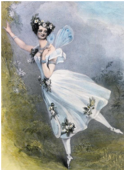
María Taglioni en La Sífide.