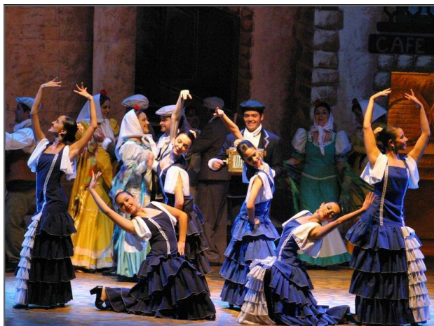
Imagen 8. Bailarinas de Medellín en Zarzuela La Verbena de La Paloma. 2006.

Sin embargo no se tiene referencia de haber logrado con estos grupos de bailarines una clase completa de Danzas de Carácter, más bien se podría decir que se les enseñaron variaciones, más no la técnica propia del Carácter.