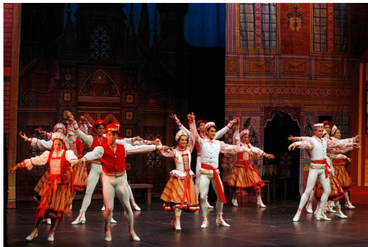
Imagen 7. Cuerpo de baile del Ballet de Cuba. Danza Czardas de Coppélia

Por su parte, en Venezuela encontramos la Universidad Nacional Experimental de las Artes Unearte. Existe una carrera en danza, la cual cuenta con cuatro programas, uno de los cuales es Licenciatura en Danza Mención Intérprete Danza Clásica; el currículo de este programa para el año 2013 cuenta con un taller en danzas históricas y de carácter en el lapso II del primer trayecto 4 . Sin embargo, antes de la existencia de este programa, en Venezuela se aprendían las Danzas de Carácter cuando se montaban las obras de ballet que tenían variaciones de este tipo, es decir, no había un estudio