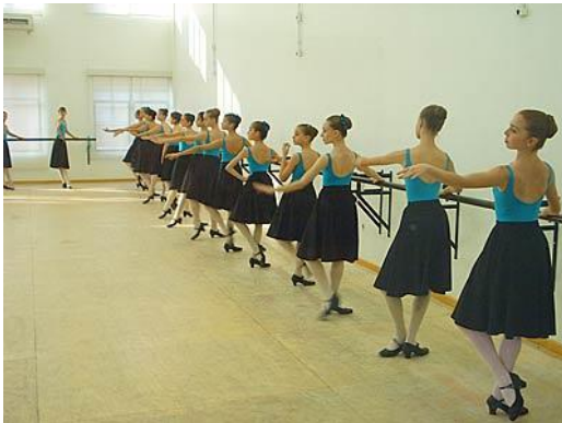
Imagen 5. Clase de Danza de Carácter en la Escuela Bolshoi en Brasil.

Pesquisando en Latinoamérica encontramos la segunda filial del Teatro Bolshoi en Joinville - Santa Catarina, Brasil. Esta escuela sigue los lineamientos de la escuela rusa y dentro de su currículo está: danza clásica, danza folclórica, danzas populares históricas, Danza de Carácter, repertorio de ballet clásico, pas de deux, danzas populares brasileras, danza contemporánea, teoría musical, educación musical y rítmica, lengua extranjera, Historia del ballet, del teatro y de las artes, maquillaje, dramatización y práctica escénica. 3