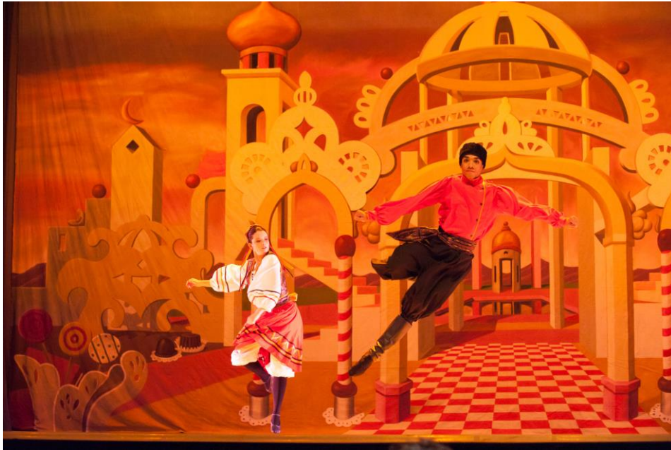
Imagen 9. Danza rusa. Ballet Cascanueces. Medellín, 2011.

De esta forma se evidencia la importancia que tiene para el exacto conocimiento y dimensión del fenómeno de la danza, el estudio y acercamiento a algunos de los ritmos folclóricos europeos que se pueden ver en las Danzas de Carácter dentro del ámbito del ballet clásico.