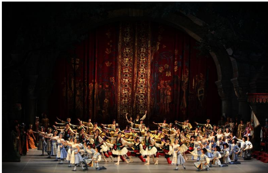
Imagen 12. Ballet Raymonda . Teatro Alla Scala.

Tras el éxito de El lago , a Petipa todavía le quedaba por realizar una última gran obra [...] Esta última gran obra sería Raymonda , conocido hoy en día principalmente por su famoso divertissement del acto III [...] Raymonda cuenta de nuevo con un argumento complicado e improbable, pero con una coreografía magistral en su estilización de las danzas de carácter de origen húngaro (aunque en el divertissement del acto II aparece la ya familiar danza española asociada con las obras de Petipa) (Abad Carlés. 2010, pp. 117-118).