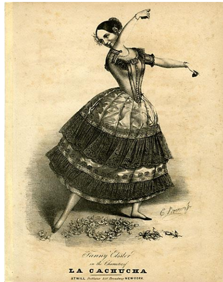
Fanny Elssler en La Cachucha.