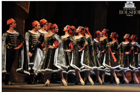
Imagen 6. III Acto del Ballet Raymonda en el marco del 30º Festival de Danza de Joinville 2012.

En Cuba encontramos La Escuela Nacional de Ballet que cuenta con ocho años preparatorios, cinco en nivel elemental y tres en nivel medio. A partir del cuarto y quinto año elemental comienzan a estudiar Danzas de Carácter con una intensidad de