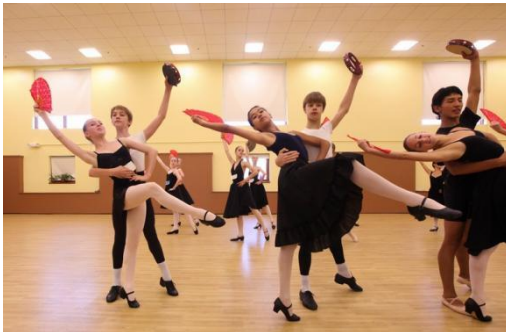
Imagen 1. Clase de Danza de Carácter en curso de verano. Ballet Bolshoi en NY.