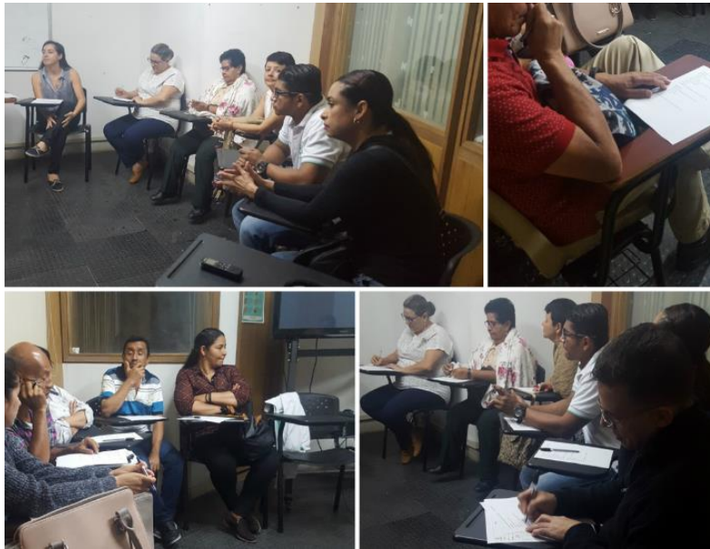
Imagen 7. Taller: la familia como entorno protector. Elaboración propia, febrero 28 de 2019, 6:00 p. m.

entorno protector y, el hogar como principal entorno protector, se cumplió en un 100%, pues en el encuentro participaron 14 padres de familia, activos, críticos y abiertos al aprendizaje.