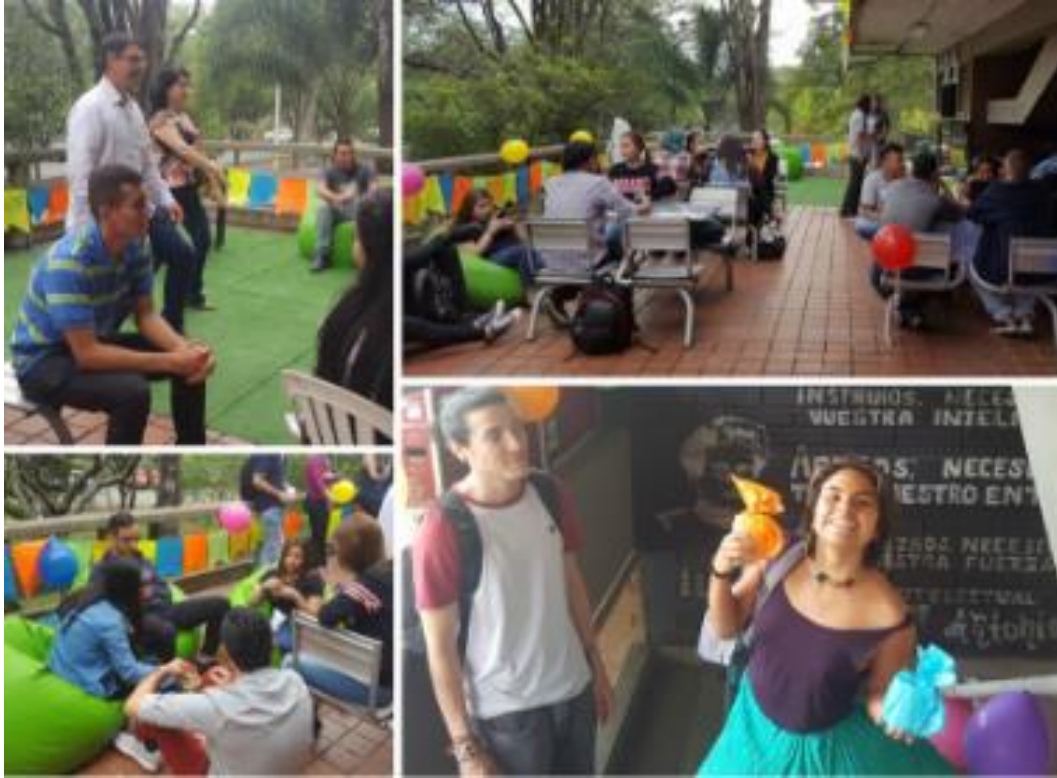
Imagen 8. Inauguración oficina de Bienestar. Martínez, A., marzo 15 de 2019, 11:00 a. m.

a los servicios, dinamizar las actividades, tomar registro de los participantes y en general apoyar al equipo de trabajo en la logística.