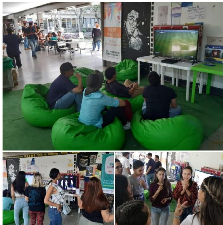
Imagen 14. Ludoteca. Elaboración propia, septiembre 12 de 2019, 12:00 p.m.