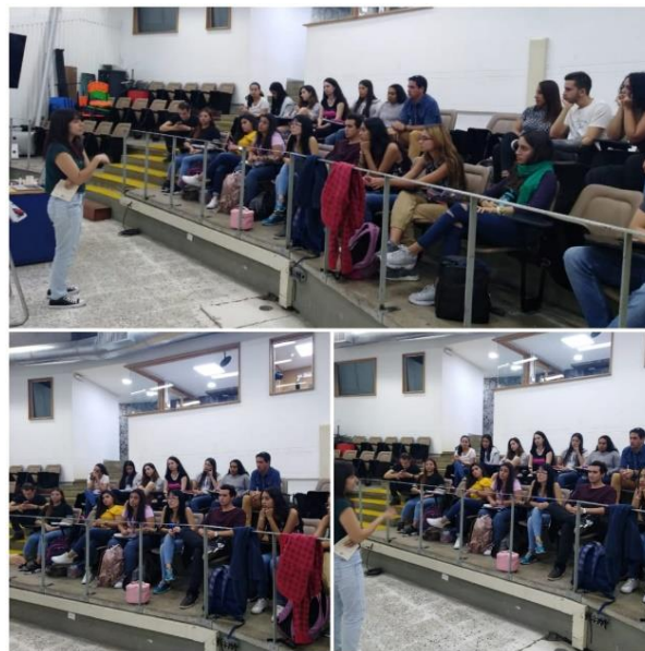
Imagen 12. Socialización: Ruta de atención a violencias sexuales y de género, Ruiz, A., agosto 20 de 2019, 11:00 a. m.

En esta actividad los estudiantes se mostraron participativos, motivo por el que se logró resolver dudas sobre procedimientos para realizar una efectiva denuncia, acompañamiento de la Universidad en los procesos y, alternativas para situaciones en las que las que prefieren no denunciar. Desde la práctica profesional se realizó la socialización de la ruta y se brindó apoyo al momento de resolver las dudas de los estudiantes, además de realizar la invitación a acercarse y participar de las actividades de Bienestar.