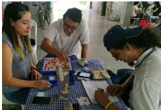
Imagen 5. Stand: Ruta de Atención a Violencias Sexuales y de Género. Elaboración propia, mayo 10 de 2019, 9:00 a.m.

Finalmente, la meta de haber implementado 4 stands promocionando los servicios de Bienestar y estrategias para mejorar el paso por la universidad hasta el 30 agosto, se cumplió en un 100% puesto que, fueron realizados de acuerdo a lo esperado y, aunque se cambió uno de los temas, fue por una necesidad urgente para la comunidad de la Facultad.