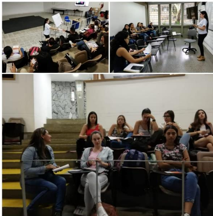
Imagen 16. Ruta de prevención del Suicidio. Ceballos, S., septiembre 10 de 2019, 11:00 a.m.