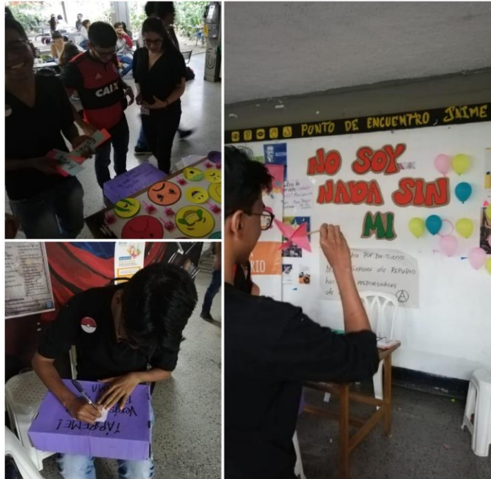
Imagen 15. Stand: amor propio. Ceballos, S., septiembre 11 de 2019, 9:00 a.m.