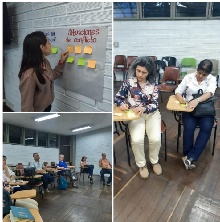
Imagen 11. Taller: resolución de conflictos. Elaboración propia, agosto 29 de 2019, 6:00 p. m.

Se obtuvo la participación de 14 personas, quienes estuvieron abiertas al aprendizaje y optimizaron el espacio aclarando muchas de sus dudas acerca del tema. Es importante mencionar que esta fue una oportunidad para poner en práctica el trabajo colectivo entre dos disciplinas, lo que dio paso a complementar las herramientas que los padres de familia podían adquirir para sus vidas.