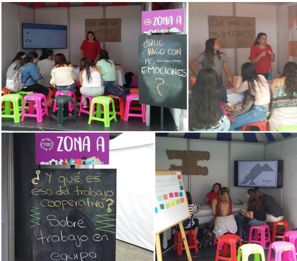
Imagen 9. Stand: Trabajo en equipo. Martínez, A. marzo 21 de 2019, 10:00 a. m.

Desde la práctica profesional se apoyó esta actividad con el stand ¿Y qué es eso del trabajo cooperativo? El día 21 de marzo, en este espacio de se abordaron estrategias para mejorar el trabajo en equipo de los estudiantes; participaron 25 estudiantes. Adicionalmente, el equipo de trabajo de la Coordinación realizó un stand sobre “¿Cómo nos comunicamos?” liderado por la practicante de Periodismo, y un stand con el tema “Inteligencia emocional” a cargo de la practicante de Psicología.