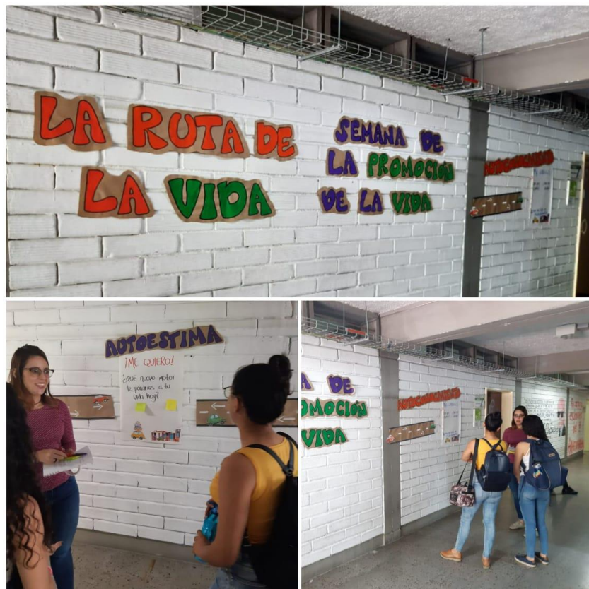
Imagen 14. Ruta de la vida. Ruiz, A., septiembre 9 de 2019, 10:00 a. m.

En conmemoración del 10 de septiembre, Día Mundial de la Prevención del Suicidio (según la OMS), el equipo de trabajo de la Coordinación de Bienestar preparó una jornada especial para la Facultad entre los días 9 y 12 de septiembre llamada Semana de la promoción de la vida , las 6 actividades fueron: Ruta de la vida (autoconocimiento, autocontrol, autoaceptación y autoestima), 1 stand sobre amor propio, 1 pausa activa sobre el trabajo en equipo, un foro abierto sobre la prevención del suicidio, visita a los salones para compartir la Ruta de Prevención del Suicidio, y una jornada de actividades con la ludoteca institucional, donde participaron 63 estudiantes.