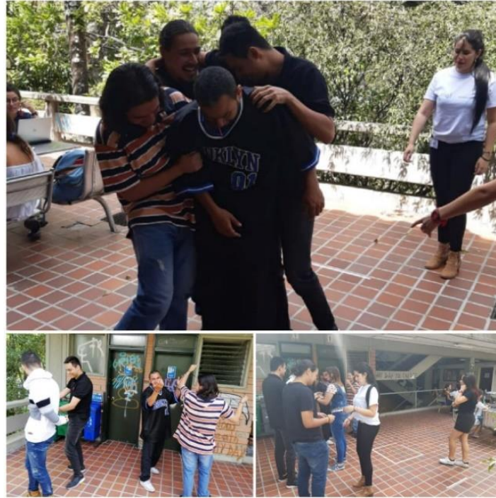
Imagen 17. Pausa activa. Ruiz, A., septiembre 10 de 2019, 9:30 a.m.