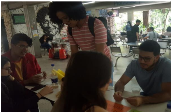
Imagen 4. Stand: la U como entorno protector. Elaboración propia, abril 12 de 2019, 9:00 a.m.