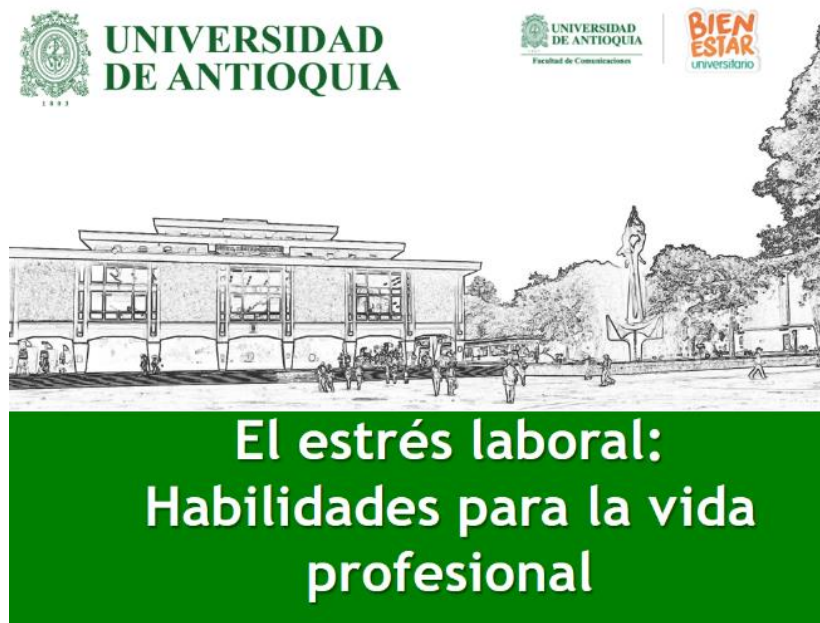
Imagen 10. Taller: estrés laboral. Ruiz, A. mayo 2 de 2019, 11:00 a. m.

Desde la práctica profesional se apoyó dictando este taller, el cual tuvo lugar el 2 de mayo de 2019 en el edificio de Extensión. Fue un espacio donde participaron aproximadamente 15 estudiantes y 4 profesores. Se logró generar algunas reflexiones en torno a la inteligencia emocional, el comportamiento en el ámbito laboral, la importancia saber comunicarse y aprender a manejar el estrés que puede generar incursionar en la vida laboral.