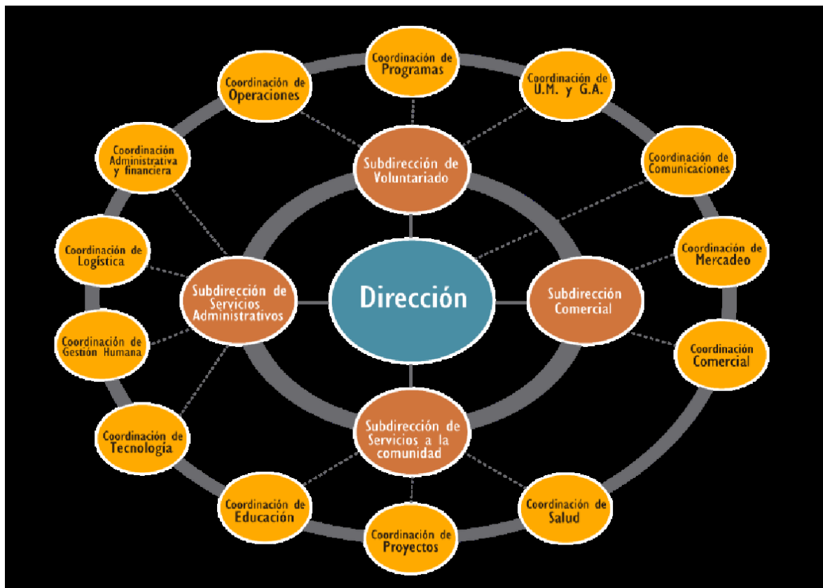
Ilustración 1: Estructura organizativa, Cruz Roja.