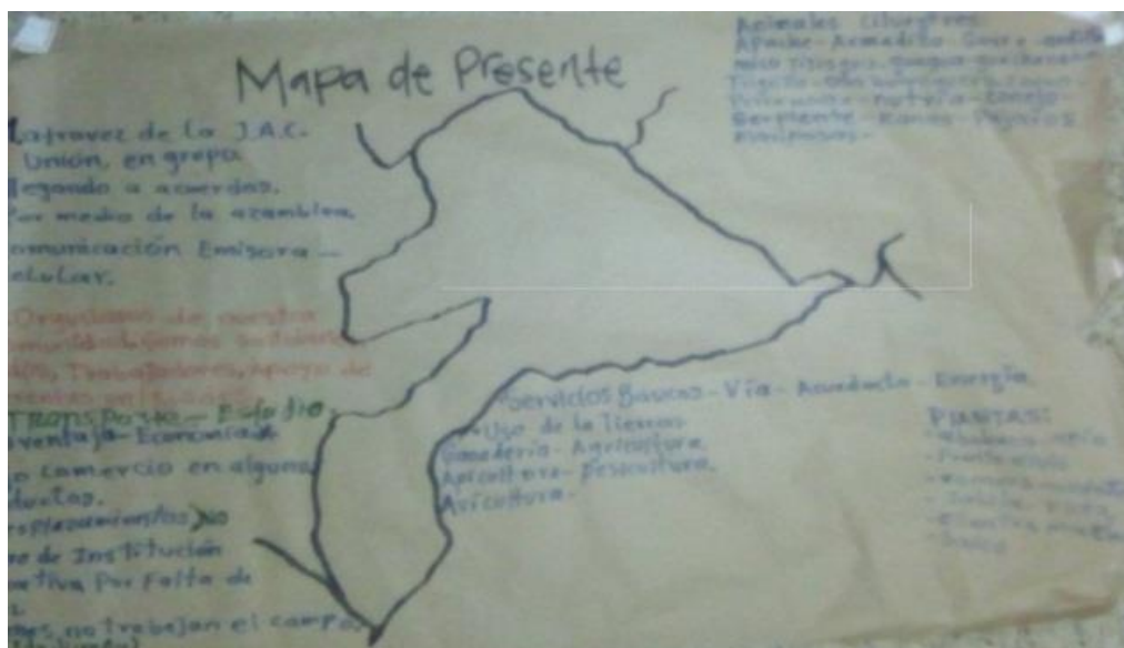
Fotografía 1: Cartografía social, Mapa del presente de la vereda.

Elaboración comunitaria. 26 de Noviembre 2017