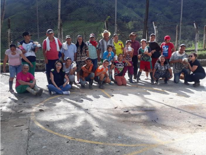
Ilustración 2. Grupo de personas mayor vereda Los Planes.

Al igual que las veredas anteriores esta vereda hace parte de la cuenca San Matías, tiene una gran extensión de bosque pluvial premontano y altas pendientes. Tiene una alta amenaza por avenidas torrenciales del río tafetanes, también tiene una gran probabilidad de ocurrencia de procesos de remoción