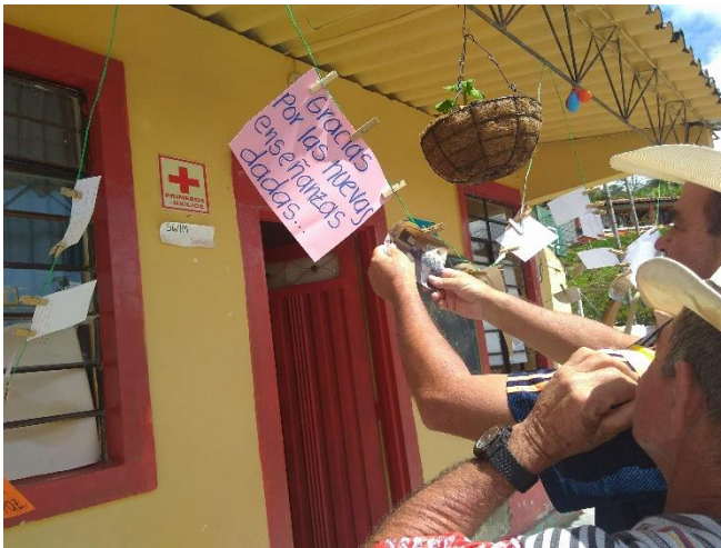
Ilustración 1. Grupo de personas mayores vereda Quebradona.

Las veredas de Quebradona Arriba y Quebradona Abajo se encuentran ubicadas en el núcleo zonal o Cuenca San Matías, es una zona de altas pendientes y bosque pluvial premontano, además de tener un alto índice amenaza de movimiento en masa. El río tafetanes tiene un carácter torrencial en su paso por Quebradona Arriba y es altamente inundable en la parte baja de Quebradona Abajo.