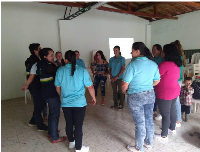
Ilustración 3. Grupo de mujeres AMUCAFA.

Específicamente en Santa Ana, según el CNMH, la población pasó de 3.000 personas a 320 en todo el corregimiento; incluso llegaron a habitar solo nueve personas. En 2009, durante el segundo gobierno de Álvaro Uribe Vélez, se lanzó el proyecto “Retornar es vivir” para acompañar y apoyar procesos de retorno en el país. Algunas situaciones que enfrentaron al retornar fueron deudas por falta de pagos de impuestos y servicios durante el desplazamiento y dificultades económicas para arreglar sus viviendas y para desarrollar proyectos productivos que les permitan permanecer en su tierra.