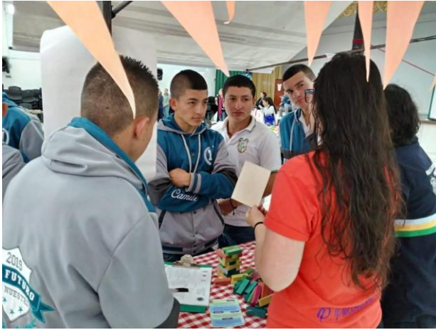
Ilustración 6. Jóvenes en el Carrusel de la Convivencia.

alarmantes teniendo en cuenta que la mayoría de las mujeres víctimas de violencia no denuncian. (CNN Español, 2019)