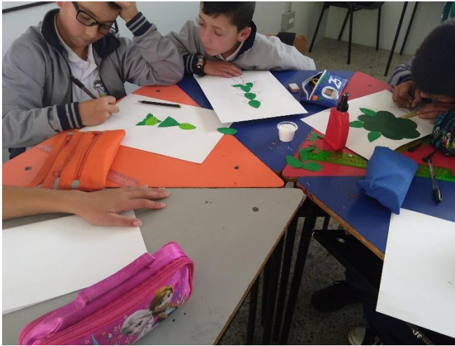
Ilustración 4. Grado sexto Bachillerato Campesino.

Asimismo, la Institución Educativa Jorge Alberto Gómez Gómez ofrece la modalidad de bachillerato los fines de semana para la población del área rural que no puede acceder a la educación en semana debido a diversos factores como las distancias en el desplazamiento, y las labores en el campo.