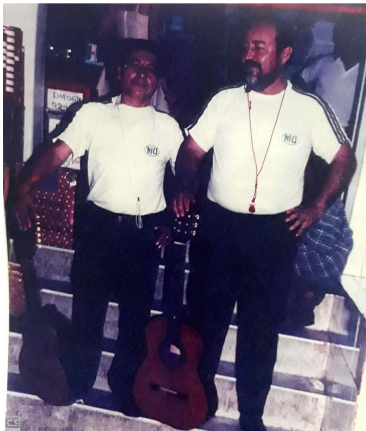
En Banana Stereo, (2006). Lente Informativo – Archivo personal de Dueto Gopar.