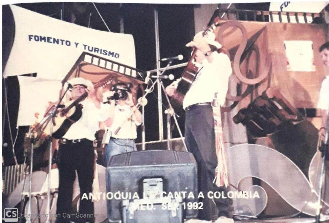
(1992). Los Recuerdos, Medellín.