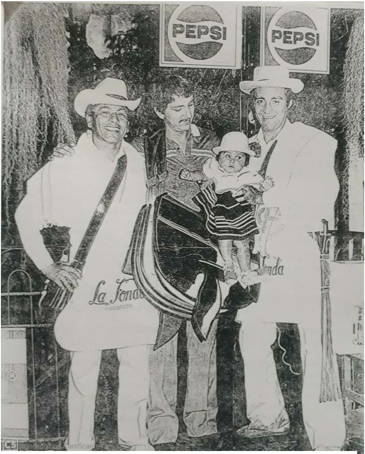
Lente Informativo – Archivo personal de Dueto Gopar.