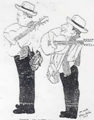
GOPAR, UN DUETO PA RECORDAR

EMBAJADOR CULTURAL MÚSICA ANDINA: He representado el municipio de Chigorodó, la región de Urabá y Antioquia a nivel Nacional en eventos de mucha trascendencia como: Antioquia le Canta a Colombia, en Santafe de Antioquia. Festival del Bambuco Luis Carlos González, en Pereira. Concurso de Duetos "Hermanos Moncada" en Armenia Quindío. Festival de Cotrafa, en Bello Antioquia, Festival Nacional de Duetos "Hermanos Martínez" Casa de la Cultura "Piedra del Sol" en Floridablanca Santander, en el año 2004, finalitas como interpretes y canción inédita. Ganadores en Pereira del premio MEJOR INTERPRETE DE LA OBRA DEL MAESTRO "LUIS CARLOS GONZALEZ" XIII- Concurso Nacional del Bambuco, Octubre de 2004.