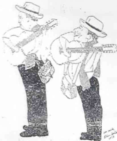
GOPAR, UN DUETO PA RECORDAR