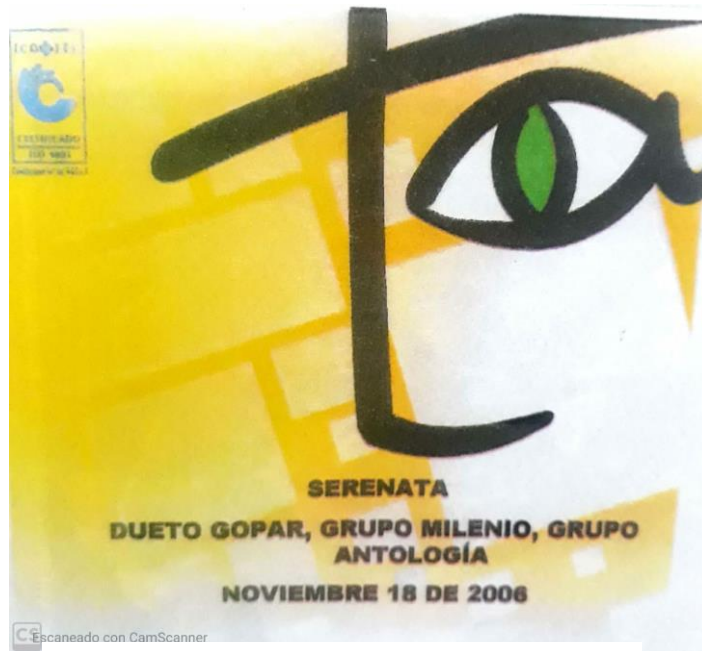
(2006) Lente Informativo