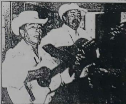
El Duetto "Gopar" dando lo mejor de sí para representar por lo alto a una bella región de Antioquia.

Finalmente, el Duetto "Gopar" añade que "queremos derrotar la imagen negativa de Urabá y que se mire a la región de otra manera: en el aspecto folclórico y social".