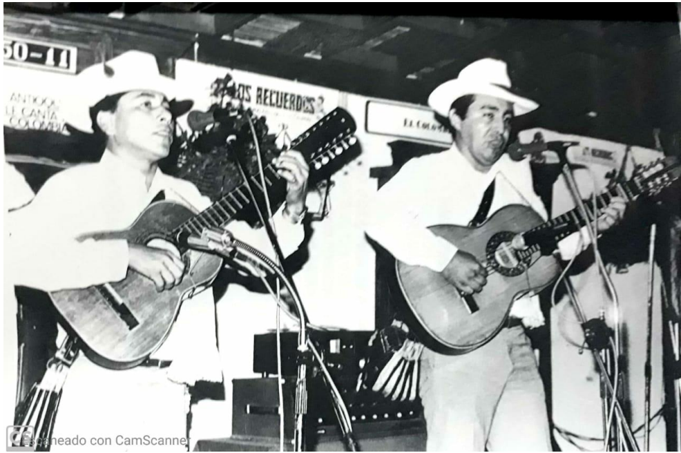
(1992) Lente Informativo