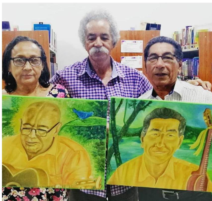
(2019) Homenaje al dueto Gopar