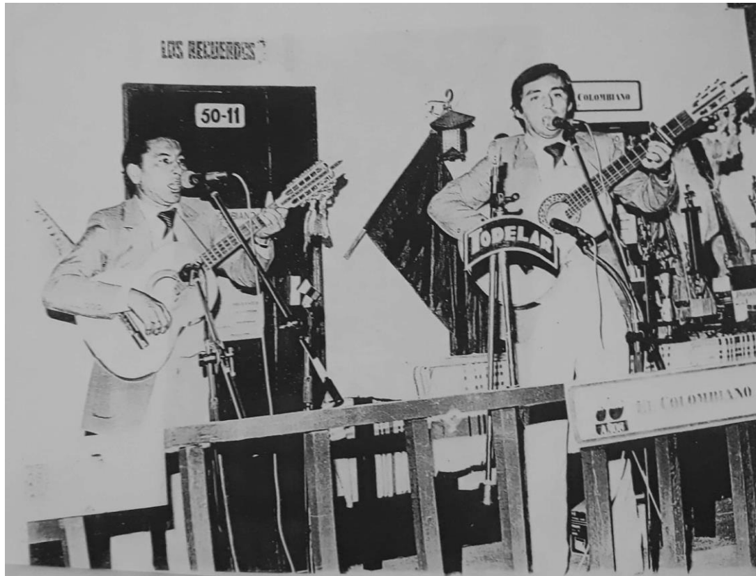
El Colombiano. (1982). Los Recuerdos, Medellín. Lente Informativo – Archivo personal de Duetto Gopar.