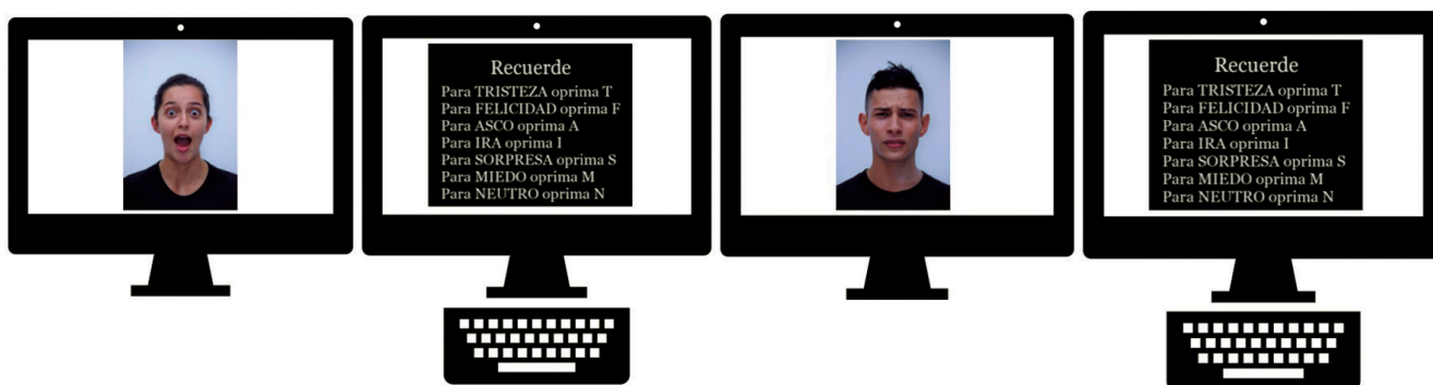
Figura 2. Esquema del procedimiento empleado

asegurarse de que cada participante había comprendido el procedimiento de la tarea, se hizo un entrenamiento previo con siete fotografías del repositorio KDEF (Lundqvist et al., 1998), correspondientes a cada una de las siete expresiones emocionales.