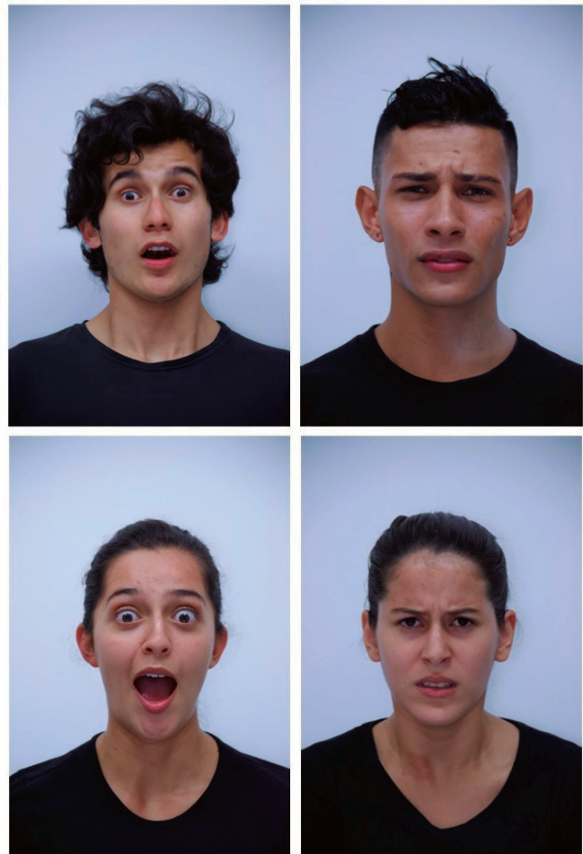
Figura 1. Ejemplos de algunas de las expresiones faciales realizadas por los modelos

Cuando el rostro desaparecía, se reemplazaba la imagen por las claves de las teclas que se debían oprimir para cada emoción. Una vez el participante presionaba una tecla, aparecía la siguiente fotografía y continuaba con este proceso hasta completar los 70 estímulos (ver figura 2). Para