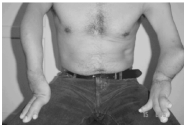
Figura N° 1 DISMELIA SUPERIOR ATRIBUIDA POR EL PACIENTE A LA TALIDOMIDA

Diez años después, la talidomida habría de ser proscrita porque se presentaron alrededor de 10.000 casos de focomelia total o parcial (dismelia), correspondientes al 1% de los hijos de las gestantes que la consumieron (fetos y neonatos sin extremidades o con ellas parcialmente desarrolladas, a veces con la apariencia de aletas –bebés delfines–), sin contar con cifras que reflejen la magnitud de las pérdidas gestacionales y otras malformaciones atribuibles a la administración de esta droga. En una entrevista reciente a un empleado del sector de la salud sobre su discapacidad (dismelia), éste la atribuyó sin certeza a la talidomida, recetada por un farmacéuta a las gestantes de su ciudad natal, donde por lo menos seis adultos con su edad aproximada (42 años) y su misma malformación, coinciden en afirmar que sus madres recibieron la misma medicación, y esto, aunque puede ser una coincidencia, ocurrió alrededor de 1960, época en la que la droga fue proscrita (1) (Figura N° 1).