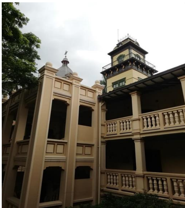
Figura 12. Antigua Escuela de Derecho. Fotografía tomada en la Antigua Escuela de Derecho de la Universidad de Antioquia. Elaboración propia.

Desde el Archivo Audiovisual de la Universidad de Antioquia, se conservan haberes patrimoniales como “cátedras, eventos, producciones, conciertos, documentales unitarios, promos, series de televisión, videos institucionales, notas periodísticas de UdeA Noticias Televisión y Archivo Noticiero U.N.A, este último donado a la Biblioteca Carlos Gaviria Díaz” (Red de Patrimonio y Memorias, 2018), que dan cuenta de un acervo identitario que se ha venido configurando desde hace más de tres décadas, dentro del campus universitario; así, dado la antigüedad de los registros, estos se conservan en distintos formatos que posibilitan además de su visualización, la posibilidad de reconocer las diferentes tecnologías que se han venido usando a través de los años para conservar y proteger los elementos patrimoniales configuradores de la realidad universitaria, a partir de producciones televisivas y radiales.