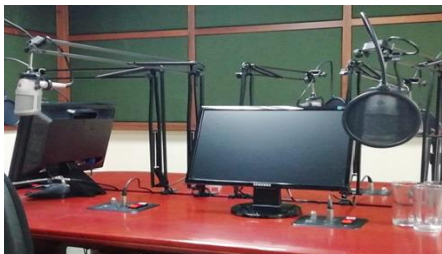
Figura 5. Equipos de la fonoteca. Fotografía tomada al interior de la fonoteca. Elaboración propia.

La emisora cultural de la Universidad de Antioquia, posee una Fonoteca encargada de los procesos y las actividades de documentación, preservación, conservación y difusión de las colecciones sonoras. Se encuentra adscrita principalmente a los ejes misionales de investigación y extensión, y cuya finalidad es generar nuevos procesos de enseñanza partiendo de los archivos sonoros existentes.