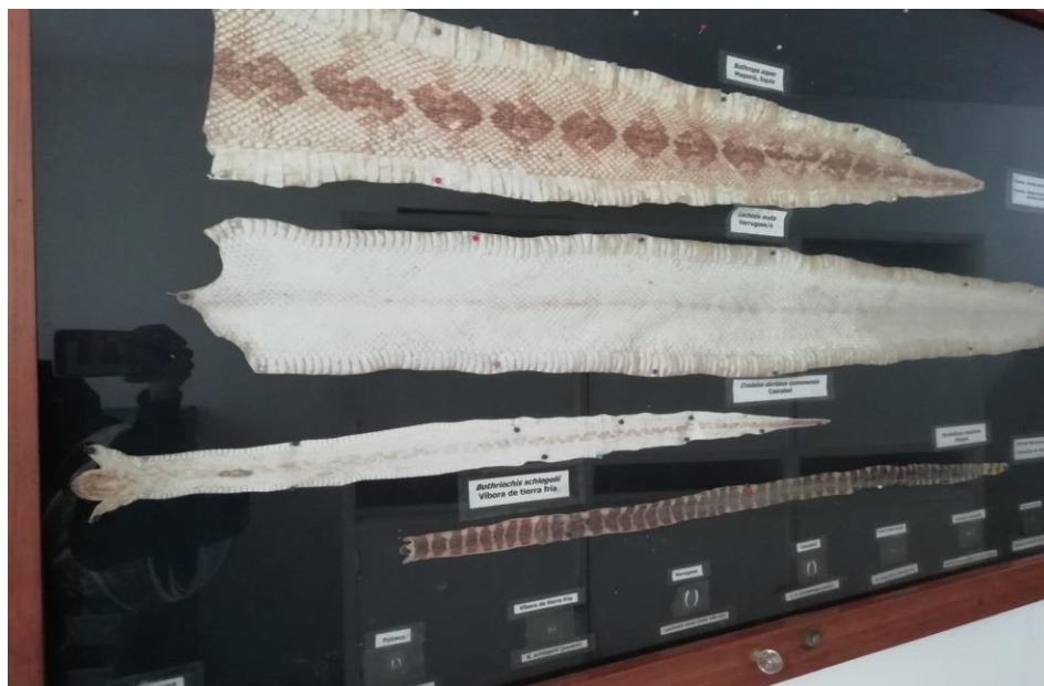
Figura 3. Piel de serpiente. Fotografía tomada en el serpentario. Elaboración propia