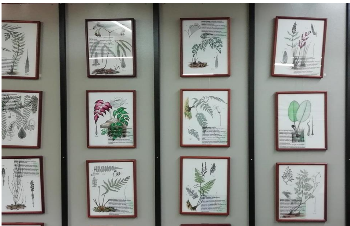
Figura 11. Instituto de Biología. Fotografía tomada al interior del instituto. Elaboración propia.

El instituto de Biología, fundado en 1962, corresponde a varias colecciones patrimoniales subdivididas en espacios diferentes según su campo de estudio, así entonces se encuentra constituido por: Colecciones Zoológicas, Colección limnológica, Colección Estuarina y Marina, Colección Entomológica, Colección Ictiológica, Museo de Herpetología y Colección Teriológica. Este instituto se ha venido constituyendo desde la experiencia de investigadores internos y externos a la Universidad, así como estudiantes en proceso de formación con intereses taxonómicos y ecológicos (Red de Patrimonio y Memorias, 2018). Cada uno de estos espacios está destinado a construir ejercicios de Investigación y Docencia, y se ha ido configurando desde las investigaciones y el quehacer académico de los miembros de sus laboratorios.