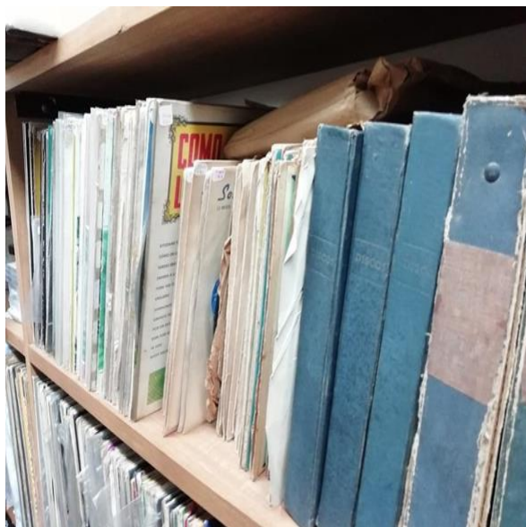
Figura 10. Archivo Histórica. Fotografía tomada en el Archivo histórico de la Universidad de Antioquia. Elaboración propia.

pertenencia a la universidad en tanto permite evidenciar cómo se construyó el contexto histórico y en esa medida permite que la comunidad se proyecte hacia el futuro; así mismo se plantea que sirve para la investigación en torno a los principios básicos de la archivística; y finalmente, se piensa con unas finalidades relacionadas con la seguridad y protección de los archivos.