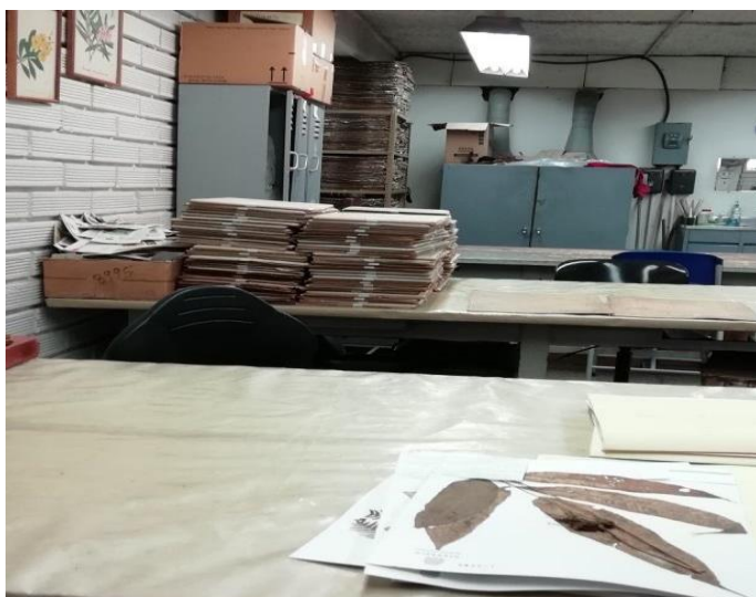
Figura 4. Herbario de la Universidad de Antioquia. Fotografía tomada al interior del herbario. Elaboración propia.

Esta dependencia de la Red de Patrimonio y Memorias es un espacio dirigido al estudio y nombramiento de la gran diversidad de plantas que existen en el territorio colombiano. Su accionar está dirigido a cumplir el eje misional institucional sobre la Investigación, donde desarrolla acciones con fines investigativos y académicos.