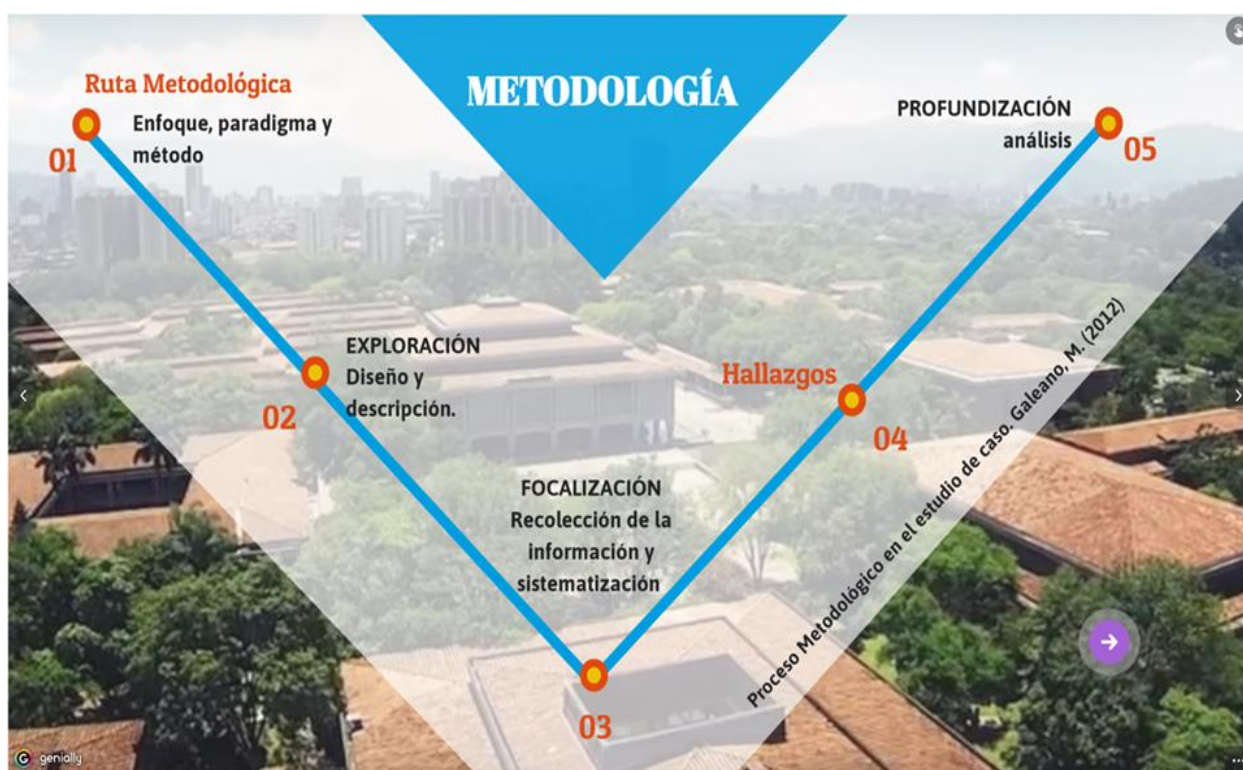
Figura 1. Diseño de la metodología. Ruta metodológica. Elaboración propia.

Esta investigación estuvo transversalizada por tres momentos que configuraron el desarrollo de los objetivos y sus respectivos resultados. En un primer momento, se caracterizaron los procesos de difusión de los patrimonios de la Universidad de Antioquia a partir de doce entrevistas 1 realizadas a representantes de cada una de las dependencias de la Red de Patrimonio y Memoria. Con estas entrevistas se buscó identificar cuáles eran las principales concepciones sobre difusión del patrimonio, además de las finalidades y las estrategias que desde las dependencias son usadas para posibilitar la difusión de los mismos dentro de las dependencias que conforman la red de Patrimonio y Memorias. Las once entrevistas fueron hechas en: El departamento de Artes (centro de documentación y Archivo de músicas regionales), Museo, Herbario, Fonoteca, Sistema de Bibliotecas, Archivo histórico, Serpentario, Programa Guía Cultural, Corporación Académica Ambiental y Bienestar Universitario.