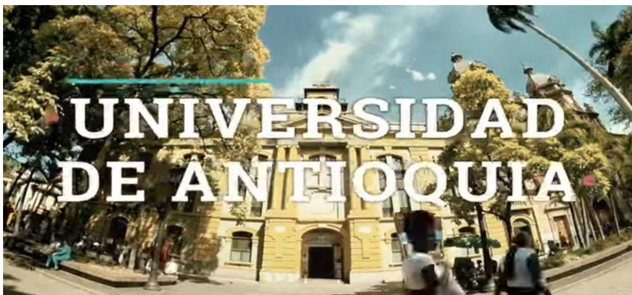
Figura 7. Paraninfo de la Universidad de Antioquia. Imagen tomada del vídeo “Así somos: Universidad de Antioquia”. Elaboración propia.

Esta dependencia posee un conjunto de actividades, espacios, cursos y talleres que fomentan el arte y la cultura universitaria con el fin de promover espacios complementarios a la formación académica y laboral de los actores presentes en los quehaceres de la Universidad de Antioquia. Bienestar Universitario se plantea la Extensión como el eje misional a cumplir dentro de la universidad, propiciando espacios para la formación integral de los estudiantes, docentes y trabajadores de la Universidad.