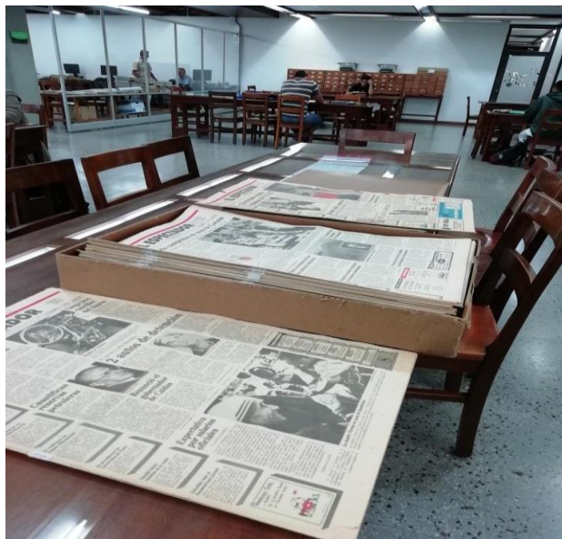
Figura 8. Periódicos en la Biblioteca Carlos Gaviria. Fotografía tomada en el archivo histórico del Cuarto piso. Elaboración propia.

Dependencia que desarrolla sus actividades principalmente desde el eje misional de la docencia, en tanto apoya los procesos de académicos de estudiantes. Su acervo patrimonial está constituido por la colección patrimonial, colección de prensa, colección Antioquia y archivos personales ubicadas en la Biblioteca Carlos Gaviria Díaz; la colección de historia de la medicina de la misma facultad, y la colección de veterinaria y zootecnia.