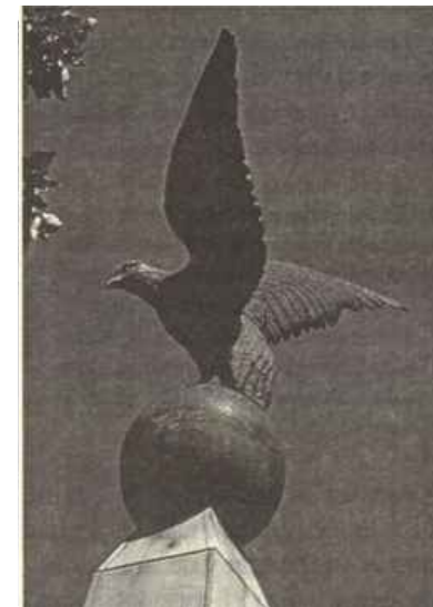
Monumento Conmemorativo al Centenario de la Universidad de Antioquia 1822-1922. Bronce, mármol y grano pulido. Parainfo. Plazuela de San Ignacio

Es por ello, para ir recapitulando, que aquellos libros y autores traducidos dependían como ya hemos dicho del gusto personal del traductor y por otra parte del idioma que manejaran los diferentes escritores, que para nuestro caso dependía de las naciones que en este entonces representaban lo dominante y el paradigma de nación. Francia, Inglaterra y Estados Unidos se convierten para bien o para mal en las referencias obligadas de la época. Si se quería estar al nivel de comunicación con ellos era obligatorio aprender sus idiomas. Ya el inglés en la época de Silva era materia obligada de estudio. Vemos como en muchos casos el aprendizaje de los idiomas