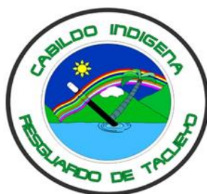
Figura 4. Resguardo de Tacueyó. (1991). [Logo].

Con respecto a lo económico, el cabildo Indígena de Tacueyó es reconocido por su programa de economía propia , con el cual se ha implementado un fondo rotatorio, que nos ha permitido ser autónomos en las decisiones relacionadas con emprendimiento productivo, las cuales se desarrollan dentro del territorio, por medio de las asociaciones de productores establecidas y organizadas a través del tiempo, representadas y avaladas bajo el techo jurídico de la Asociación de Cabildos, Proyecto Nasa.