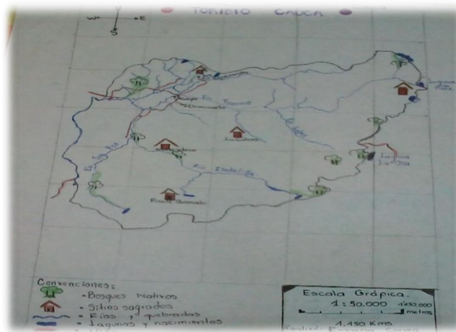
Figura 2. Correa, Rosana. (2016). Mapa Cosmogónico de Tacueyó- Cauca. [Mapa]. Realizado en conversatorios comunitarios.

La Organización político-administrativa del territorio es una organización propia, conformada por una asociación, de tres cabildos llamada “Proyecto Nasa”, la cual vela por el bienestar y unidad del territorio y sus habitantes. Esta organización es la encargada de gestionar recursos para los diferentes programas sociales que existen, entre ellos está el Movimiento Juvenil , Movimiento de la Mujer , Programa Ambiental , Programa de Economía Propia , Programa de Familia , de donde se toman decisiones en conjunto que favorezcan a los tres cabildos y resguardos del Municipio.