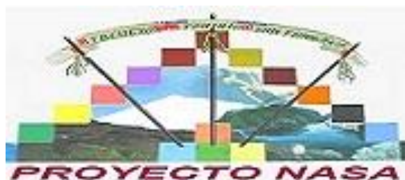
Figura 3. Proyecto Nasa. Asociación de Cabildos de Toribio-Cauca. (1989). [Logo].

Ambiental, Cabildo de Familia, Cabildo Jurídico, y la Guardia Indígena , este último en cabeza de un coordinador quien convoca a reuniones cada 8 días, quienes están atentos a cualquier anomalía que suceda dentro del Territorio y en otros territorios vecinos, para ir a apoyar y cultivar la armonía y el equilibrio del territorio.