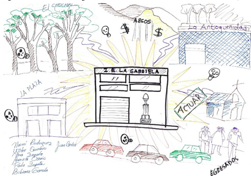
Figura 3. Taller de cartografía social. Institución Educativa La Gabriela, Bello