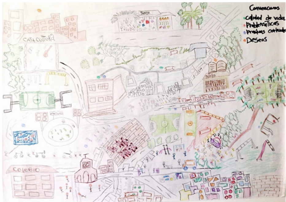
Figura 4. Taller de cartografía social con estudiantes. Institución Educativa María de los Ángeles Cano, Medellín