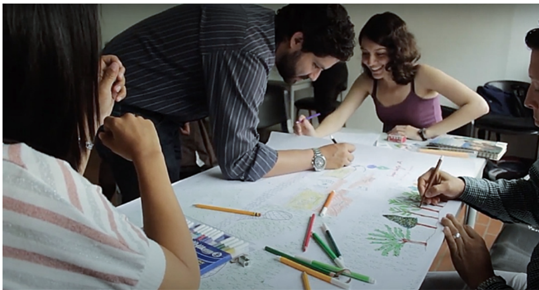
Figura 1. Taller de cartografía social con maestros y maestras. Institución Educativa Joaquín Vallejo Arbeláez, Medellín