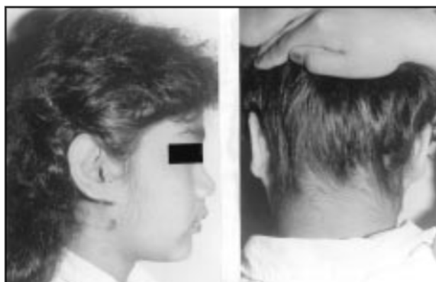
Paciente No.2. Edad 19 años. Se observa: hirsutismo facial y la línea de implantación del cabello es baja