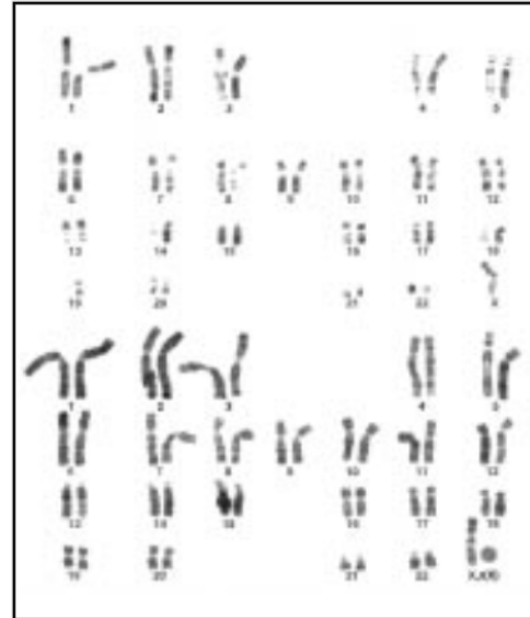
Paciente No. 4

Cultivo: Linfocitos de sangre periférica