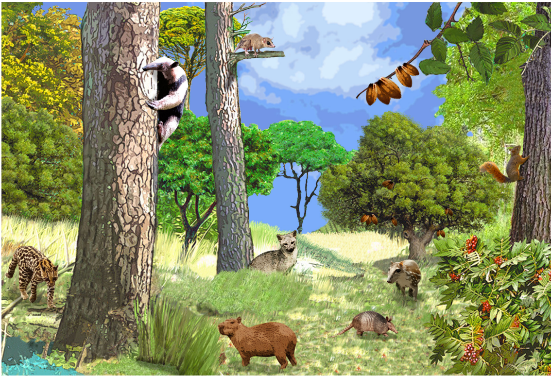
Figura 3. Representación del entorno estudiado en la Granja Yariguíes, mostrando algunas de las especies registradas. De izquierda a derecha: Ocelote ( Leopardus pardalis ; carnívoro terrestre nocturno), Tamandúa ( Tamandua tetradactyla ; insectívoro arbóreo nocturno), Marmosa ( Marmosa robinsoni ; omnívoro arbóreo nocturno), Chigüiro ( Hydrochoerus hydrochaeris ; herbívoro acuático nocturno), Zorro perro ( Cerdocyon thous ; omnívoro terrestre nocturno), Armadillo ( Dasyus novemcinctus ; insectívoro terrestre nocturno), Guagua ( Cuniculus paca ; frugívoro terrestre nocturno), Ardilla de cola roja ( Notosciurus granatensis ; frugívoro arbóreo diurno).

cional sobre insectos que afectan las plantas; mientras que, los armadillos al ser semifosoriales airean y remueven el suelo al hacer excavaciones continuas en busca de alimento o elaboración de madrigueras, lo que permite la aireación y remoción del suelo evitando la compactación (Abba et al, 2015; Bilenca et al, 2017; Rumiz, 2010). De otro lado, animales como tigrillos (carnívoros), zorros, mapaches y tayras (omnívoros), pueden estar influenciando las poblaciones de pequeños mamíferos que pueden ejercer daños en los cultivos (Nagy-Reis et al, 2019) o que pueden afectar el ecosistema si sus poblaciones aumentan considerablemente, por ejemplo, consumiendo semillas y plántulas que podrían perjudicar la dispersión y por ende, la composición del bosque (Rojas-Robles, Stiles, y Muñoz-Saba, 2012). Igualmente, herbívoros como el chigüiro y la guagua se alimentan sobre la