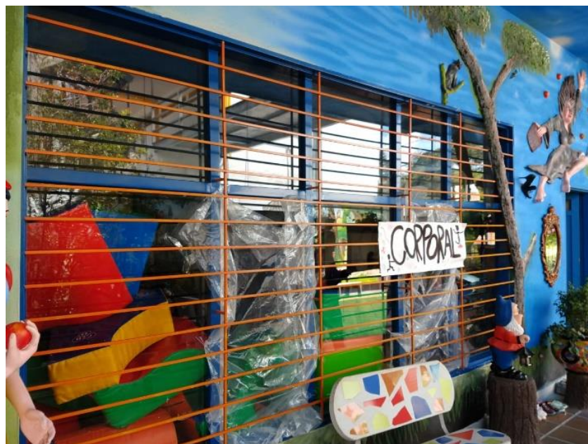
Figura 4. Aula corporal Centro de Desarrollo Infantil Caritas Alegres