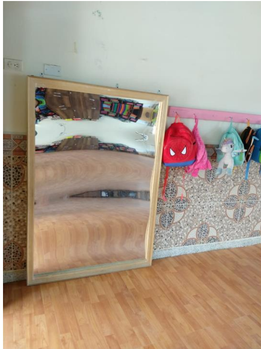
Figura 15. Espejo del salón de motricidad fina del Centro de Desarrollo Infantil Caritas Alegres