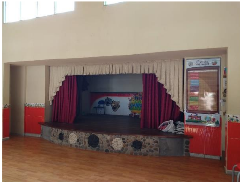
Figura 25. Salón de teatro del Centro de Desarrollo Infantil Caritas Alegres