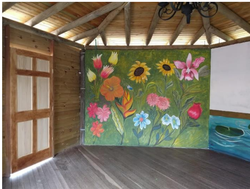
Figura 10. Mural del salón ambiental del Centro de Desarrollo Infantil Caritas Alegres