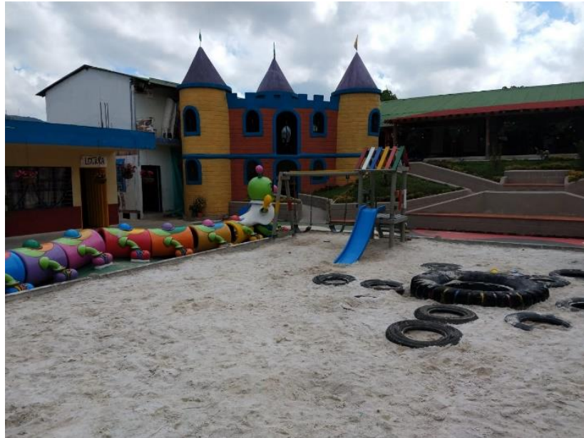
Figura 9. Área de juegos del Centro de Desarrollo Infantil Caritas Alegres