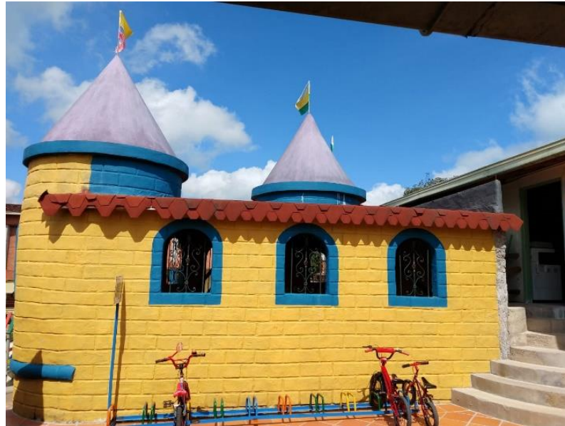
Figura 21. Castillo del liderazgo en el Centro de Desarrollo Infantil Caritas Alegres - 2