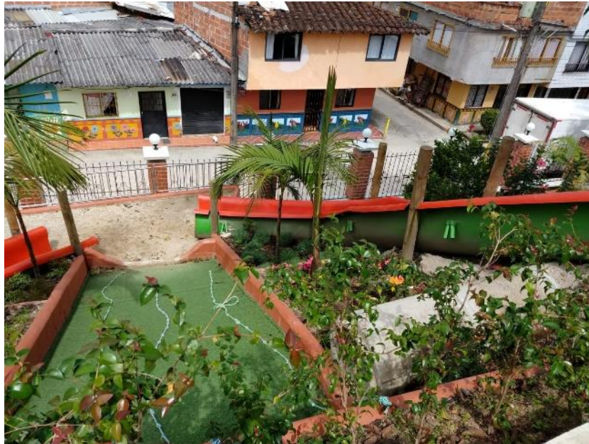
Figura 11. Toboganes del Centro de Desarrollo Infantil Caritas Alegres