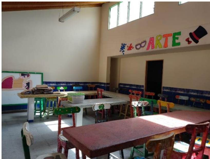
Figura 24. Salón de arte del Centro de Desarrollo Infantil Caritas Alegres