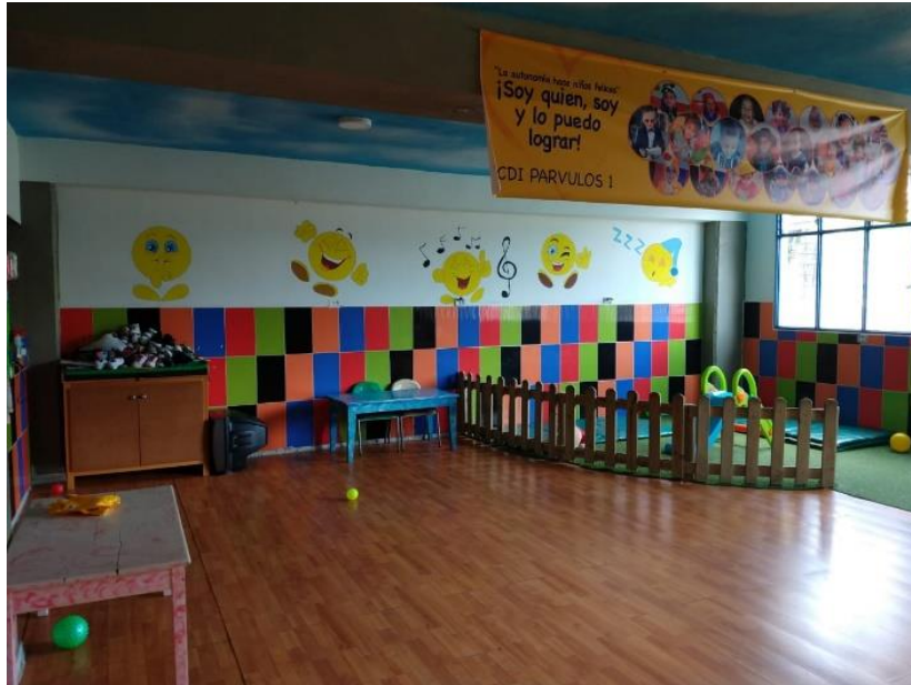
Figura 7. Aula párvulos del Centro de Desarrollo Infantil Caritas Alegres