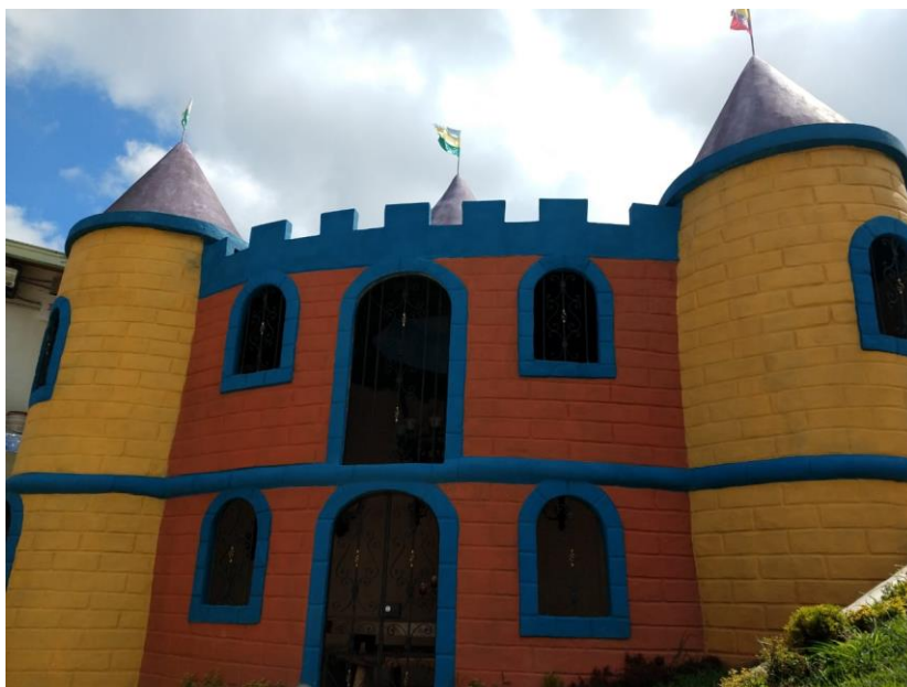
Figura 18. Castillo del liderazgo en el Centro de Desarrollo Infantil Caritas Alegres