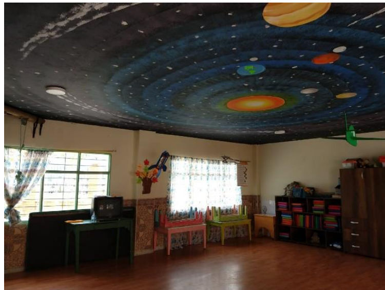
Figura 16. Salón de la ciencia del Centro de Desarrollo Infantil Caritas Alegres