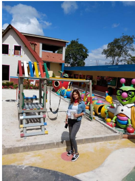
Figura 20. Área de juegos del Centro de Desarrollo Infantil Caritas Alegres – 2