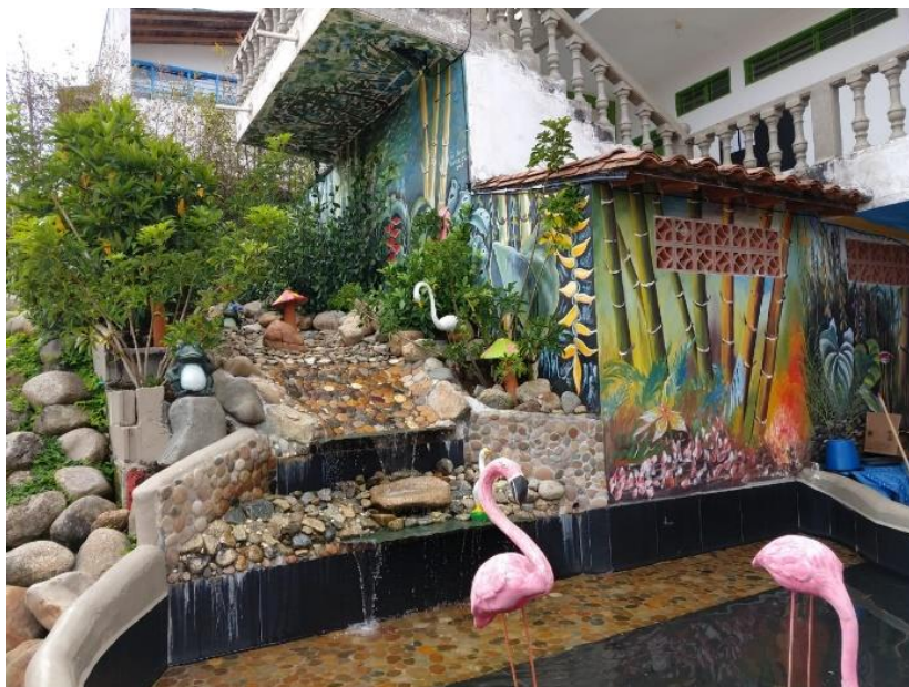
Figura 5. Fuente del Centro de Desarrollo Infantil Caritas Alegres