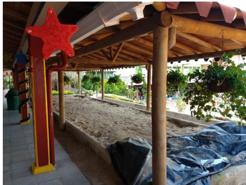
Figura 22. Areneros del Centro de Desarrollo Infantil Caritas Alegres