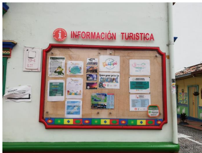
Figura 28. Muro de información turística - Guatapé, Antioquia