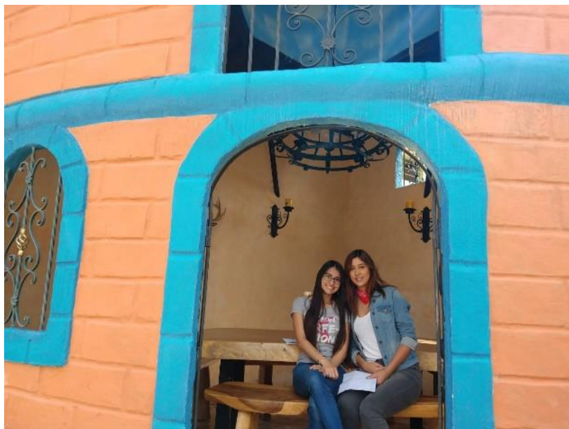
Figura 17. Interior del castillo del liderazgo en el Centro de Desarrollo Infantil Caritas Alegres