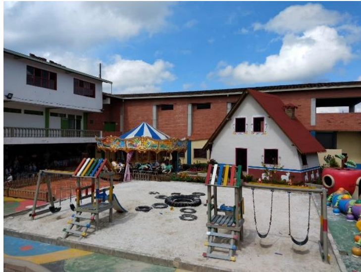
Figura 19. Área de juegos del Centro de Desarrollo Infantil Caritas Alegres