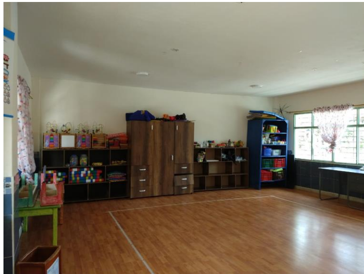
Figura 14. Salón de lógica del Centro de Desarrollo Infantil Caritas Alegres