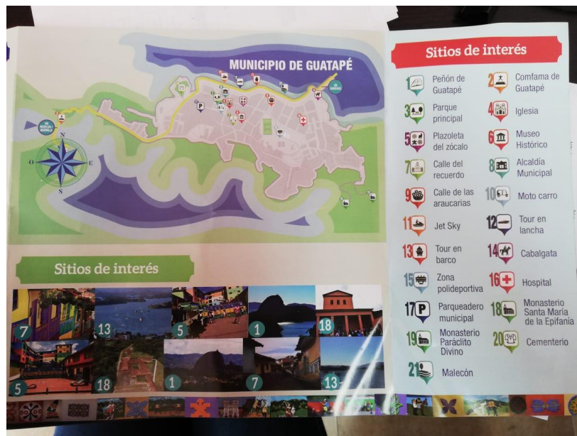
Figura 26. Letrero de la Secretaría de Turismo del mapa del municipio con sitios de interés - Guatapé, Antioquia