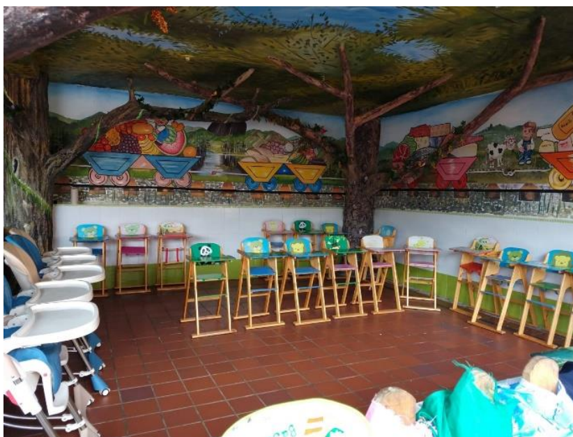
Figura 6. Comedor párvulos del Centro de Desarrollo Infantil Caritas Alegres