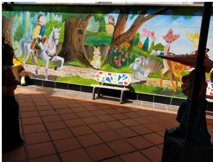
Figura 1. Mural de entrada Centro de Desarrollo Infantil Caritas Alegres - Guatapé, Antioquia

Se anexa registro fotográfico del trabajo de campo.