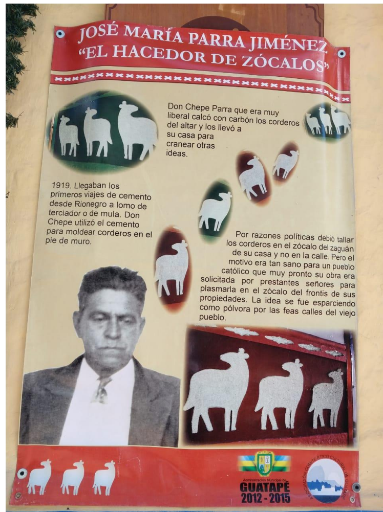
Figura 29. Cartel sobre la historia del zócalo - Guatapé, Antioquia