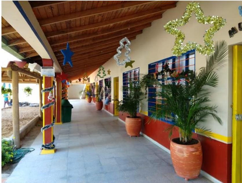
Figura 3. Corredor de entrada del Centro de Desarrollo Infantil Caritas Alegres