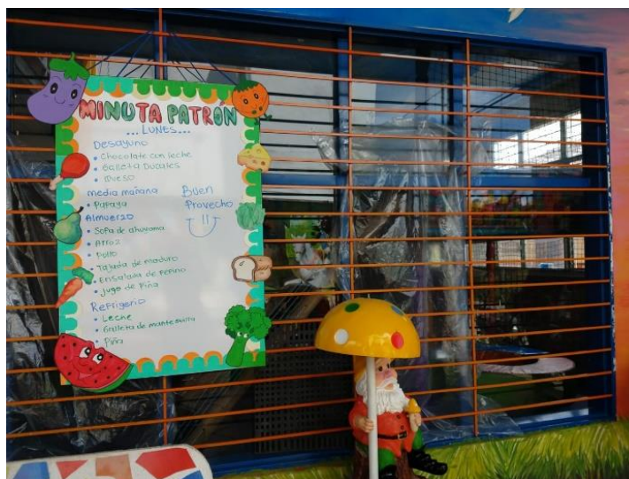
Figura 2. Anuncios con alimentación de los niños del CDI Centro de Desarrollo Infantil Caritas Alegres