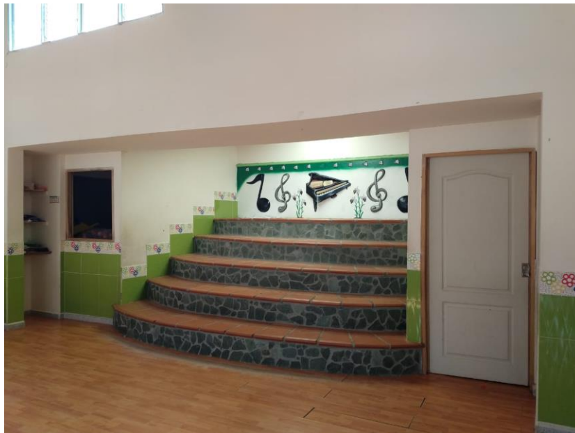
Figura 23. Salón de música del Centro de Desarrollo Infantil Caritas Alegres