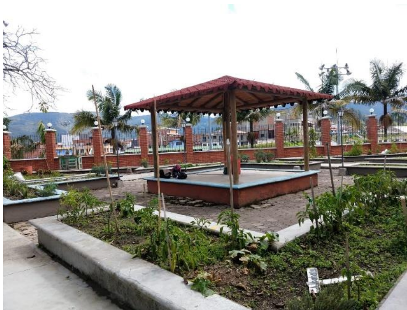
Figura 12. Área de siembra del Centro de Desarrollo Infantil Caritas Alegres