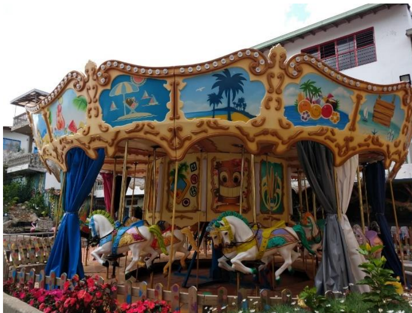
Figura 8. Carrusel Centro de Desarrollo Infantil Caritas Alegres