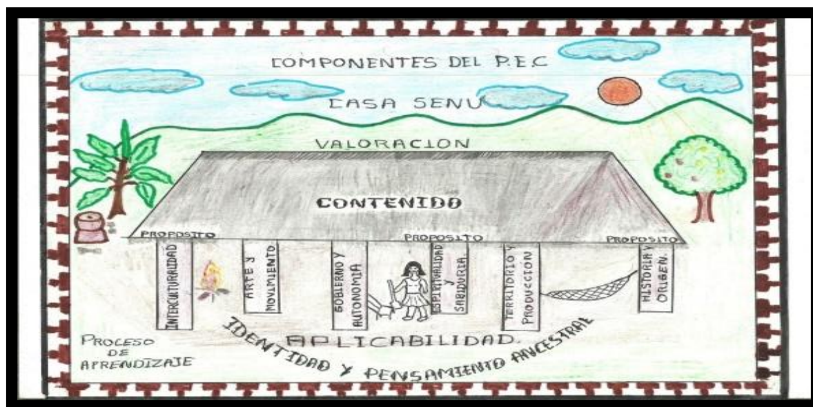
Figura 1. Esquema de los componentes del PEC.

Fuente: elaborado por docentes de la Institución educativa rural indígena José Elías Suarez. (2009)