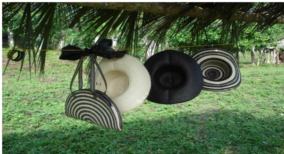
Foto 2. Sombrero tejidos por artesanos del resguardo El Volao

ocasional autonomía respecto de las funciones prácticas como en el arte culto. (p.226), este reconocimiento ha dado entrada a ciertos artesanos y artistas populares en museos y galerías.