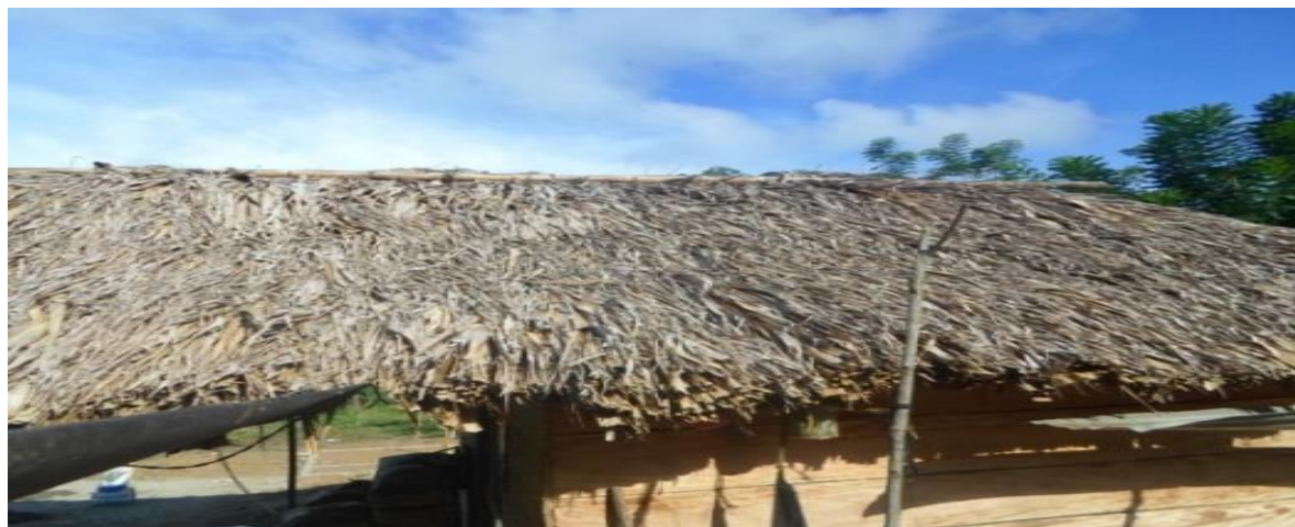
Foto 7. Trenzado Senú de una vivienda.