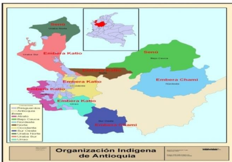
Figura 2. Mapa ubicación pueblos indígenas de Antioquia.