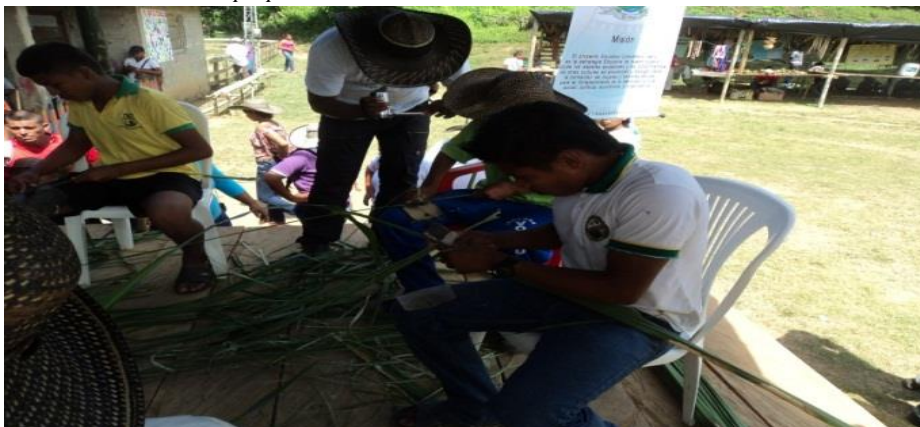
. Foto 11. Jóvenes tejiendo