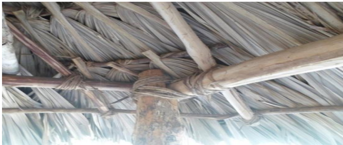
Foto 8. Trenzado Senú.