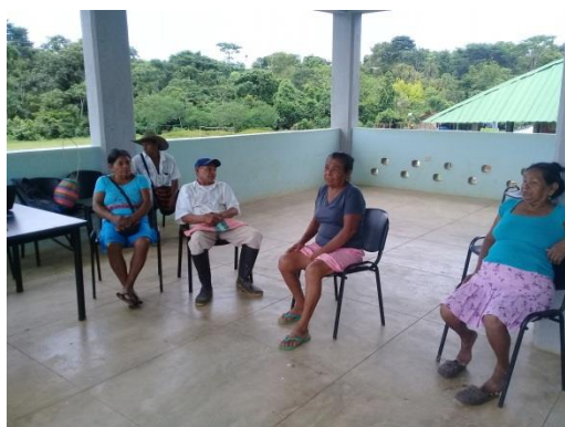
Foto 13. Sabio y trezadores en la reconstrucción de temas a trabajar en la institución educativa