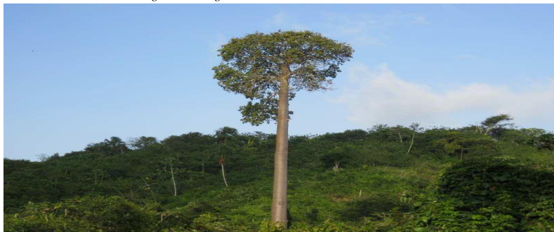
Foto 3. Árbol El Volao. Resguardo Indígena

A continuación se muestra un árbol representativo del lugar.