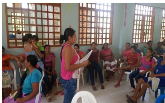
Foto 12. Padres de familias asistentes.