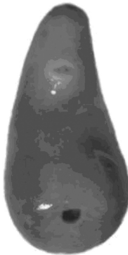
Figura 1. Adulto de Cotylophoron panamensis . Escala 1 mm. Fotografía en fresco tomada en el Laboratorio de Malacología Médica y Tremátodos-PECET.

Cuerpo cónico, ventralmente curvo. Los digéneos vivos presentan color rojizo (Fig. 1).