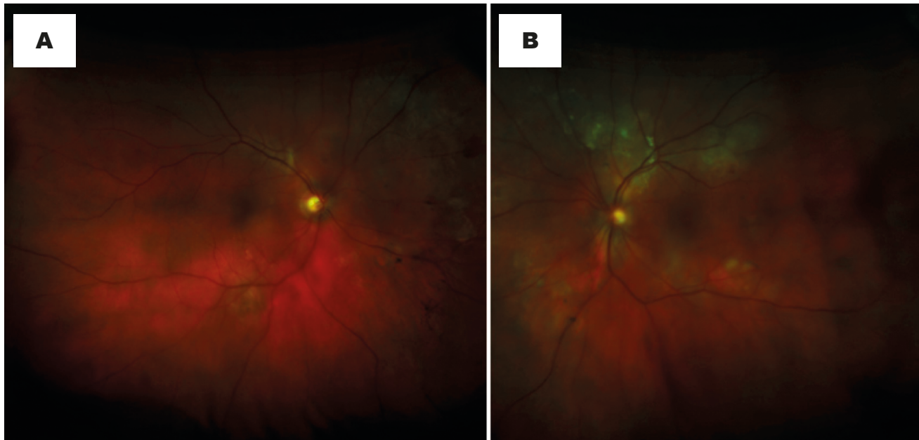
Figura 1. Fotografías de fondo de ojo a color. A. OD: mácula con cambios pigmentarios foveales escasos. Lesión hipopigmentada cicatrizada en arcada temporal inferior con pigmento. Cambios pigmentarios marcados nasales al disco. B. OI: mácula con pérdida del brillo foveal y engrosamiento, lesiones retinocoroideas blanquecinas en las arcadas temporales, especialmente, superiores, algunas confluentes y otras nasales y temporales al disco.

presentó en su OD lesiones cicatrizadas del epitelio pigmentario de la retina en la mácula y en región nasal al nervio óptico. En su OI se observó la pérdida del brillo foveal por un posible edema macular, lesiones coroideas blanquecinas de 0,7 DD en las arcadas temporales de predominio superior, algunas de ellas confluentes (Figura 1).