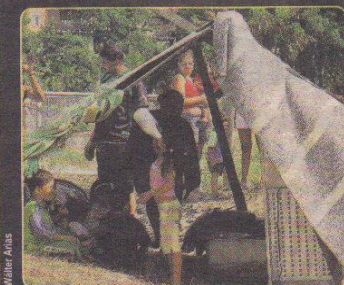
Varias personas montaron ranchos improvisados en la avenida Regional para protegerse del sol.