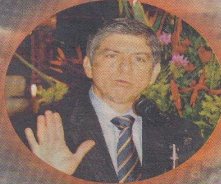
César Gaviria Ex presidente de Colombia y actual director del Partido Liberal colombiano.

"Cada vez que le señalan tal o cual aspecto de su Gobierno, pretende defenderse hablando de sus antecesores... lanzando acusaciones temerarias e irresponsables, pero no precisa... Estoy dispuesto a asumir mi responsabilidad".