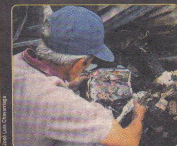
Un hombre que ayer escarbaba dentro de los escombros revisa una revista.