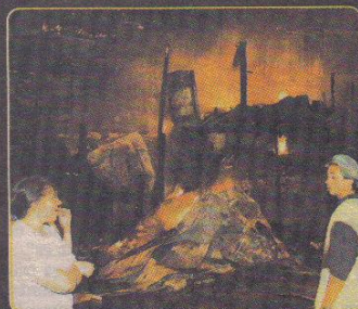
Habitantes del sector Oasis observan cómo las llamas consumen las viviendas.

2 personas debieron ser llevadas al San Vicente de Paúl. Una sigue en el hospital