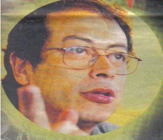
Gustavo Petro Candidato por el Polo Democrático, ex militante del M-19 y denunciante del paramilitarismo.