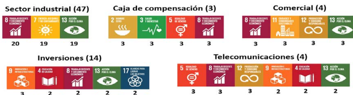
Ilustración 2. Priorización de ODS por industria

menos priorizado es el que trata sobre la vida submarina (ODS 14 –7.7%–), esta situación se presenta debido a que las empresas consideradas en el estudio tienen poca o nula intervención en los océanos de manera directa y por ende no existe una necesidad inicial para priorizar este ODS. Debido a que el sector incide directamente en la priorización de los ODS por parte de las organizaciones, la ilustración 2 muestra la priorización de ODS en las industrias estudiadas.