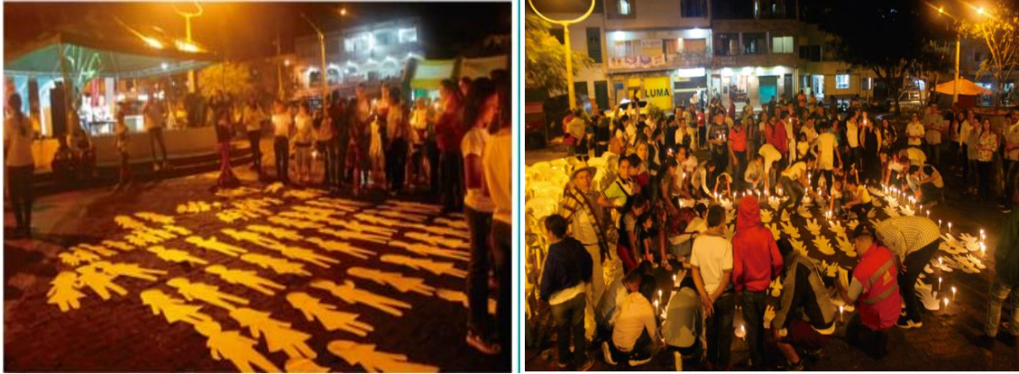
Nota. Alcaldía 2016-2019 “Comprometidos por Frontino”.

Inicia con sus sesiones ordinarias el día 04 del mes de mayo, con una capacitación para recordar las funciones de la MPEV en relación a sus funciones de: Planeación, incidencia política, organización, participación y control social y al igual que hablar sobre el hecho de desaparición forzada en el municipio, relación a citas y caracterización del mismo.