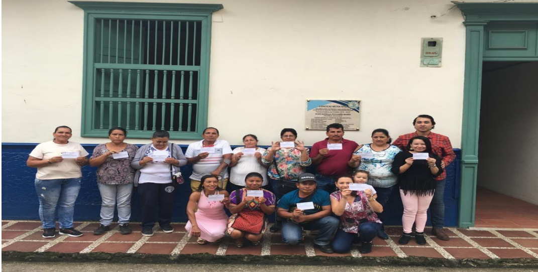
Nota. Mesa Departamental de Víctimas de Antioquia.

Para dar cumplimiento al Protocolo de Participación Efectiva de Víctimas de que la MPEV debe cumplir con 4 sesiones ordinarias al año, el 30 de Julio 2019 es citada nuevamente la MPEV a su tercera sesión ordinaria, donde la Secretaría Técnica de la MPEV la capacito en la Ley 850 de 2003 sobre veedurías ciudadanas; a dicha capacitación también asistieron profesionales de la Administración Municipal y la Empresa Constructora P y P.