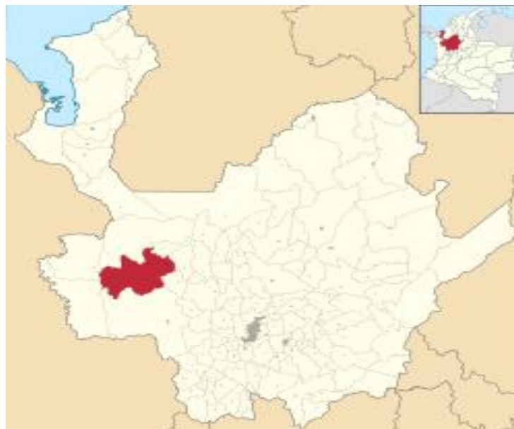
Mapa de Frontino

Nota. https://es.wikipedia.org/wiki/Frontino_(Antioquia) .