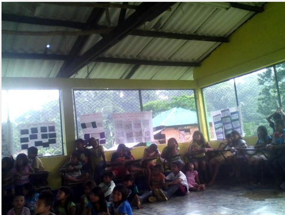
Estudiantes del centro educativo rural indigenista bagara