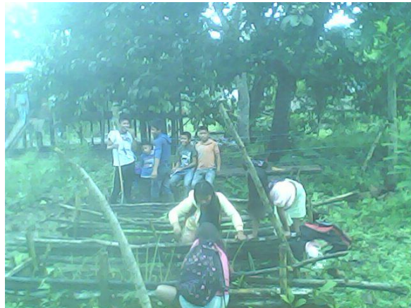
Estudiantes Bagara encerrando el lote