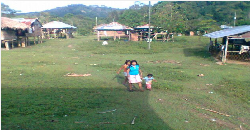
Foto comunidad Ibudó – Las Playas.

Los embera eyabida de IBUDÓ LAS PLAYAS creen en el aribada, que es un jai, es una persona que se ha muerto y ha revivido con el apoyo de un jaibaná. La palabra muerte en êberâ no existía porque lo que existe nunca muere sino que cambia estilo de vida.