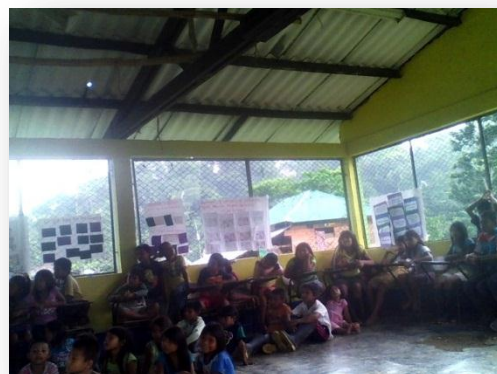
Dialogo con carmelina sabia de la comunidad indígena IBUDO reunión comunitaria con las mujeres