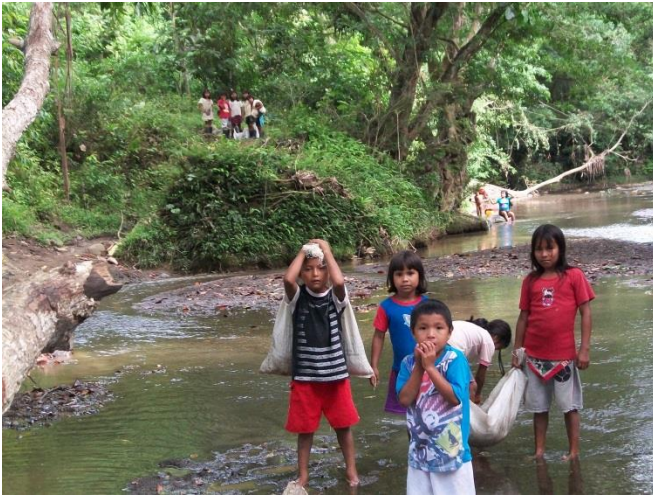
Estudiantes cargando abono de hojarasca para la parcela escolar

Se aplicó el método de conversación, participación, investigación, acción en donde todos somos investigadores y en conjunto aportamos soluciones inmediatas lo que permitió el logro de los resultados esperados. Así pues para realizar las prácticas en las conversaciones se hizo la socialización de historias sobre la agricultura por los adultos