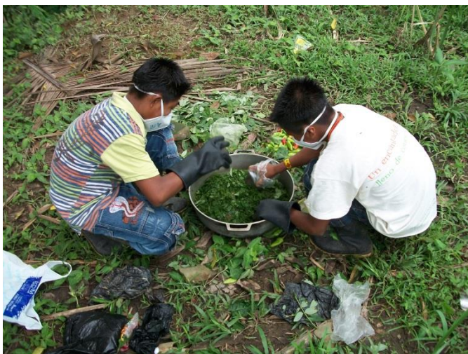
Estudiantes preparando plaguicida natural a base de plantas

Se hizo partiendo de la realidad teniendo en cuenta los aportes de la comunidad educativa a través de sus experiencias y saberes previos; en acción conjunta construimos nuevos conocimientos que nos llevaron a la transformación, a la realidad constituyendo teorías y prácticas.