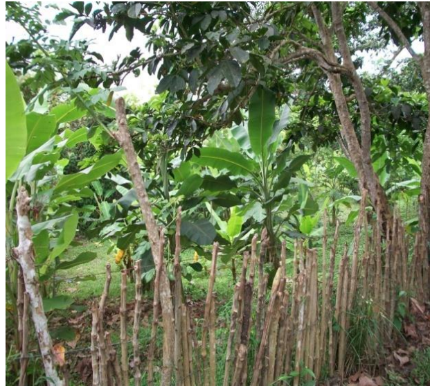
Ilustración 1Fecha: 27-junio-2010. Descripción: esta es la platanera de la escuela bidua dó.

Al implementar teorías y prácticas a través de la parcela comunitaria escolar que ya tiene un proceso adelantado con siembra de plátano y algunos árboles frutales desde el año 2009, permite la disponibilidad de alimentos ricos en nutrientes que beneficien la salud y la nutrición de la comunidad educativa. Además va a fomentar el valor por el trabajo