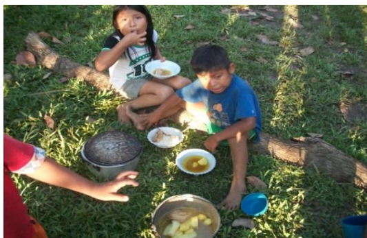
Departamento: Antioquia Municipio: Apartadó Localidad: terreno de la escuela. Lugar y Fecha: parcela escolar –15- 02-2013

Declaración política del Foro de ONG/OSC para la Soberanía Alimentaria. Roma, junio de 2002