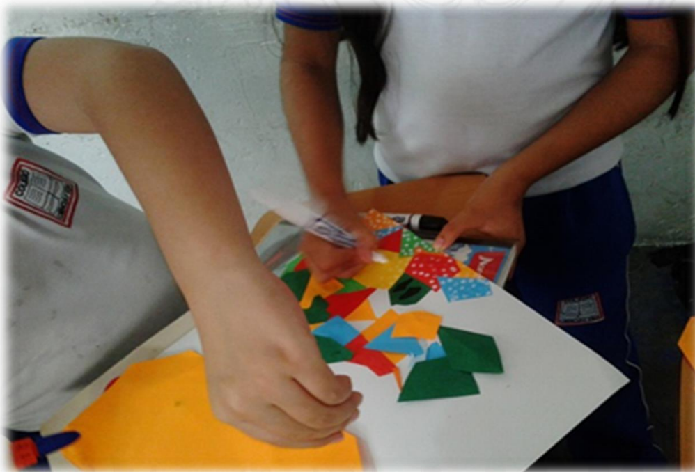
Sesión de Lengua Castellana, Colegio Ciencia y Vida, 2015.

Por último, a través del presente ejercicio, de la búsqueda del estado del arte o del estado de la cuestión, pude establecer una conversación de conceptos, situaciones y problemáticas en común con relación a ambas investigaciones, de igual modo, se logra una comparación respecto a las problemáticas que hoy son el día a día en el ámbito educativo, teniendo en cuenta que la anterior investigación surge en un contexto diferente (Venezuela) al nuestro, se observan similitudes en los discursos con relación a la falta de participación del cuerpo en los contextos escolares, donde se refleje una conciencia corporal y activa.