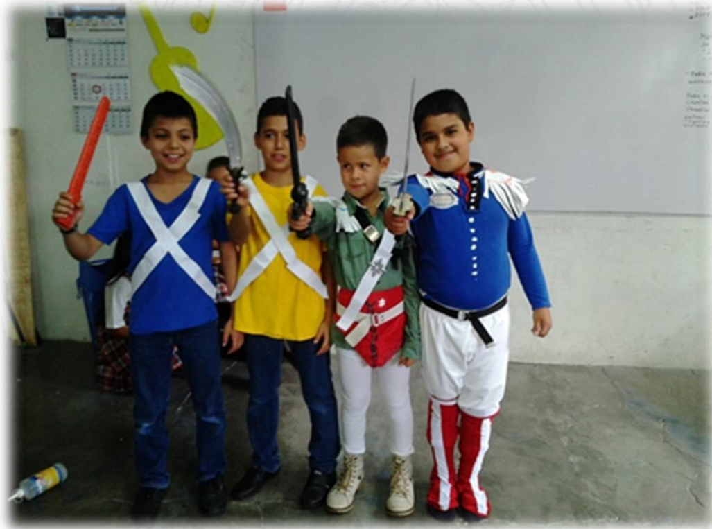
Sesión de Lengua Castellana, Colegio Ciencia y Vida, 2015.

Una de las habilidades más representativas de los seres humanos, es su capacidad de comunicarse, de comprender y de producir infinidad de enunciados.