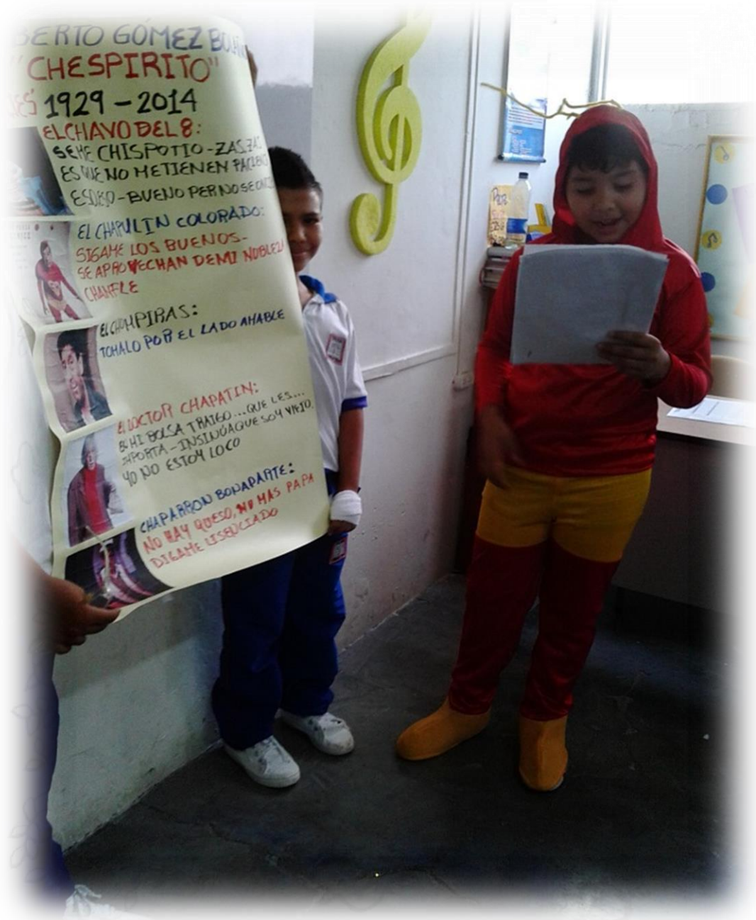
Sesión de Lengua Castellana, Colegio Ciencia y Vida, 2015.