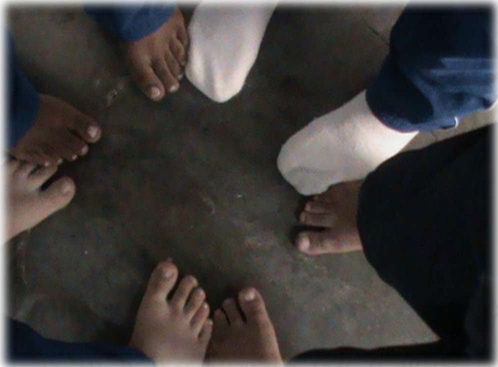
Sesión de Lengua Castellana, Colegio Ciencia y Vida, 2015.

La razón por la cual se decide direccionar el enfoque temático de la práctica hacia la participación de la expresión corporal como posibilidad para el desarrollo de habilidades, tales como: la competencia lingüística, la motricidad gruesa, la apropiación de conocimientos, la memoria y demás aspectos cognitivos que giran en torno al contexto educativo; no es más que el reconocimiento de las múltiples opciones que posibilita dicha estrategia en el ámbito del aprendizaje, dado que esta permite abordar a través del lenguaje no verbal diversidad de caminos, siendo el movimiento y los gestos el puente principal y la lengua como medio de comunicación, el recurso que permite desarrollar la línea temática que se propone.