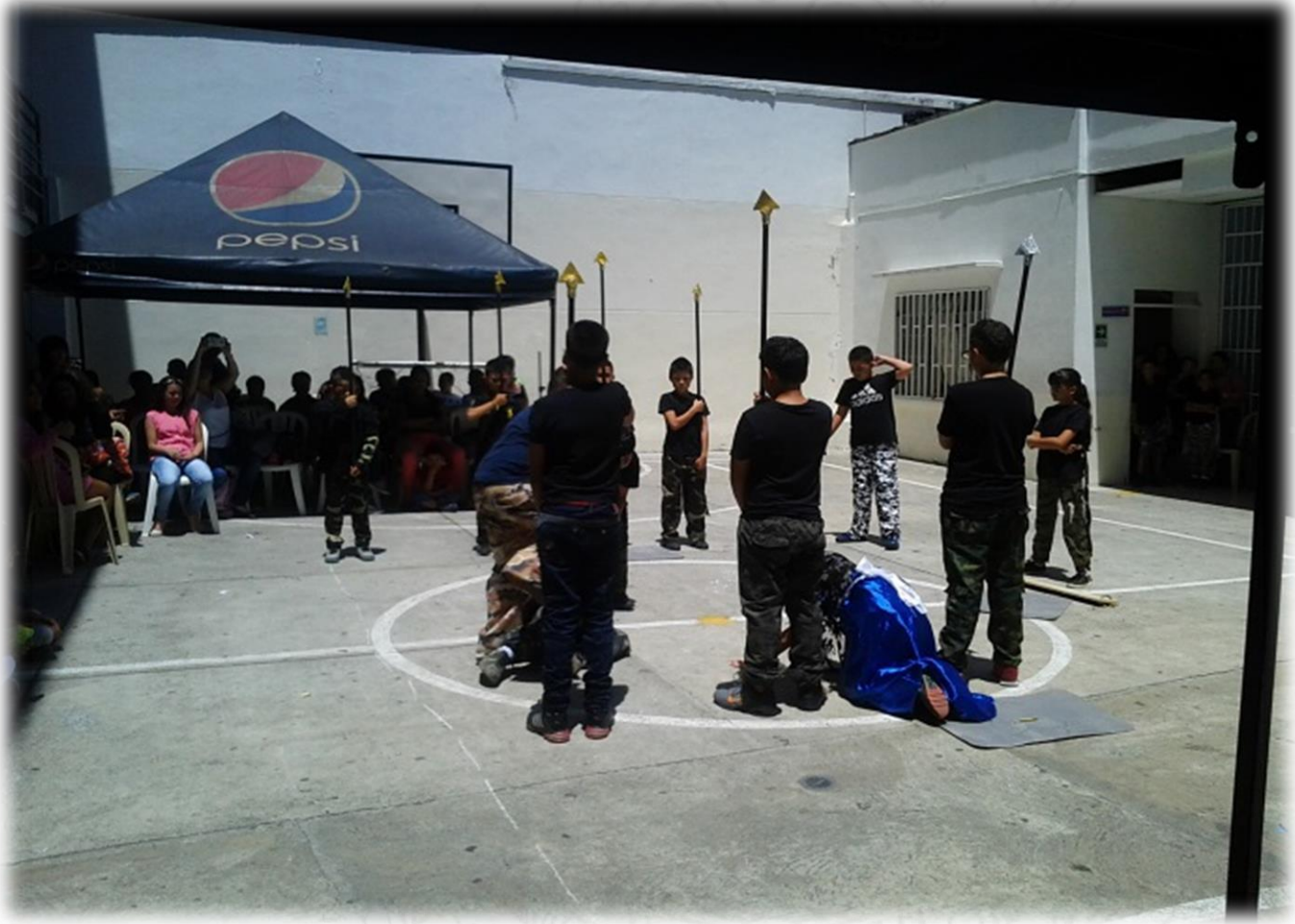
Sesión de Lengua Castellana, Colegio Ciencia y Vida, 2015.