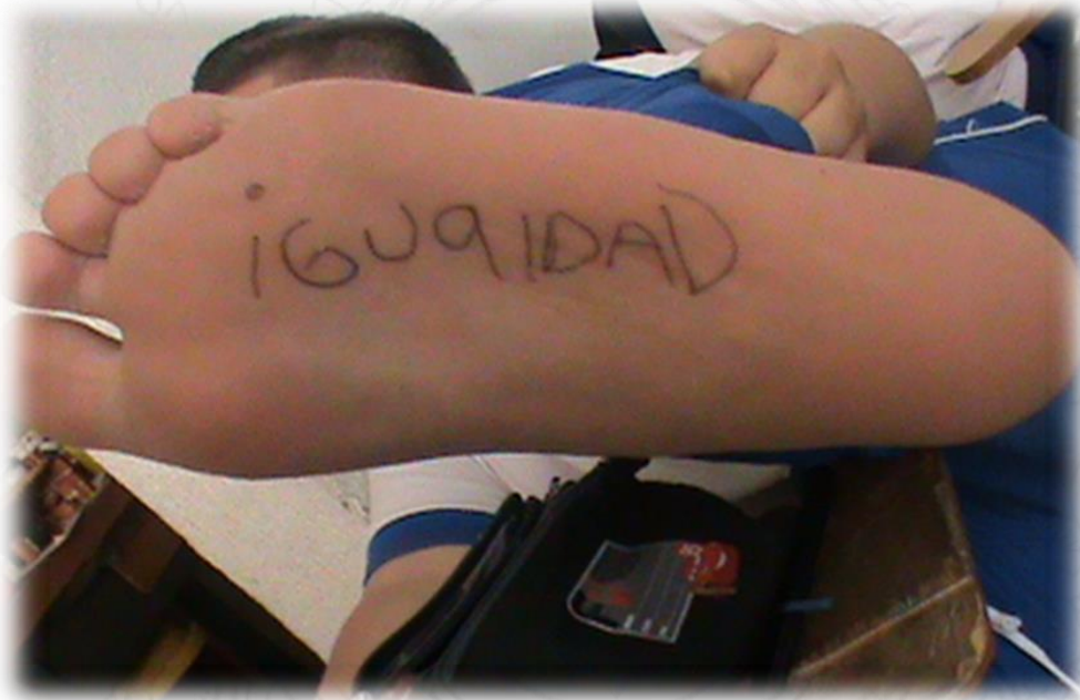
Sesión de Lengua Castellana, Colegio Ciencia y Vida, 2015.

“El hombre está dividido de su propio cuerpo tanto por las disciplinas de la negación y de la pasividad como por las disciplinas de la afirmación y de la actividad” Jorge Larrosa