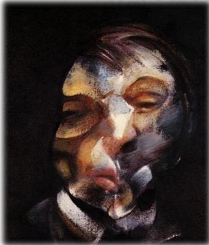
Bacon, Francis, Autorretrato, Siglo XX.