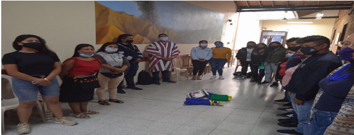
Figura 1. Actividad Armonización llevado a cabo en el marco de la asamblea del Cabildo Inga de Medellín

En este encuentro de armonización para el compartir familiar y socialización de los procesos comunitarios del pueblo Inga, desde el conocimiento ancestral, la palabra dulce y la resistencia Indígena, se presentaron para el ritual dos Baitas, una mochila y una fotografía y una esencia, a continuación, se presenta los sentidos que tienen para las personas que llevaron estos objetos: