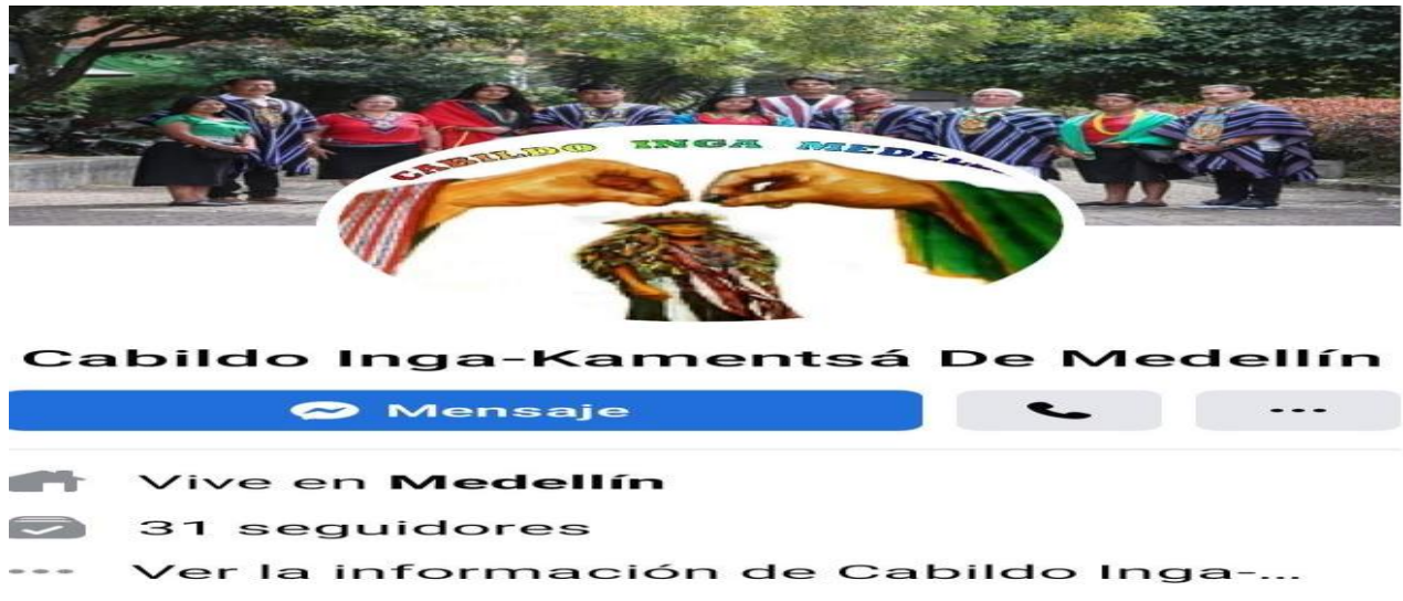
Figura 3. Foto de la portada de la página de Facebook del Cabildo Inga de Medellín.