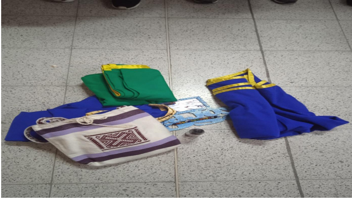
Figura 2. Materialidades que la comunidad llevó para el encuentro de Armonización: 2 baitas, una mochila y una fotografía.

Después de la armonización se llevó a cabo una encuesta a 7 integrantes del Cabildo Inga (ver Anexo 4), en el cual se exploró los significados y sentidos de los términos archivo, documento, memoria y oralidad, para indagar por los conceptos que tienen sobre estos términos la comunidad Inga desde su herencia ancestral y cosmogonías. A continuación, se mostrará los significados que presenta el archivo para la comunidad Inga.