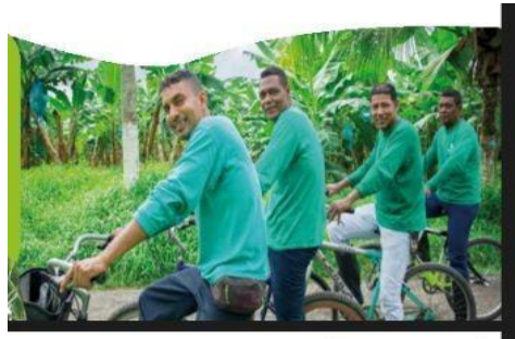
Imagen 4. Sonrisas, pág.79.

Aunque la compañía presenta esta información, no se puede comprobar que todas estas inversiones se hayan realizado, y todos los beneficios se hayan distribuido de la forma en la que Banacol los expone, ya que la empresa pudo haber citado algún documento o certificación expedida por alguna entidad donde se certifique la realización de estas obras sociales. Con esto no se busca decir que Banacol no ha realizado estas inversiones sociales, solo se quiere exponer que surge la duda que, si se hayan realizado en su totalidad todas las intervenciones por parte de la compañía, ya que al presentarse esta información la empresa queda muy bien puesta ante los interesados en el informe, debido a que se ve un compromiso por parte de Banacol hacia la comunidad.