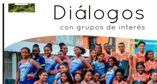
Imagen 1. Grupos de interés, página 21

Para el análisis de los reportes se tuvo como referencia la estructura del año 2019, ya que está más ordenada su presentación, también utilizaron un estándar y se logra identificar de una manera más clara las categorías utilizadas. El informe empieza con la categoría Perfil empresarial, de la cual llama la atención que en el reporte del año 2017 está dispersa por todo el informe y no tiene un orden. En el año 2019 lo organizaron y ordenaron de adecuada forma.