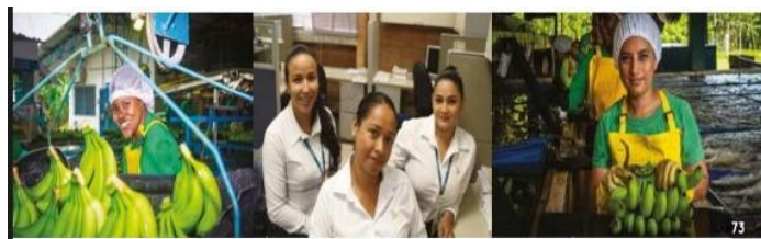
Imagen 3, enfoque a género, pág. 74

En relación con la generación de empleo, se informa que la empresa tiene 4.909 empleados, esta información no hace parte de las prácticas de responsabilidad social, pero de acuerdo con los estándares utilizados para la elaboración del informe es necesario que se presente, aunque la empresa hace mucho énfasis en ella, y muestra demasiada información acerca del tema, lo que se puede interpretar como si la compañía le estuviera sacando ventaja para crear una buena imagen de la compañía a los interesados en los informes.