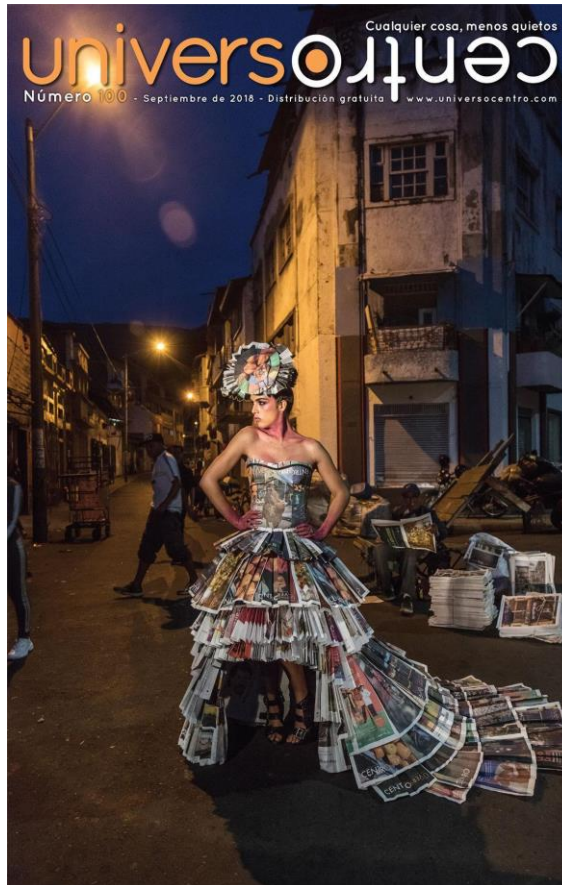
Figura 4. Portada número 100 - septiembre de 2018. Universo Centro . Fotografía realizada en conmemoración de los 10 años del periódico.

En sus 12 años de existencia, el periódico Universo Centro ha tratado varios temas que se manifiestan o se han expresado a lo largo del tiempo. Asuntos como la desprotección, la inequidad, la lucha y el esfuerzo de los trabajadores informales para sobrevivir en condiciones difíciles y con poca remuneración, crítica una sociedad conservadora y de doble moral. Muestra la sexualidad y los estereotipos que existen sobre el cuerpo de la mujer; aborda la diversidad de género, un tema tabú para los ojos de algunas personas, que segregan, estigmatizan y violentan lo que para ellos es diferente. Denuncia las condiciones precarias de algunas edificaciones que son patrimonio del centro de la ciudad. También evidencia la apropiación de algunos personajes que habitan un espacio con naturalidad.