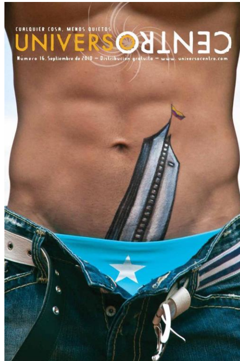
Figura 5. Portada número 16 - septiembre de 2010. Universo Centro . La fotografía se relaciona con el contenido de un artículo sobre el matrimonio y el divorcio gay.

documento testimonial de un tiempo y un lugar. La figura 5 hace referencia a la idiosincrasia paisa con un discurso hegemónico que pone al hombre por encima de la mujer. La tradición que representa el edificio Coltejer, como un símbolo fálico, erecto, deja en claro la idea que se ha transmitido de generación en generación. El orgullo paisa y su hegemonía patriarcal y regionalista. Aunque esto también se identifica en otras regiones latinoamericanas.