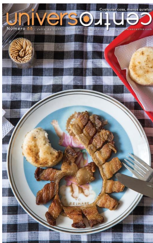
Figura 3. Portada número 88 - julio de 2017. Universo Centro . La historia del chicharrón y su relación con la cultura paisa.

La fuerza del discurso en la imagen capta lo más simple y tradicional de una población determinada, en este caso, la cultura paisa. Una fotografía de un chicharrón en una mesa, muestra la apropiación e identidad que creó Ospina a partir del relacionamiento con el ambiente. “Habremos de entender como significación el proceso por el cual el ser humano reconoce un objeto del mundo, para apropiarse de él y transmitirlo a otros, lo llena de significado, lo convierte en signo” (Toledo & Sequera, 2014, p. 12).