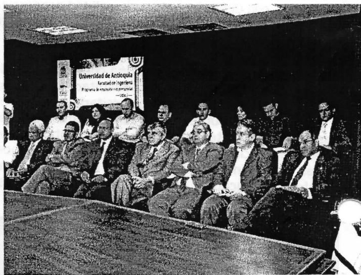
Inauguración de la Red de videoconferencia a través de las que se conectan las subregiones de Antioquia.