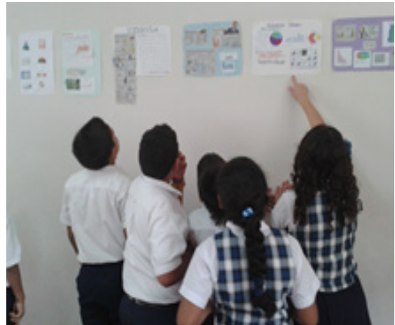
Fig.ura 1: Galería de gráficos estadísticos construido por los estudiantes.

Fase de exploración. La primera actividad se inicia con el reconocimiento de diversos tipos de gráficos estadísticos, el lenguaje de la disciplina, la utilidad de la estadística en las diferentes ciencias, con la intención de obtener un diagnóstico sobre las ideas que tienen los estudiantes acerca de la estadística (Fig. 1).