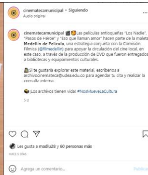
Archivo Medellín de Película