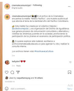
Maleta Relatos Pacífico