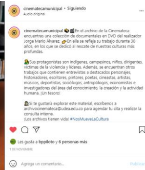
Archivo de Jorge Mario Álvarez