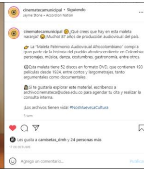
Maleta Patrimonio Audiovisual Afro