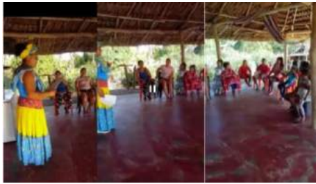
Ilustración 4 Grupo focal. Tertulia cultural. Madres, niños y niñas. (Dic. 10 de 2020)

En la imagen muestro el grupo focal que evidencia la actividad que relaciona este texto.