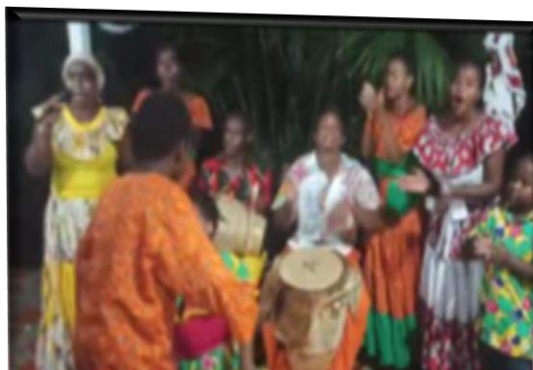
Ilustración 7 Presentación grupo Bullerengue