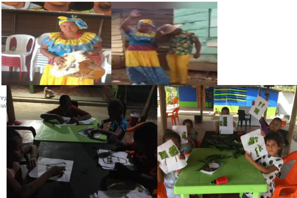
Ilustración 13 Talleres escritos y creativos.

Otro impacto generado, está relacionado con la forma como la familia se integró al proceso de formación de sus hijos e hijas, participando y aportando desde sus saberes populares y experiencias vividas en ese proceso de investigación, fomentando interacciones entre la comunidad educativa y el contexto cultural, conformado por canta-autores, instrumentos, coreografías, diálogos con los abuelos, entre otras.