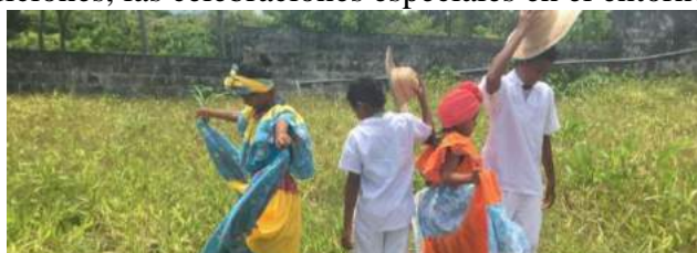
Ilustración 11 Estudiantes de 3°. Tertulia Marzo 23-2021

La cartografía social, permitió identificar que los estudiantes y madres de familia tienen claro que pertenecen al municipio de Necoclí, sector rural el comején, que se expresan con más facilidad, cuando usan gráficos o imágenes representativas de elementos que le llaman la atención como los instrumentos musicales, dentro de los cuales destacaron el tambor, el acordeón, la guacharaca. Además de eso, dieron a conocer todos los valores sociales que reconocen y que manifiestan deben ser fortalecidos para que los estudiantes y jóvenes del territorio demuestren buenos comportamientos, como el respeto por su cuerpo, por las personas que los rodean, la buena convivencia, las buenas relaciones interpersonales basadas en el amor, la amistad, la solidaridad, relacionando constantemente las generaciones antiguas con las de la actualidad. A través de este ejercicio, también mostraron, los valores sociales que conocen y que quieren fortalecer; las costumbres, las tradiciones, las celebraciones especiales en el entorno familiar y social.