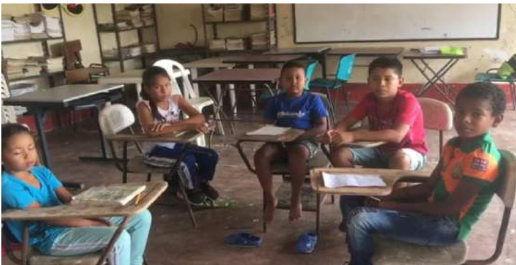
Ilustración 3 Conversatorios con madres de familia y estudiantes Nov. 24/2020

A continuación, voces de los participantes con relación a la concepción de identidad cultural y valores sociales;