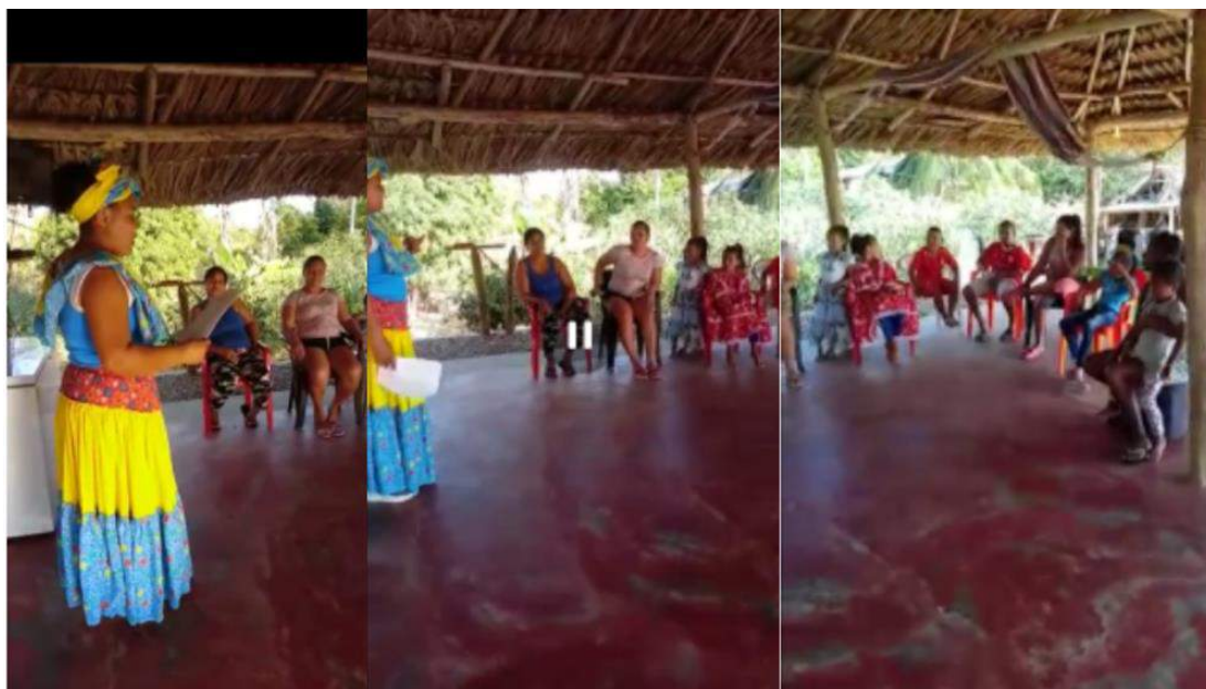
Ilustración 15 Procesos de fortalecimiento de identidad cultural a través del Bullerengue y los valores sociales. Nov, 24.2020.