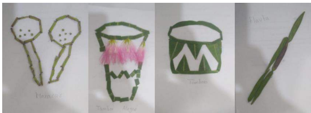
Ilustración 14 Creaciones para el Rincón Pedagógico. Diciembre 16/2020