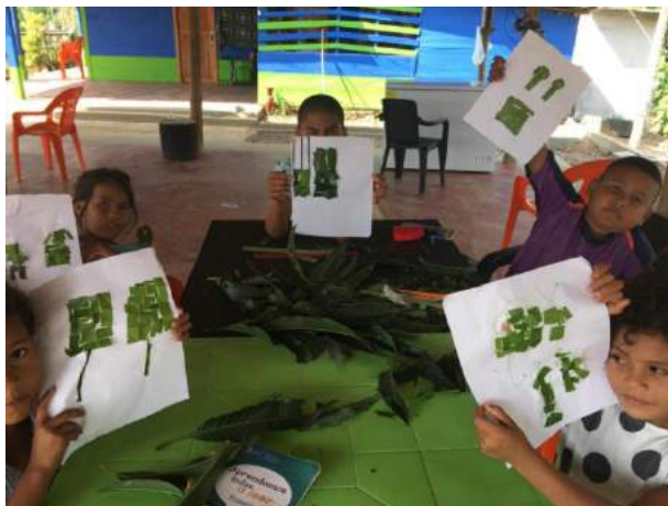
Ilustración 9 Recreando instrumentos musicales del Bullerengue

Al respecto, fue posible aprender, que la sociedad enseña, y que la escuela a través de procesos de investigación como el presente, fortalece aprendizajes y los encamina hacia la edificación de una mejor sociedad, en el caso específico de este proyecto, fortaleciendo su identidad cultural y contribuyendo con la valoración de sí mismo como ciudadano y ciudadana, fundamental para la superación de su territorio a partir de la identidad cultural y los valores sociales.