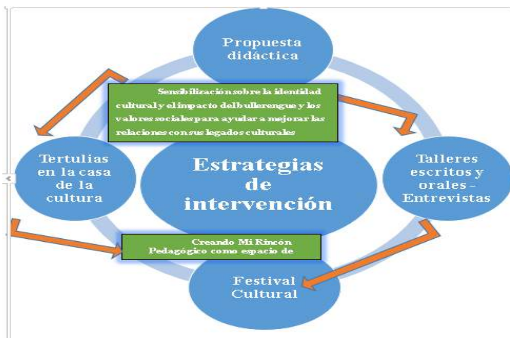
Ilustración 2 Plan de acciones .de intervención Fase; Reconstrucción.

siguiente modelo o diseño estratégico reconstructivo representado en la Ilustración 9, constituida por un eje central que es la propuesta didáctica, que orientará el resto de acciones que se desprenden de esta, como las tertulias culturales, los talleres orales y escritos, el rincón pedagógico, el festival cultural. Todo lo anterior, tiene como propósito, despertar la sensibilización sobre la identidad cultural y el impacto del Bullerengue y los valores sociales para lograr mejorar las relaciones con su legado cultural. Todo lo anteriormente mencionado, se encuentra representado en la siguiente ilustración: