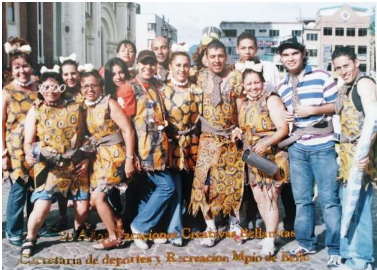
Figura 23. Comparsa temática de las Vacaciones Creativas. 2007.