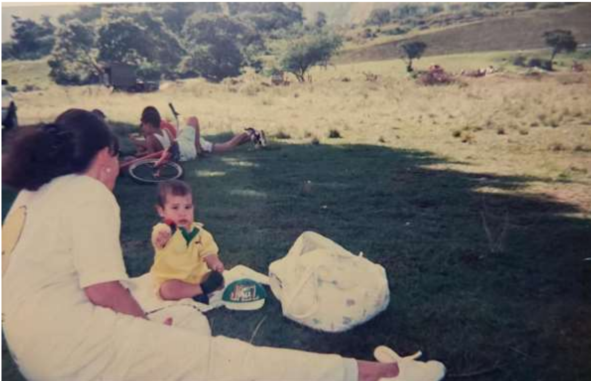
Figura 10. Mangas de Niquía (donde hoy está la urbanización Terranova). 1995.

Ante los atrasos que presentó el municipio de Bello en infraestructura dedicada al deporte y a la recreación, las denominadas mangas, cobraron un sentido social de suma importancia para