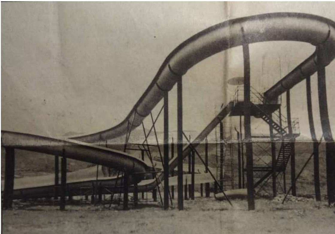
Figura 9. Un aspecto de la Unidad Deportiva Tulio Ospina (fotografía de Gabriel Buitrago, tomada del periódico El Mundo) 11 de junio de 1987.

El limitado desarrollo urbanístico y espacial público de Bello en su equipamiento, tenía al margen el desarrollo cultural de la ciudad, por la inexistencia de una Casa de la Cultura propia y de a poco, a pesar del fortalecido proceso cultural del municipio, Bello se estaba quedando rezagado para la atención de las necesidades básicas humanas de recreación y esparcimiento, dado que no existían escenarios deportivos de calidad y renombre, más allá de aquellos bajo la tutela de la empresa privada y de algunos escenarios deportivos en los barrios, que fueron cuidados y promovidos por las Juntas de Acción Comunal, vecinos y parroquias principalmente.