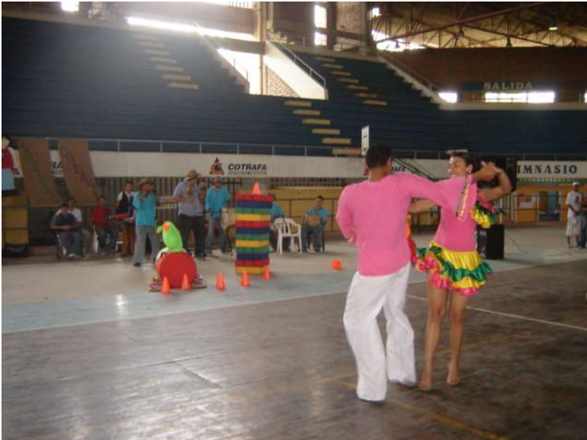
Figura 22. Muestras artísticas durante la inauguración de las Vacaciones Creativas. Sin fecha.

Aunque las Vacaciones Creativas fueron solo uno de los programas que nacieron en el seno del Departamento de Recreación y Deportes, en la secretaría de Educación municipal en 1987, su experiencia en este congreso y otros que se generaron posteriormente, recogieron lo más significativo de esta dependencia administrativa en su accionar en la ciudad. De la exposición de la estructura de las VACREBE, se resalta el modelo de convocatoria, las capacitaciones y sus componentes, la multiplicación de los conocimientos y las réplicas recreativas de lo aprendido en un amplio sector de Bello. Las capacitaciones comúnmente habían estado atendiendo a un total de 400 personas por jornada y entre 1987 y 1998 se habían capacitado en la metodología de Vacaciones Creativas unas 15.470 personas, principalmente jóvenes, con presencia estable en 70