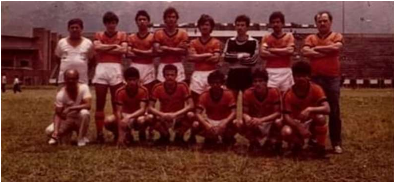
Figura 13. La Naranja Mecánica. 1984.

1987, llegó con un aparato administrativo con contemplaciones en el área deportiva, cada vez más fortalecidas, aunque seguían existiendo dificultades en materia. Para la vigencia fiscal de enero de ese año, la alcaldía municipal tenía destinados $33.300 en programas recreativos, $471.500 para los parques y placas parques. Además de cuantiosas sumas para el parque Gran Avenida y el del barrio La Selva, había rubros importantes destinados para los servicios técnicos, materiales, suministros y auxilios del departamento de Recreación y Deportes, aun adscrito a la Secretaría de Educación 219 . Con este panorama, cada vez más estructurado en materia deportiva y recreativa, se evidenció e propósito administrativo de favorecer la recreación, de puertas para adentro y de puertas para afuera, desde entonces ya entendida como un elemento no necesariamente ligado a la práctica de algún deporte, sino como asunto cultural en el ejercicio de los juegos tradicionales, competitivos, cooperativos y de otro tipo. Al menos desde 1986, había una partida presupuestal destinada al fomento deportivo con los empleados de la alcaldía municipal.