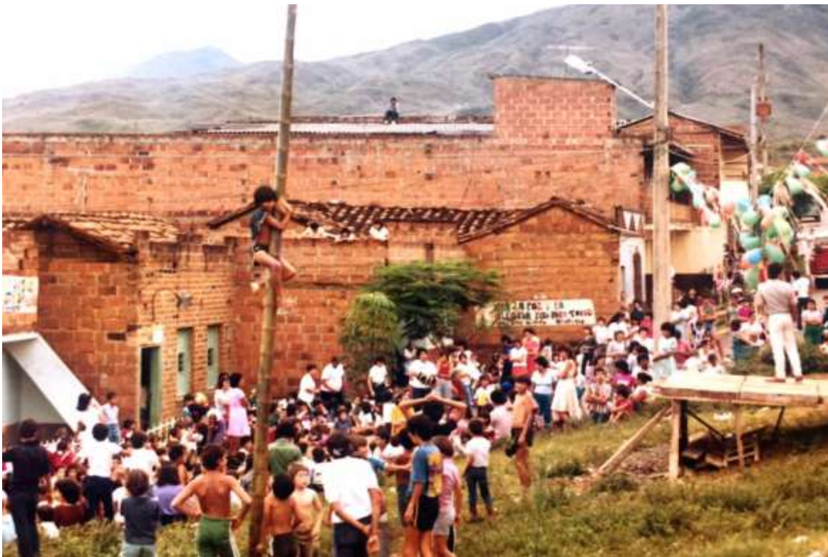
Figura 4. Integración cultural y recreativa-comunitaria en el barrio El Rosario. 1985.

deportivos en la ciudad 87 . La autora reconoce el potencial que para 1980 tuvieron las juntas de acción comunal del municipio y resalta el poder transformador de las mismas en sus comunidades, dado el alto conocimiento que tienen de sus sectores, por esta razón, señala el norte de la asociación que deben seguir las organizaciones comunitarias, en conjunto con la administración municipal y la empresa privada para la consolidación de nuevos espacios recreativos y deportivos en beneficio de los bellanitas.