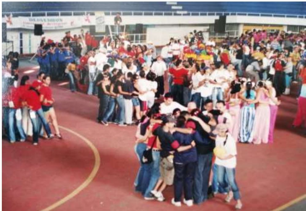
Figura 18. Juegos de rompehielos e integración en las Vacaciones Creativas. Junio de 1997.

Sigifredo, Agencia Rosalía, Magnesio Bolivalle, Papelería Bolivariana, Panadería El Carmen y CIPA, Postobón, Coca-Cola, Tutti Frutti, la Compañía Nacional de Chocolates y otras 293 . La vinculación de la alcaldía municipal, las cooperativas de trabajadores, el comercio, las empresas, los parques recreativos y en general de las fuerzas vivas de la ciudad entorno a las Vacaciones Creativas, permite dilucidar el alto impacto alcanzado por los grupos organizados y el apoyo del Departamento de Recreación y Deportes para la promoción de la recreación en Bello, además de mostrar el levado poder de gestión de los involucrados en un programa que con los años se convirtió en la cara de la ciudad en otros contextos. De esta manera las Vacaciones Creativas encontró un espacio y se compenetró con el acontecer bellanita, manteniéndose en el panorama social y recreativo del municipio y para ese año estuvo representado por un número significativo de recreacionistas en el desfile del 12 de agosto, en el marco de la Fiesta de la Antioqueñidad (evento institucionalizado en agosto de 1987 294 ) que junto con las Fiestas del Idioma en el mes de abril, constituían para entonces las más importantes celebraciones culturales de la localidad.