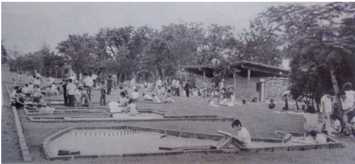
Figura 6. Parque infantil Fabricato. Revista Fabricato Al Día . noviembre-diciembre de 1973

Cada una de las juntas por la diversidad de su composición y las características singulares de los barrios en los que inciden y en aras de satisfacer sus carencias comunitarias, debieron trabajar en situaciones complejas con actores externos a sus comunidades, como sucedió con la JAC Puerto Bello y la empresa textilera Fabricato, quién que a pesar de sus impulsos al deporte y la cultura bellanita, con la construcción de canchas de futbol y baloncesto, un parque infantil, un golfito, béisbol y ping-pong en este sector 98 , tuvo un desencuentro con la JAC y la comunidad de Puerto Bello. En 1987, Fabricato inició la construcción de un parqueadero de tracto camiones el frente de su planta principal, en jurisdicción del barrio Puerto Bello; la solicitud expresa de la comunidad