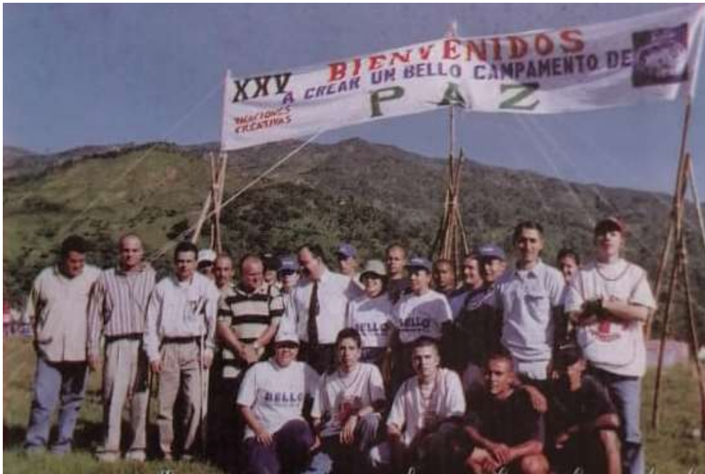
Figura 21. XXV Vacaciones Creativas Bellanitas - Campamento líderes recreativos. Enero de 2000.

La XIX versión de Vacaciones Creativas llegó en enero de 1997, con un camino recorrido de 9 años y medio y una trayectoria rica en experiencias vivenciales sobre la recreación y la lúdica en la ciudad y aunque desde los inicios del programa hubo personal de otras áreas del conocimiento integradas al asesoramiento de la propuestas de intervención, en 1997 de manera más clara se evidencian los frutos de la participación de recreadores, educadores físicos, médicos, sociólogos y otros que contribuyeron a ampliar los conocimientos en materia recreativa y pedagógica principalmente, pero también a abrir espacios democráticos, críticos y trascendentes de la recreación en el contexto bellanita. Con este modelo se reafirmó la importancia del quehacer recreativo en el municipio y los largos alientos que tenían las Vacaciones Creativas para seguir su trabajo en función de los jóvenes y niños. Esta versión era la antesala de la primera década de existencia de las “VACREBE” como se empezaron también a conocer las Vacaciones Creativas,