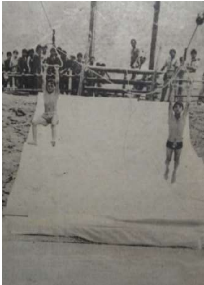
Figura 11. Parque acuático Metropolitano Tulio Ospina. 11 de junio de 1987.

en favor y fomento de otras disciplinas deportivas 205 , es decir que la administración del deporte y la recreación estaba ya generando réditos importantes a las arcas municipales para el fortalecimiento y favorecimiento del deporte en Bello. En el empeño por generar una imagen propia de Bello como motor del deporte en el Área Metropolitana, la administración municipal destinó recursos propios, por medio de un auxilio de $500.000, a la Junta Municipal de Deportes para la financiación del campeonato nacional junior de baloncesto, masculino y femenino que se realizó en la ciudad en julio de 1986 206 , es decir que por sus avances, Bello volvió a ser sede de un campeonato de Baloncesto, aunque en categorías distintas.