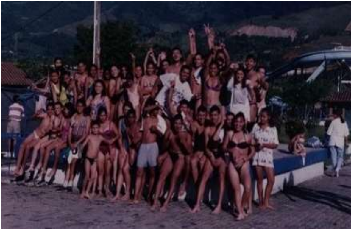
Figura 14. Líderes recreativos y comunidad en un día de sol en el Parque recreativo Tulio Ospina. Década de 1980.