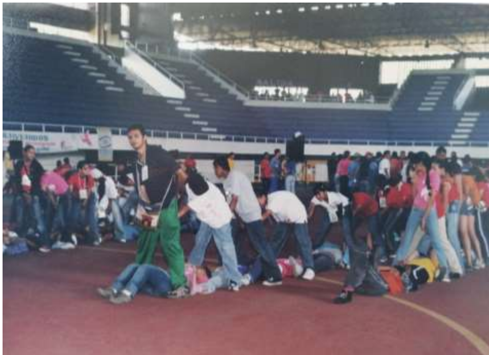
Figura 17. Talleres lúdicos de juegos cooperativos, Vacaciones Creativas 10 años. Junio de 1997.

El informador da cuenta del nacimiento de otros programas paralelos a las Vacaciones Creativas que experimentaron la recreación desde otros campos y con nuevas posibilidades, aunque evidentemente fue este programa un importante dinamizador entorno a la lúdica bellanita, a la par y con actores sociales muy similares a los que frecuentaban las Vacaciones Creativas nacieron los “Domingos de caminata por los caminos de Bello” que para mayo 28 del mismo año, desarrolló su segunda salida a la vereda Potrerito, la anterior se llevó a cabo a la vereda Tierradentro 280 , con la participación de más de 90 personas y el plan incluyó actividades medioambientales, a la manera de los tradicionales paseos de olla o salidas a charcos en el que disfrutar de los paisajes, almuerzos, música y otras actividades, eran el principal atractivo.