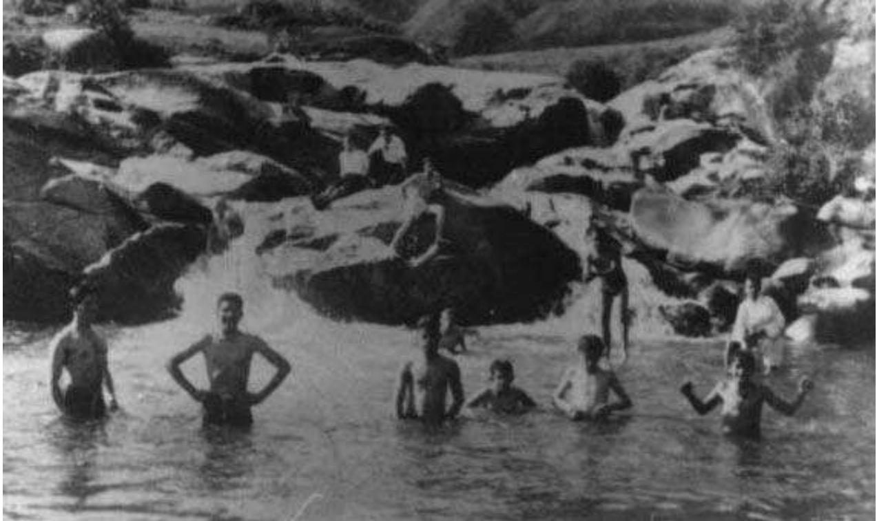
Figura 8. Bañistas en la quebrada La García. Archivo fotográfico visual de Bello. Década de 1940.

Durante el segundo lustro de 1960 y antes de la puesta en funcionamiento de una organización empresarial que articulara los procesos comunitarios, sociales, deportivos y laborales de Fabricato a las dinámicas de la ciudad, el Departamento de Relaciones Humanas de la empresa, ya se encontraba trabajando en proyectos sociales para el beneficio comunitario y sobre salen actividades organizadas como presentaciones de teatro en el naciente barrio San José Obrero, barrio por demás generado gracias al impulso que la empresa tuvo para la adquisición de vivienda de sus trabajadores, ubicado muy cerca de la sede principal de la industria textil y otros eventos culturales de ciudad 129 . El patrocinio del departamento de Relaciones humanas, permitió la descentralización del arte, la cultura y la recreación a los barrios, para esto realizó presentaciones como la que tuvo lugar en el barrio Obrero en abril de 1969 por ejemplo, en la que se invitó especialmente al grupo “teatro Popular de Bogotá”, con la obra infantil “la Cenicienta”, generando en la comunidad bellanita de apoco el hábito del consumo cultural, mismo que creció en la medida