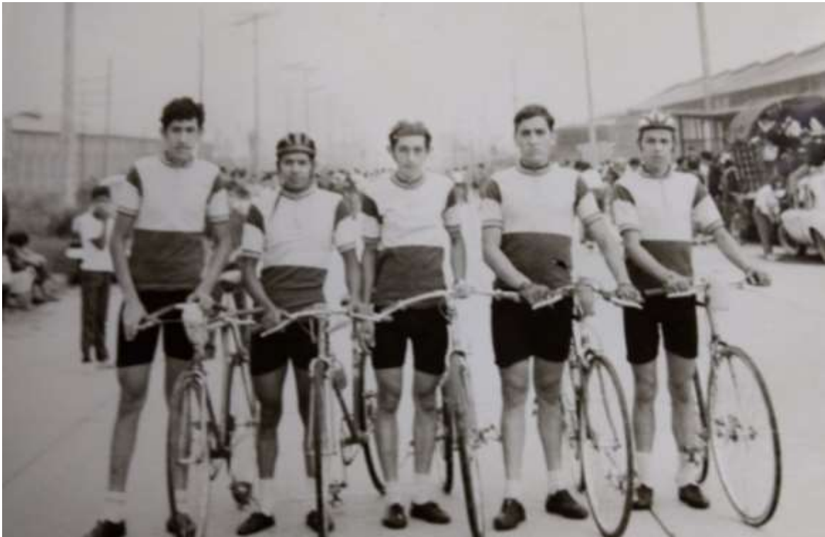
Figura 5. Club Ciclo Esperanza. Sin fecha.

“Fogateros” fue una iniciativa cultural que en primera instancia se desarrolló en el barrio El Rosario pero que paulatinamente, alcanzaría otros rincones de Bello y diversificaría su oferta cultural. A través de Fogateros se convocaron a distintos líderes de los barrios de la ciudad, con la intención de ampliar el radio de acción de las actividades realizadas. Dentro de su propuesta cultural, estuvo implícitamente la recreación y la búsqueda constante de nuevos espacios para la cultura bellanita. En su conformación fue importante la participación de la JAC El Rosario y líderes del mismo barrio que propiciaron los encuentros y reuniones para planificar las acciones concretas. El movimiento Fogateros de Bello que tuvo sus inicios en 1978, reviste especial importancia en la