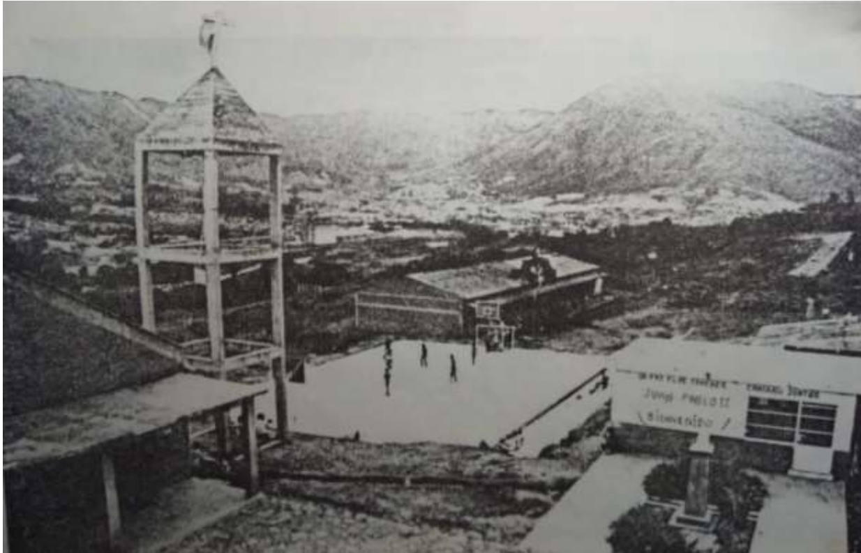
Figura 7. Parroquia San Roberto Belarmino (Zamora) con la placa deportiva de su propiedad.

Las acciones de la iglesia en el ámbito bellanita fueron contundentes en la centralidad y los sectores vulnerables, por la promoción de actividades que favorecieran el aprovechamiento del tiempo libre de la población, resaltando además que en varios templos parroquiales y con el mismo propósito de favorecer la recreación y la cultura, fueron promovidos los grupos locales artísticos y la parroquia Nuestra Señora del Rosario (con la capilla de Hato Viejo incluida), acogieron importantes eventos culturales en el marco de los XIII Juegos Centroamericanos y del Caribe. Esta disposición de la iglesia, fue la cara de la receptividad que la misma estaba teniendo en el apoyo del crecimiento de Bello a través de otros tipos de actividades, distintas a la pastoral.