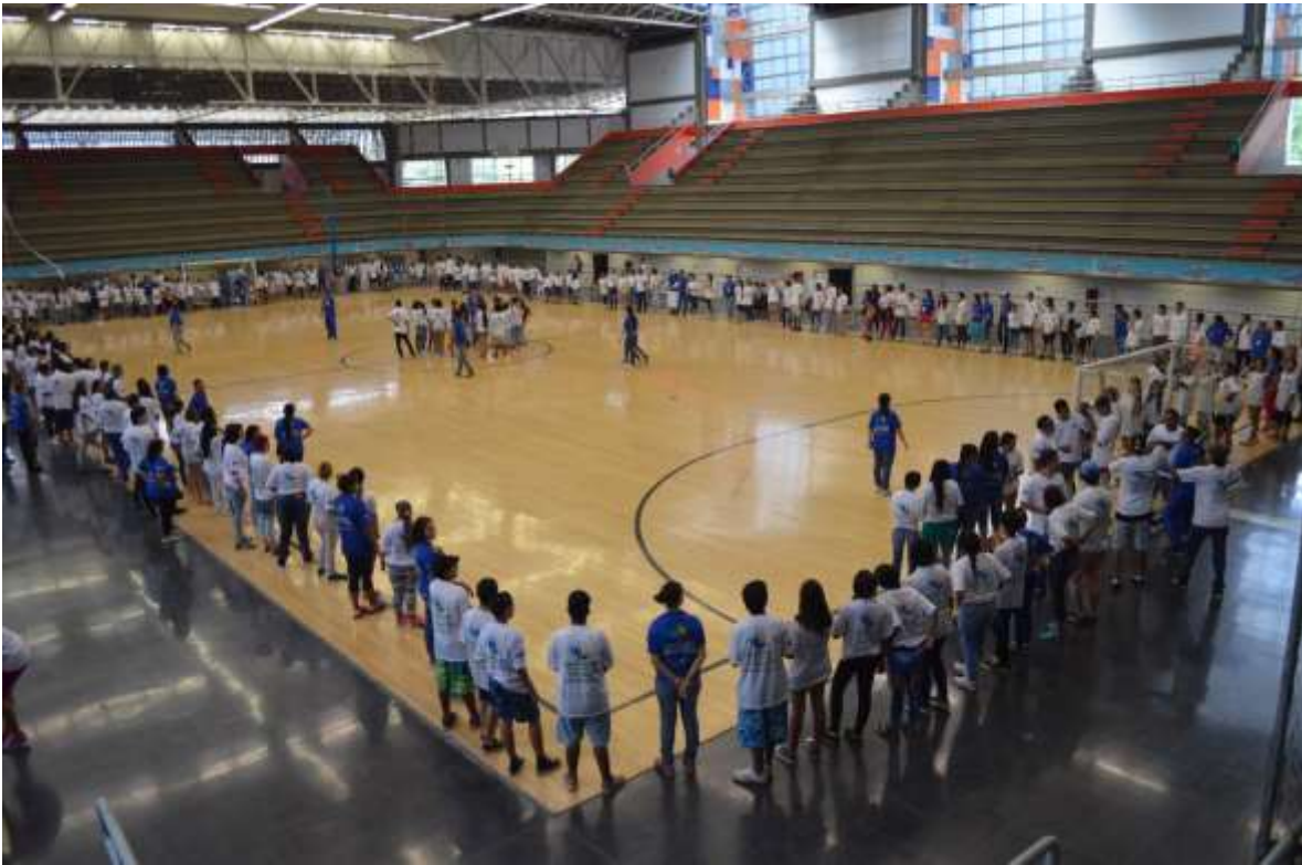
Figura 25. Vacaciones Creativas 2015. 2015.

Aquellas capacitaciones que fueron operadas por la Corporación Polo Norte, misma que se había encargado de desarrollo de versiones precedentes y subsiguientes, propuso la documentación de los juegos, rondas y actividades y su divulgación a través de los medios electrónicos, como una estrategia de vincular que el que hacer recreativo de las Vacaciones Creativas con las nuevas tendencias de la información, aunque fue la primera y la única vez que con tal contundencia se compartieron los juegos, las rondas y el resto de contenidos para replicar en los barrios. La edición decembrina del programa (58), acompañada por un nutrido grupo de facilitadores, calculó más de 7.000 niños participantes en 72 barrios de Bello, por medio de los cerca de 650 jóvenes líderes que respondieron al llamado, haciendo nuevamente eco de los mensajes de esperanza, paz y convivencia en los sectores, cuando la violencia volvió a campear en algunos de ellos.