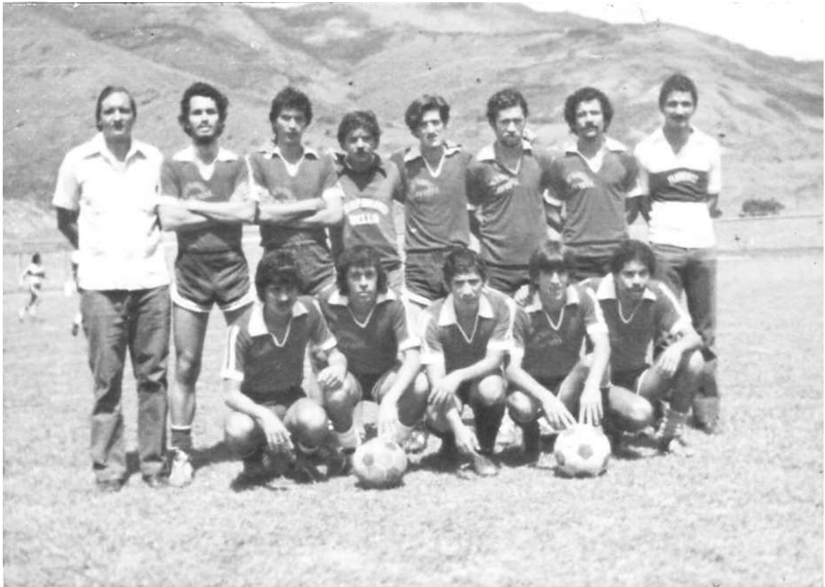
Figura 2. Selección de futbol del barrio Bellavista, década de 1970.

Los tempranos impulsos de empresa privada, representada en Fabricato, posibilitaron la organización social de los sectores y la búsqueda conjunta de los mismos por organizar sus propios certámenes deportivos, como emulación de los encuentros recreativos promovidos por la textilera.