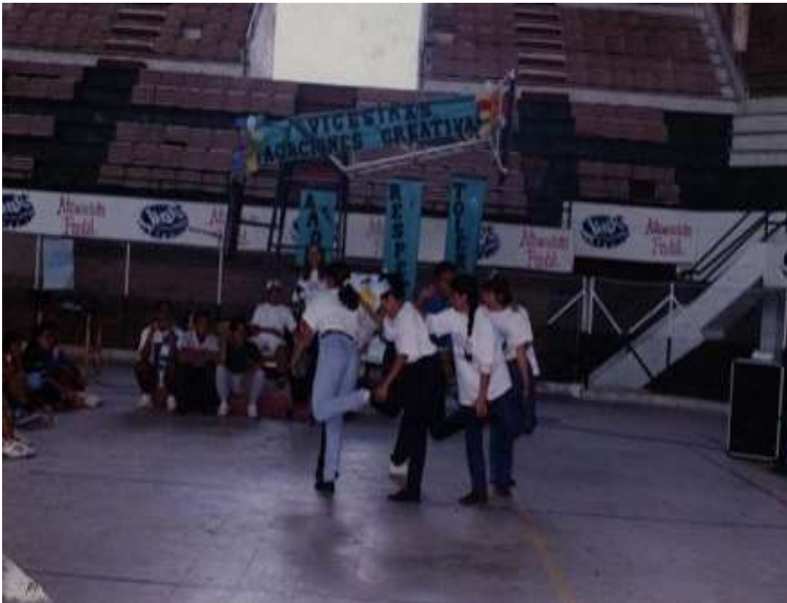
Figura 20. XX Vacaciones Creativas Bellanitas. Junio de 1997.

Las doceavas Vacaciones Creativas Bellanitas se realizaron entre el 17 de junio y el 6 de julio de ese mismo año y no presentaron novedades sustanciosas respecto al ya consolidado modelo que había imperado en las ediciones anteriores, sin embargo en la publicidad de aquel año sobre salen primero las invitaciones a los líderes a ser responsables de la ejecución del programa en sus propios barrios y veredas y se reforzaron los componentes de trabajo en equipo y la disciplina para alcanzar los objetivos recreativos, a la vez que se invitaba a la juventud a ser autocrítica y fiel a sus sentires 309 . El único aspecto ausente en las ediciones anteriores que, si se identifica en la XII versión de Vacaciones Creativas, es la prohibición expresa de realizar el programa en barrios y veredas, de los que no haya ningún representante en las capacitaciones que se llevaron a cabo en el Coliseo Cubierto Tulio Ospina.