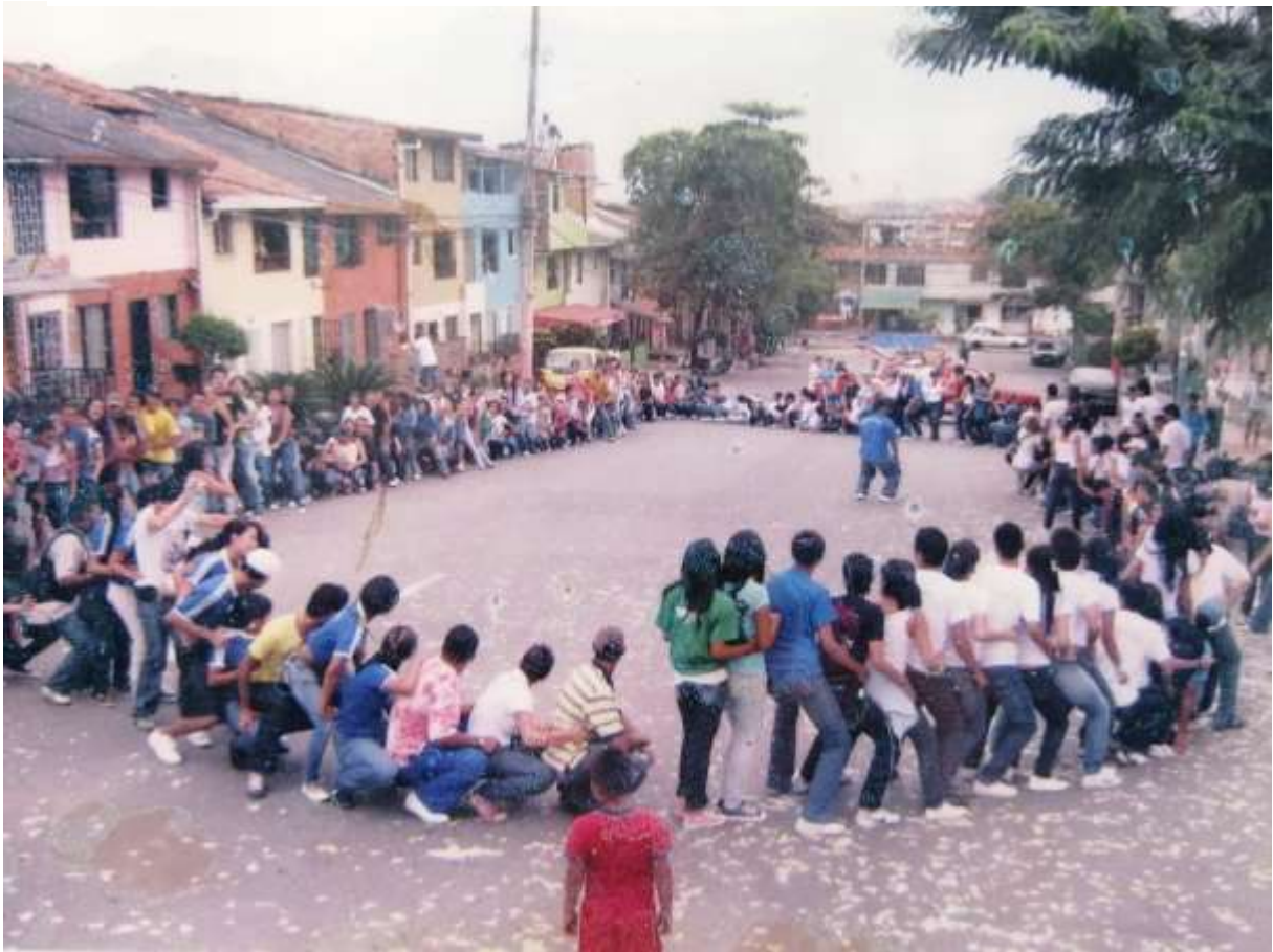
Figura 24. Vacaciones Creativas Bellanitas 2009, sector La Primavera. 2009.

Aquella versión particular de Vacaciones Creativas fue el termómetro que evidenció la preparación de los jóvenes líderes recreativos para asumir la coordinación y gestión para mantener vigentes y en acción los programas de los que se habían apropiado por entonces, en contraste con la vigorosidad de los movimientos juveniles que acertadamente participaron para gerencia propia en las actividades que fueron de los ya típicos talleres formativos, hasta concursos de sancochos y actividades que propiciaron el encuentro de juventudes de la mayoría de comunas de la ciudad. Aquella edición de las Vacaciones Creativas y sus capacitaciones, realizadas por primera vez en años en un barrio, le permitió a la comunidad del barrio La Primavera ver la fuerza del proyecto juvenil bellanita representada en sus grupos y en la alegría de la recreación, llevándose a cabo en sus calles, además de mostrarle a la administración municipal que el cimiento del proceso