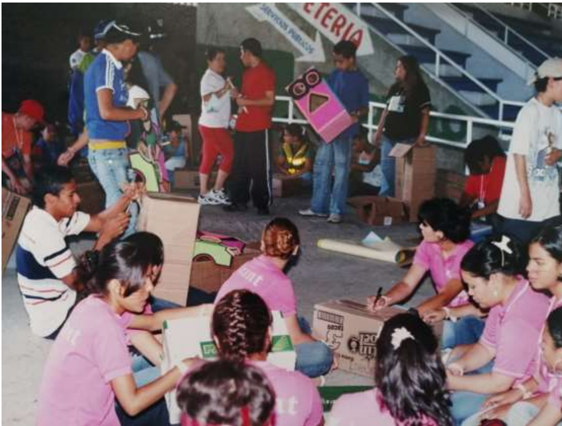
Figura 16. Talleres de manualidades Vacaciones Creativas. Archivo personal Gustavo Adolfo Posada Gil. Junio 2008.

El año 1989 representó la consumación del proyecto recreativo de la ciudad y las Vacaciones Creativas sufrieron su más importante notorio crecimiento en participación, habiendo