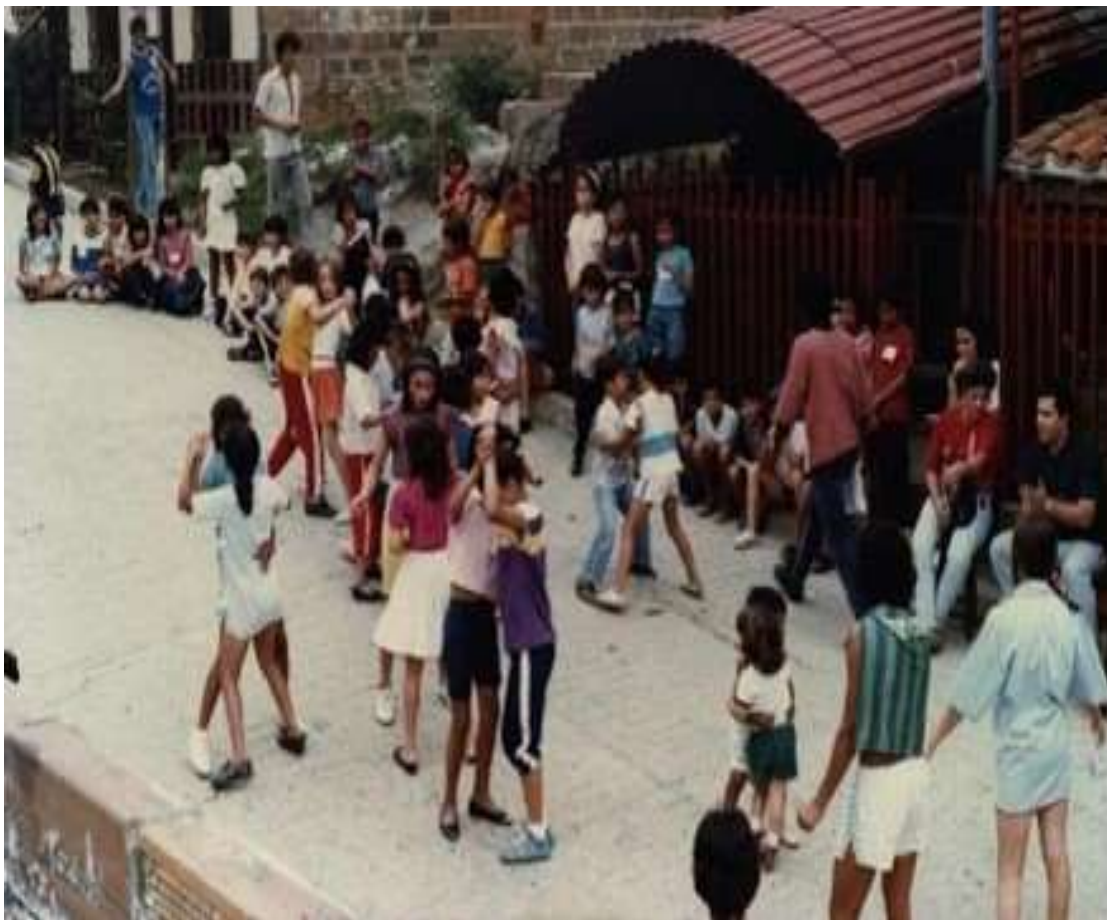
Figura 15. Niños de las Vacaciones Creativas bailando. Archivo personal Gustavo Adolfo Posada Gil. 1990.

El desarrollo de las rondas estaba enteramente ligado a la expresión corporal y a la danza, por lo que en conjunto con el juego complementaban teórica y prácticamente lo aprendido desde estos campos. La ronda como antesala o rompe hielo, tenía un propósito elástico, es decir que podía