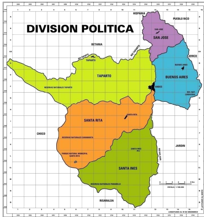
(Gráfica 2. División Política del Municipio de Andes)

El municipio de Andes actualmente cuenta con un total de 44.371 habitantes, según datos del Sisbén III. Del total de la población, 18.797 residen en el sector urbano y 25.574 en el sector rural. Dentro de la población 1.187 se encuentran en situación de discapacidad, entre ellas, 64 personas con discapacidad visual, 202 personas con discapacidad auditiva, 58 personas con discapacidad en el lenguaje, 266 personas presentan dificultad para moverse o caminar, 120 personas con dificultad para bañarse y vestirse, 153 personas dificultad para salir a la calle y 324 personas con discapacidad cognitiva. De este grupo poblacional, 482 habitantes pertenecen a la zona urbana, 163 habitantes a la zona rural y 543 habitantes a la zona rural dispersa; de este total poblacional, solo se encuentran estudiando 243 personas (Plan de Desarrollo, Andes, 2012-2015).