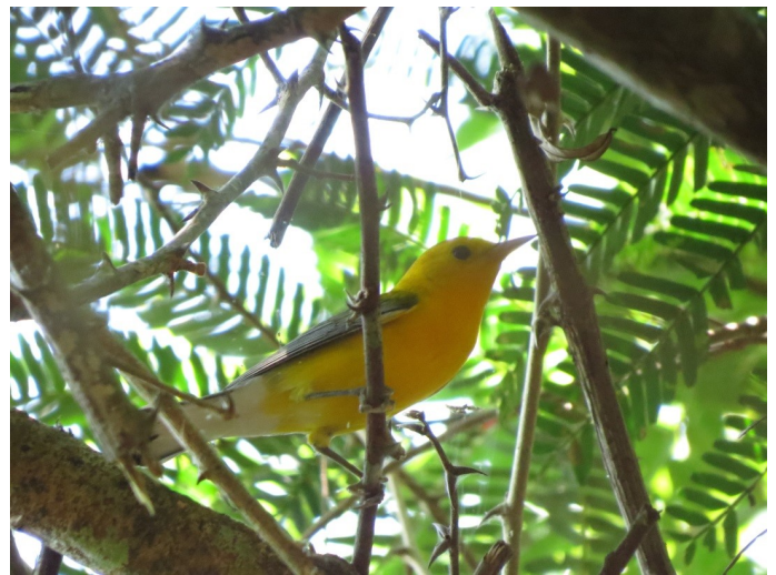
Figura 6. Macho de Protonotaria citrea registrado en la vereda Buena Vista II, municipio de San José del Guaviare, Colombia.

Geothlypis philadelphia (Reinita Enlutada, Mourning Warbler): Especie migratoria boreal, se reproduce en el norte de los Estados Unidos y sur de Canadá (Hernández-Plata & Peraza 2012, Curson 2018b). Presente en Colombia al oeste de los Andes, con registros puntuales al este de los Andes en Arauca, Casanare, Meta, oeste de Caquetá y Putumayo (Hilty & Brown 1986, Hernández-Plata & Peraza 2012, Acevedo-Charry et al. 2014, Curson 2018b, eBird 2018). Registramos G. philadelphia en varias ocasiones en la vereda Playa Nueva, municipio de Puerto Concordia en cercanías al río Guaviare (2° 35' 12" N 72° 39' 20" W, 183