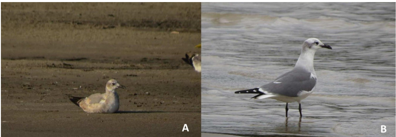
Figura 3. Individuos de Leucophaeus atricilla registrados en playas del río Guaviare, Colombia. A) Individuo de segundo año posiblemente, B) adulto con plumaje no reproductivo.