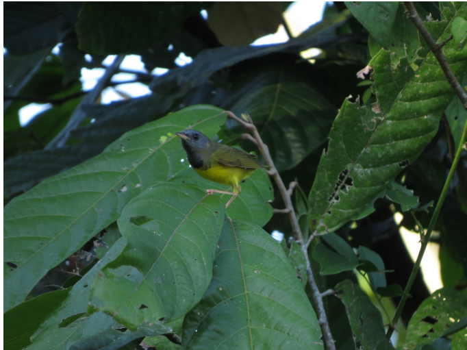
Figura 7. Geothlypis philadelphia . Macho registrado en la vereda Playa Nueva, municipio de Puerto Concordia, departamento del Meta, Colombia.

msnm): el 6 de diciembre de 2015 observamos un macho adulto en un naranjo ( Citrus sp.) en medio de un área de cultivos ‘pancoger’; el 25 de diciembre de 2015 observamos un macho en un rastrojo (Fig. 7); el 3 de enero de 2017 observamos un individuo en un cacao ( Theobroma cacao ) en medio de un área de cultivos ‘pancoger’; y el 8 de enero de 2017 observamos una hembra en un pastizal en el borde de una barranco de una quebrada seca.