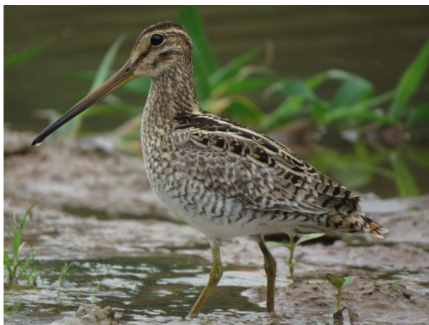
Figura 4. Individuo de Gallinago delicata registrado en la desembocadura del Caño Negro con el río Guaviare, Colombia.

Buteo swainsoni (Águila de Swainson, Swainson's Hawk): Especie migratoria boreal que se reproduce en el oeste y centro de Norteamérica desde Alaska hasta el oeste de Canadá por el sur hasta el oeste de Estados Unidos hasta el norte de México (Devenish 2012, White & Kirwan 2018). En Colombia se encuentra en grupos de tamaño variable durante su migración, generalmente bandadas numerosas, principalmente al oeste de los Andes (Hilty & Brown 1986, Devenish 2012) y en el flanco oriental de la cordillera Oriental (Márquez et al. 2005, eBird 2018), con registros aislados en Leticia (40–60 individuos) (P. Alden & S. Hilty en Hilty & Brown 1986), San Pedro de Tipisca (Amazonas) (85 individuos) (L. G. Naranjo, marzo de 2015) y Casanare (J. Castaño, marzo de 2016) (eBird 2018). Registramos B. swainsoni en tres ocasiones: el 9 de noviembre de 2017 en el municipio de El Retorno (2° 15' 25" N, 72° 38' 43" W, 200 msnm) cerca de 60 individuos planearon sobre un potrero; y el 7 y 28 de abril de 2018 en la vereda el Edén,