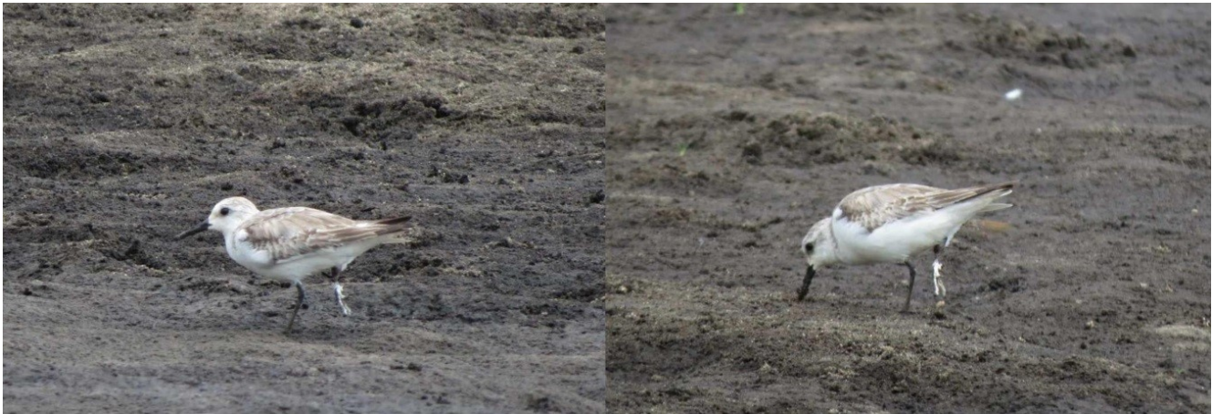
Figura 2. Calidris alba . Registrado en febrero de 2016 en playas del río Guaviare, Colombia.