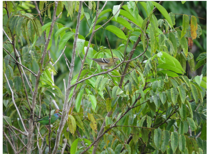
Figura 8. Setophaga castanea . Macho registrado en la vereda San Isidro II, municipio de Retorno, departamento del Guaviare, Colombia.

Setophaga castanea (Reinita Castaña, Bay-breasted Warbler): Especie migratoria boreal que se reproduce en el centro y este de Canadá y sur de los estados norteros de Norteamérica (Cifuentes-Sarmiento 2012). En Colombia registrada principalmente al oeste de los Andes y en la base este de los Andes por el sur hasta el suroeste del Meta (Hilty & Brown 1986, Cifuentes-Sarmiento 2012, Acevedo-Charry et al. 2014); con registros aislados en Casanare (Orocúe) (J. Zamudio, noviembre 2014) e Inírida (Guainía) (L. G. Naranjo, febrero 2008) (eBird 2018). Registramos S. castanea el 14 de noviembre de 2017 en la vereda San Isidro II, municipio de El Retorno (2° 16' 45" N, 72° 33' 28" W, 215 msnm) (Fig. 8). El registro fue de un macho con plumaje de invierno forrajeador en un borde de bosque intervenido en una bandada mixta compuesta por Tolmomyias poliocephalus , Dacnis cayana , Tangara velia , Stilpnia nigrocincta y Setophaga petechia .