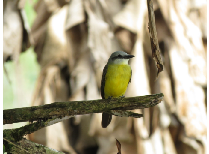
Figura 5. Individuo de Tyrannus albogularis registrado en la vereda Playa Nueva, municipio de Puerto Concordia, departamento del Meta, Colombia.

Protonotaria citrea (Reinita Cabecidorada, Prothonotary Warbler): Especie migratoria boreal que se reproduce generalmente al este de Estados Unidos y al extremo sureste de Canadá (Hilty & Brown 1986, Morales & Cifuentes-Sarmiento 2012, Curson 2018a). En Colombia se encuentra principalmente en zonas bajas al oeste de los Andes, con registros en zonas altas de los Andes y Sierra Nevada de Santa Marta, hasta ~3.300 msnm (Hilty & Brown 1986); con pocos registros en el este de los Andes, en tierras bajas del Catatumbo y Arauca (Hilty & Brown 1986, Acevedo-Charry et al. 2014). Registramos P. citrea en la vereda Buena Vista II, municipio de San José del Guaviare: el 22 de noviembre de 2015 en el afluente Caño Negro, en su desembocadura al río Guaviare (2° 34' 15" N, 72° 39' 35" W, 181 msnm), registramos un macho en un bosque de galería; y el 23 de enero de 2016 cerca de la Laguna de Los Kioscos (2° 33' 18" N, 72° 39' 45" W, 190 msnm) (Fig. 6) registramos un macho en el dosel en un bosque de várzea.