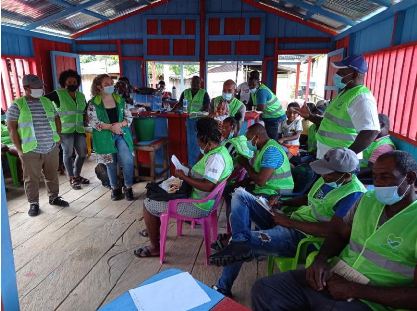
Nota. Espacio de socialización CPP, Urabá Antioqueño.