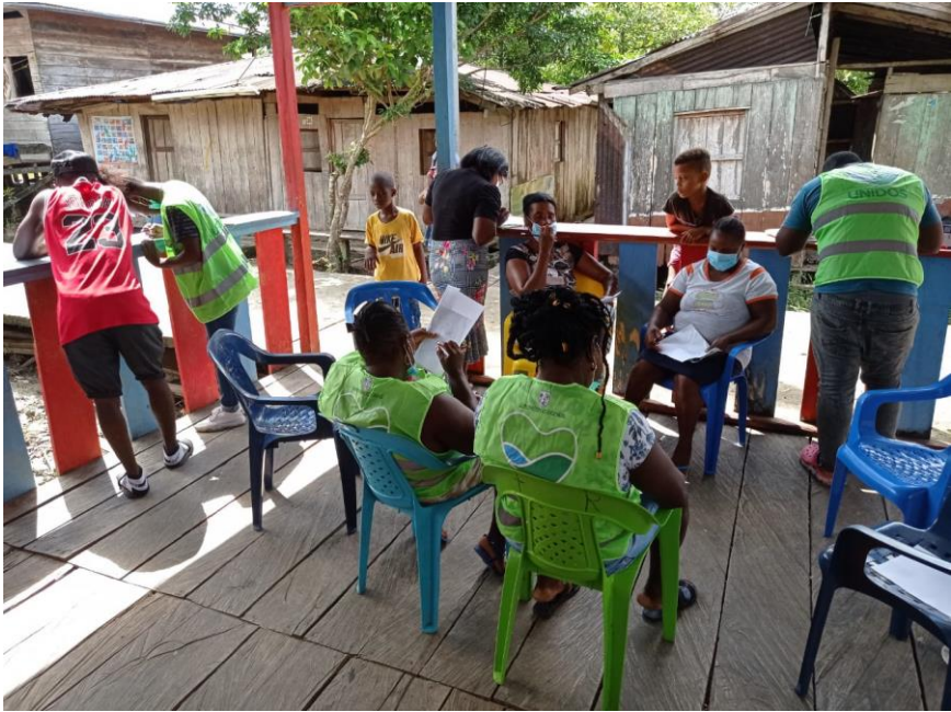
Nota. Espacio de socialización CPP, Urabá Antioqueño.