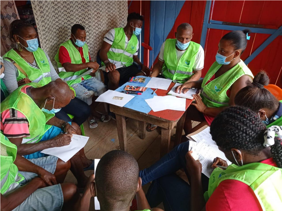
Nota. Espacio de socialización CPP, Urabá Antioqueño.