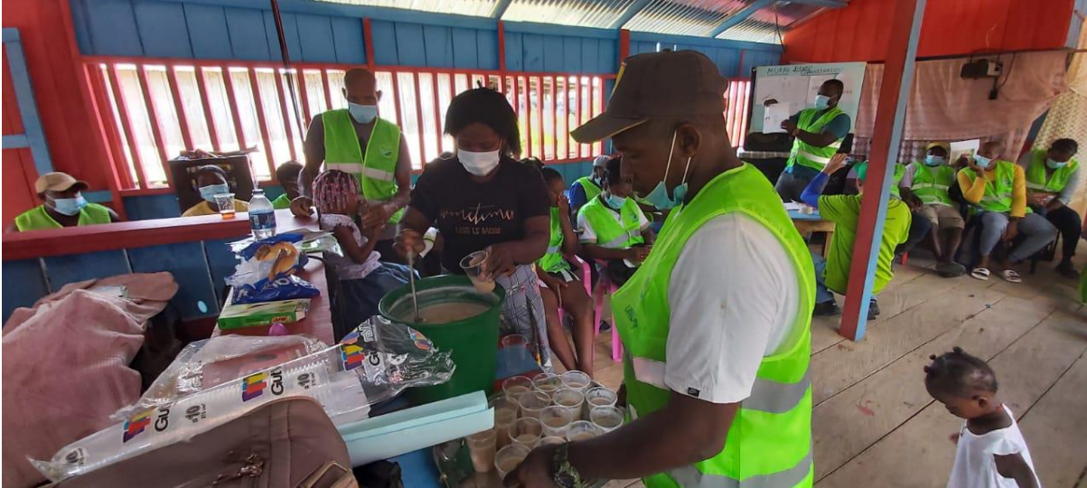
Nota. Espacio de socialización CPP, Urabá Antioqueño.