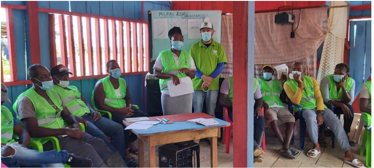
Nota. Espacio de socialización CPP, Urabá Antioqueño.