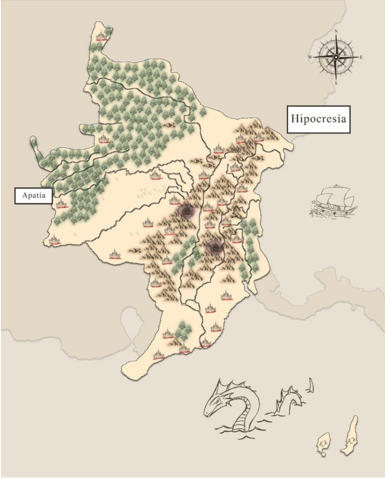
Ilustración 1: Mapa de Hipocresía