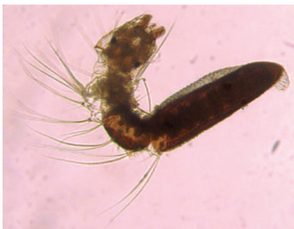
Figura 2. Larva de Anopheles albitarsis s.l. eclosionando del huevo. 100X.

comenzaron a incluir datos cuantitativos para características medibles que permitieron el análisis comparativo entre grupos. A mediados del siglo XX, la descripción cuantitativa de la forma se combinó con análisis estadísticos para describir variaciones entre y dentro de grupos con base en la conformación de estructuras anatómicas como el ala, mediante el uso de puntos de referencia o “landmarks” (Figura 6); ello marcó el inicio de la morfometría geométrica.