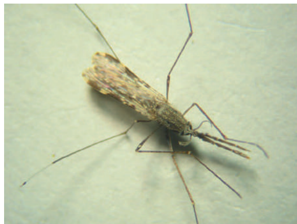
Figura 4. Vista superior de un espécimen An. albimanus donde se observa el patrón de manchas alares en la vena costa. 6,7 X.