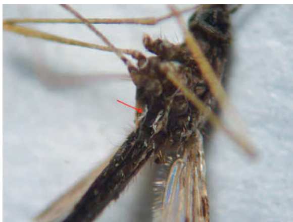
Figura 3. Vista ventral del tórax de An. albitarsis s.l., indicando dos líneas submediales de escamas claras presentes en el Sternum I. 15X.