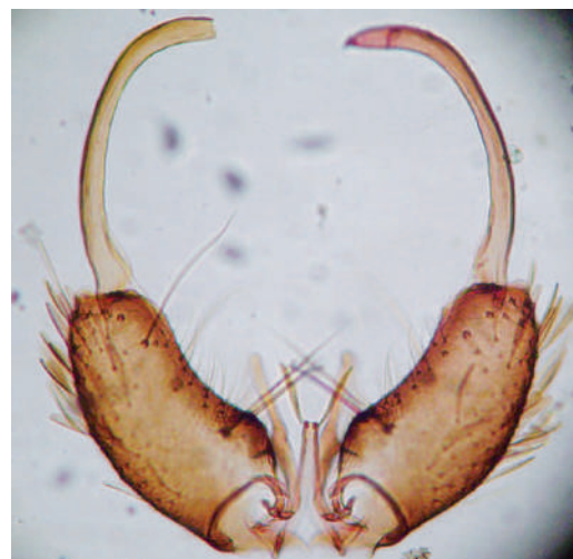
Figura 5. Genitalia masculina de Anopheles neomaculipalpus . Aedeagus largo con par de hojillas terminales. 100 X.