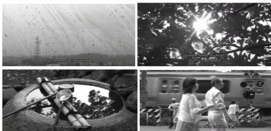
Imágenes tomadas de Correspondencias filmicas (2011)

En las cartas anteriores hay un complemento que son los caminos que he recorrido para llegar a las cartas y los que he caminado en mi vida, cuando era niña recuerdo mucho estar en el bus de camino a donde mi padre y de regreso a casa de mi madre observando por la ventana, en la adolescencia recorrer mi pueblo para escapar de los problemas de adolescente y ahora vuelvo a estar de la ciudad al pueblo así que en las tres cartas estas imágenes van a estar muy presentes y para ello están como referentes la serie de correspondencias filmicas donde los cineastas recorren algunos lugares con sus cámaras y Embracing; lo que más me llamó la atención de esto son las sombras y los reflejos que son interesantes para ese componente de recuerdos borrosos que se convierten con el tiempo en historias vistas desde otro punto de vista. Esta última carta busca explotar estas imágenes en mayor intensidad ya que es lo que queda de la búsqueda emprendida en el proyecto.