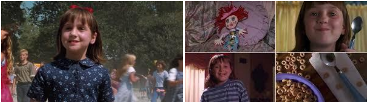
Imágenes tomadas de Matilda (1996)

que existían algunas fotografías que desconocía, se despertó el deseo por enseñarlas y darles la importancia que han tomado para mí en esta búsqueda.