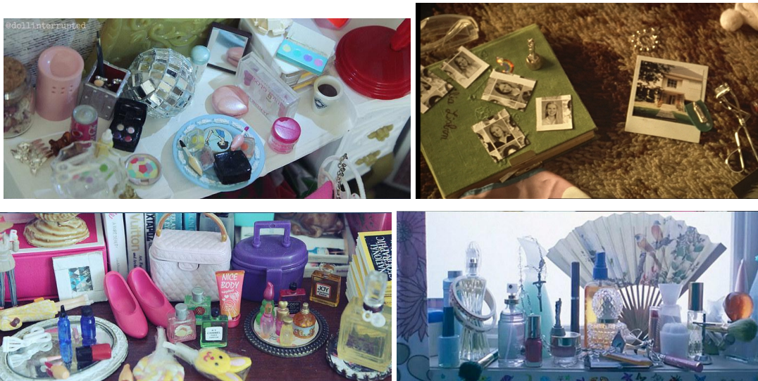
Imágenes tomadas de Las virgenes suicidas (1999)

En las cartas anteriores hay un complemento que son los caminos que he recorrido para llegar a las cartas y los que he caminado en mi vida, cuando era niña recuerdo mucho estar en el bus de camino a donde mi padre y de regreso a casa de mi madre observando por la ventana, en la adolescencia recorrer mi pueblo para escapar de los problemas de adolescente y ahora vuelvo a estar de la ciudad al pueblo así que en las tres cartas estas imágenes van a estar muy presentes y para ello están como referentes la serie de correspondencias filmicas donde los cineastas recorren algunos lugares con sus cámaras y Embracing; lo que más me llamó la atención de esto son las sombras y los reflejos que son interesantes para ese componente de recuerdos borrosos que se convierten con el tiempo en historias vistas desde otro punto de vista. Esta última carta busca explotar estas imágenes en mayor intensidad ya que es lo que queda de la búsqueda emprendida en el proyecto.