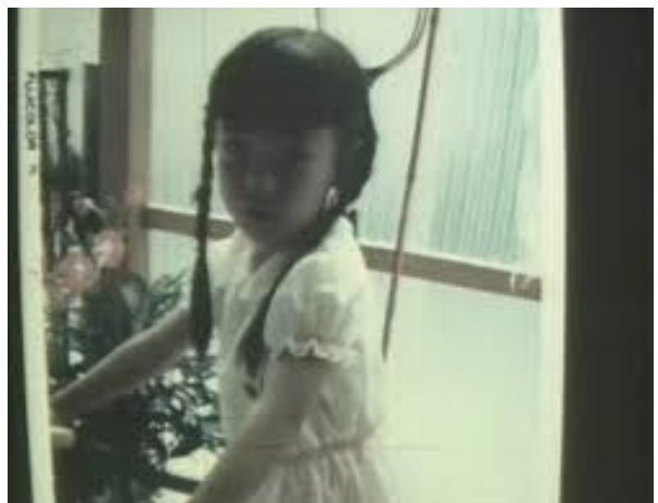
Imágenes tomadas de Embracing (1992)

En la segunda carta la Ausencia se ve reflejada por medio de los pequeños detalles de ser una joven adolescente y de los cambios por los cuales se atraviesa en esa etapa de la vida por eso uno de los referentes es las vírgenes suicidas 1999 donde los detalles de ser joven son tan importantes.