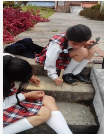
Fotografía 2 y 3: Elaboración Objetos Musicales.

Otra de las estrategias musicales implementadas, consistió en percudir en diferentes partes del cuerpo para generar sonidos. Evidenciando en los estudiantes disposición e interés por la actividad, iniciada con las palmas de las manos, aplaudir, zapateo, percusiones en hombros, glúteos y pecho. Al mismo tiempo se observaron dificultades de coordinación y ritmos diferentes para la realización de las secuencias propuestas. En el transcurso del proceso, los estudiantes improvisaban y proponían otros movimientos y sonidos como chasquidos de los dedos, silbidos, entre otros, cuyas