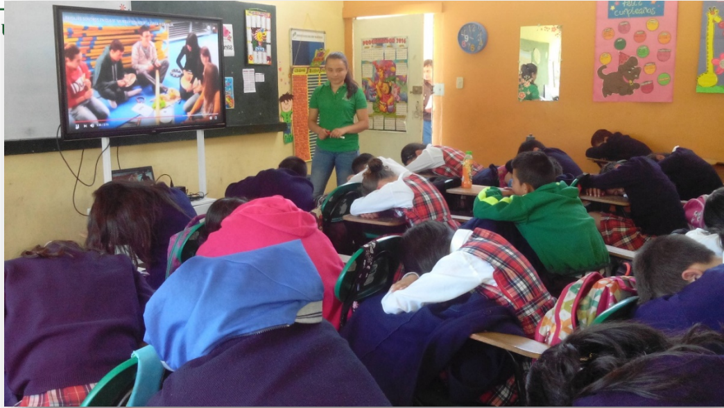
Fotografía 1: identificación de sonidos.

También, con la implementación de actividades abordadas con el elemento melódico desde la voz cantada y hablada del estudiante como el rap, la retahílas, tonos altos, medios y bajos, se visualizó la atención selectiva ya que cada uno debía seleccionar la información que considerara importante para dar respuesta acertadamente a la presentación asignada, (convertir un fragmento de un texto, en un rap, en una retahíla, o en tonos altos medios y bajos). Situación en la que se observaron actuaciones y respuestas en cumplimiento con las instrucciones y los requerimientos orientados.