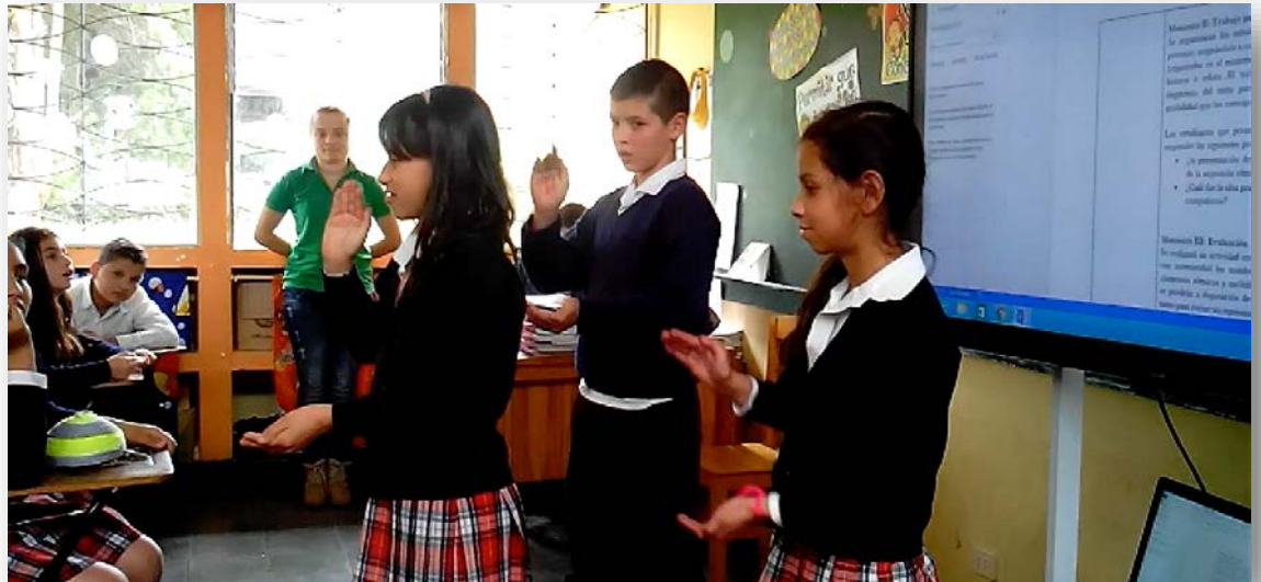
Fotografía 4: Percusión Corporal.

La movilización de los estudiantes a partir de este tipo de actividades, es tan gratificante que se logra otro tipo de beneficios como en el caso de C. A, un estudiante caracterizado como responsable, comprometido, pero tímido para la participación y expresión o comunicación. En uno de los escenarios presentó el siguiente escrito: “los